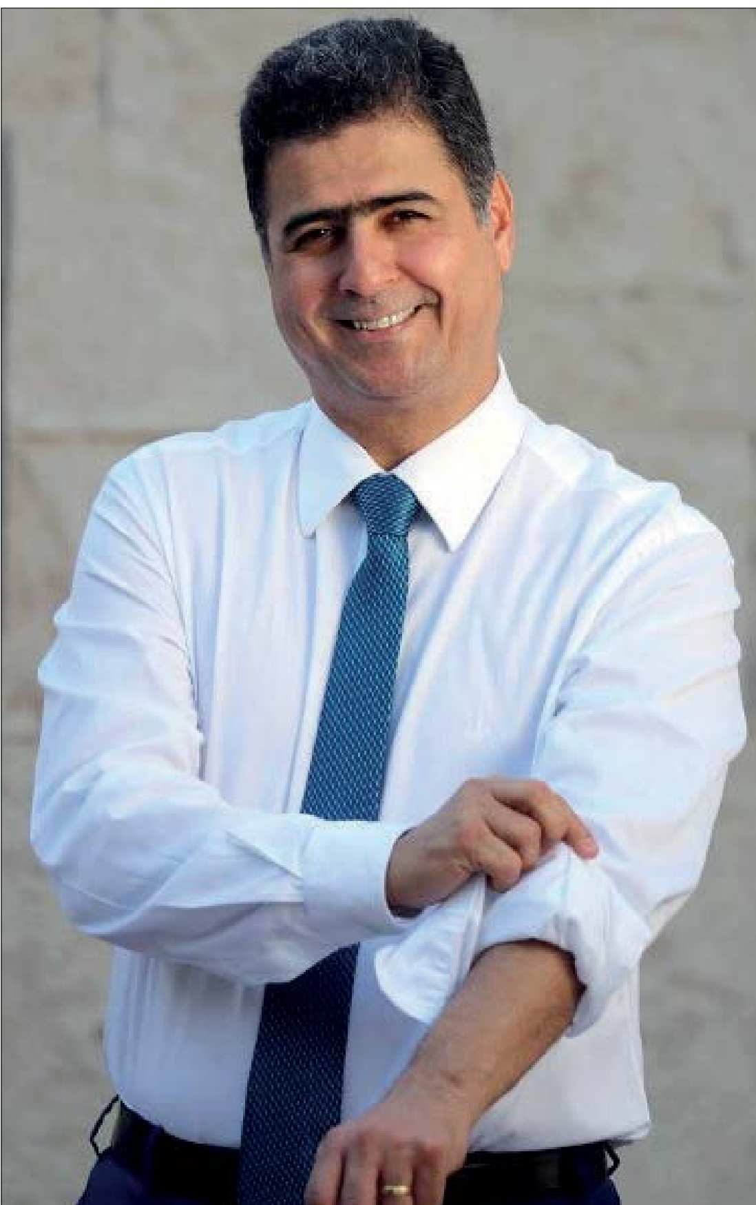
Nosso prefeito Emanuel Pinheiro, que já está arregaçando as mangas para dar continuidade na boa administração da nossa capital de Mato Grosso. A coluna é super fã do seu trabalho!