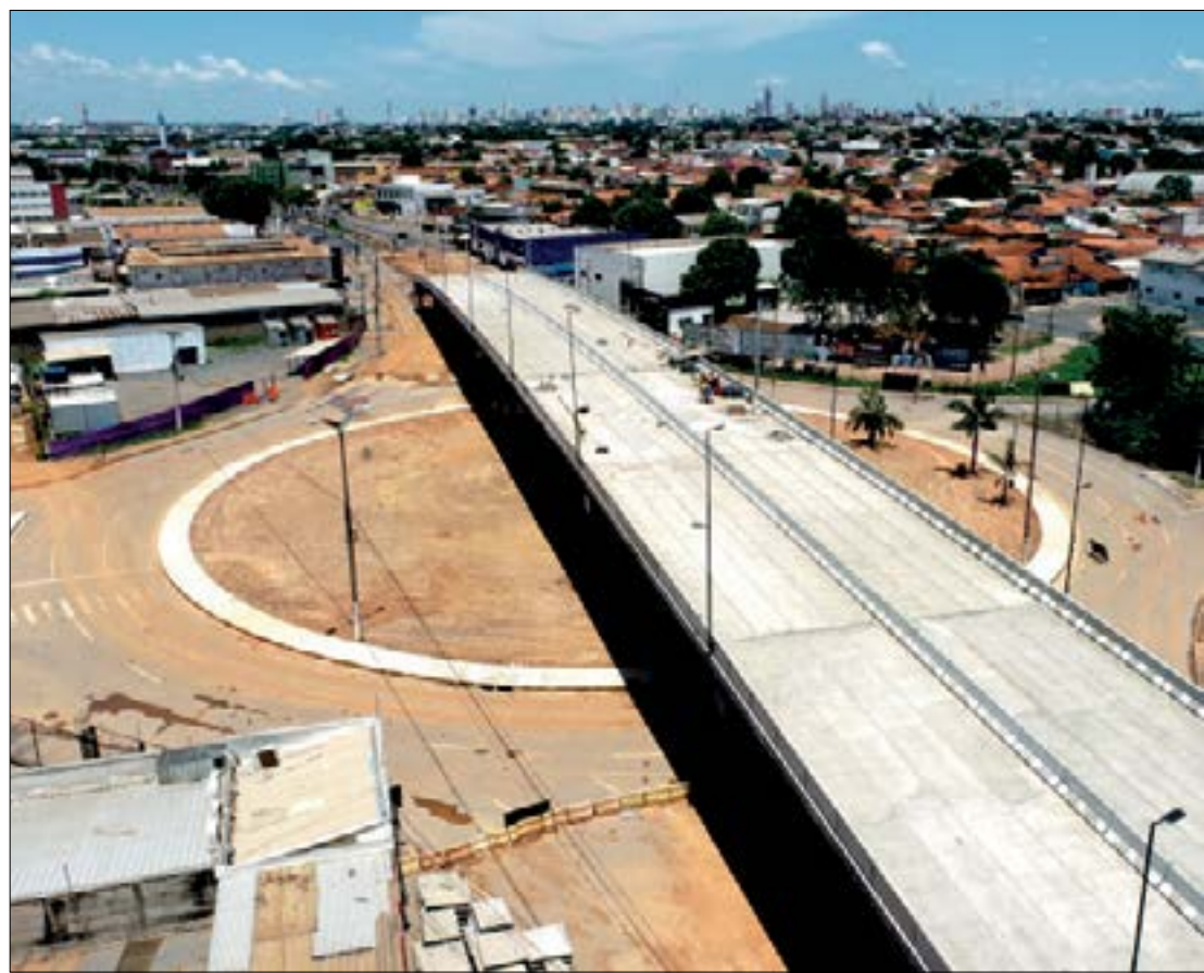
A nova interdição na rotatória da Avenida Beira Rio irá ocorrer para dar continuidade às obras do Viaduto Murilo Domingos