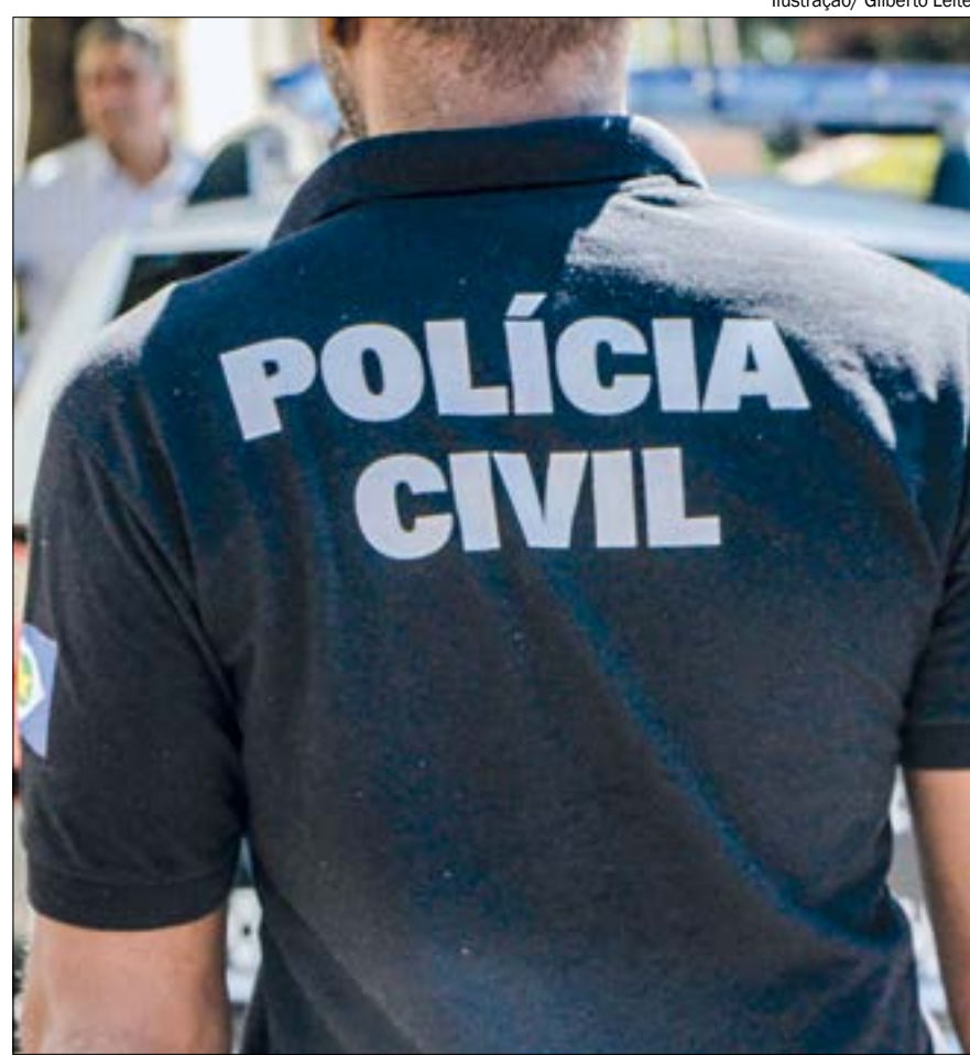
Ilustração/ Gilberto Leite

As vítimas procuraram a Polícia Civil para prestar queixa após descobrirem que, em comum, além de serem ex-companheiras do acusado, também haviam contraído HIV. Segun-