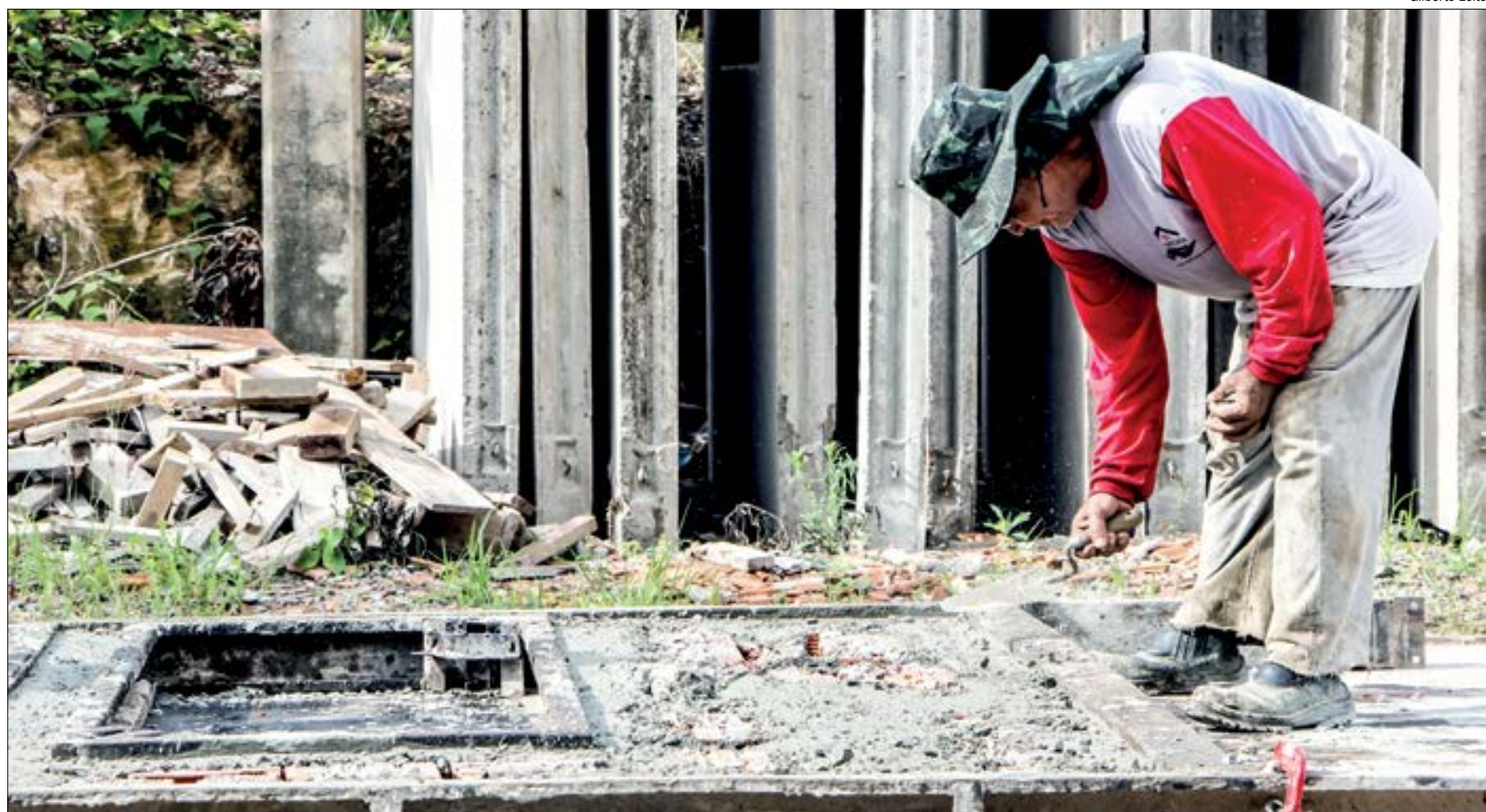
Cuiabá é uma das cidades que deve contribuir para o crescimento do mercado imobiliário em 2021

“Sempre reforçamos às pessoas que uma forma de economizar é que optem por comprar imóveis na planta. Esse é o momento em que o imóvel está mais barato e com juros menores também. Neste ano estamos com alta demanda de crédito e um mercado imobiliário mais ativo, mas esses imóveis ficarão mais caros ou terão reajustes por causa do aumento dos preços