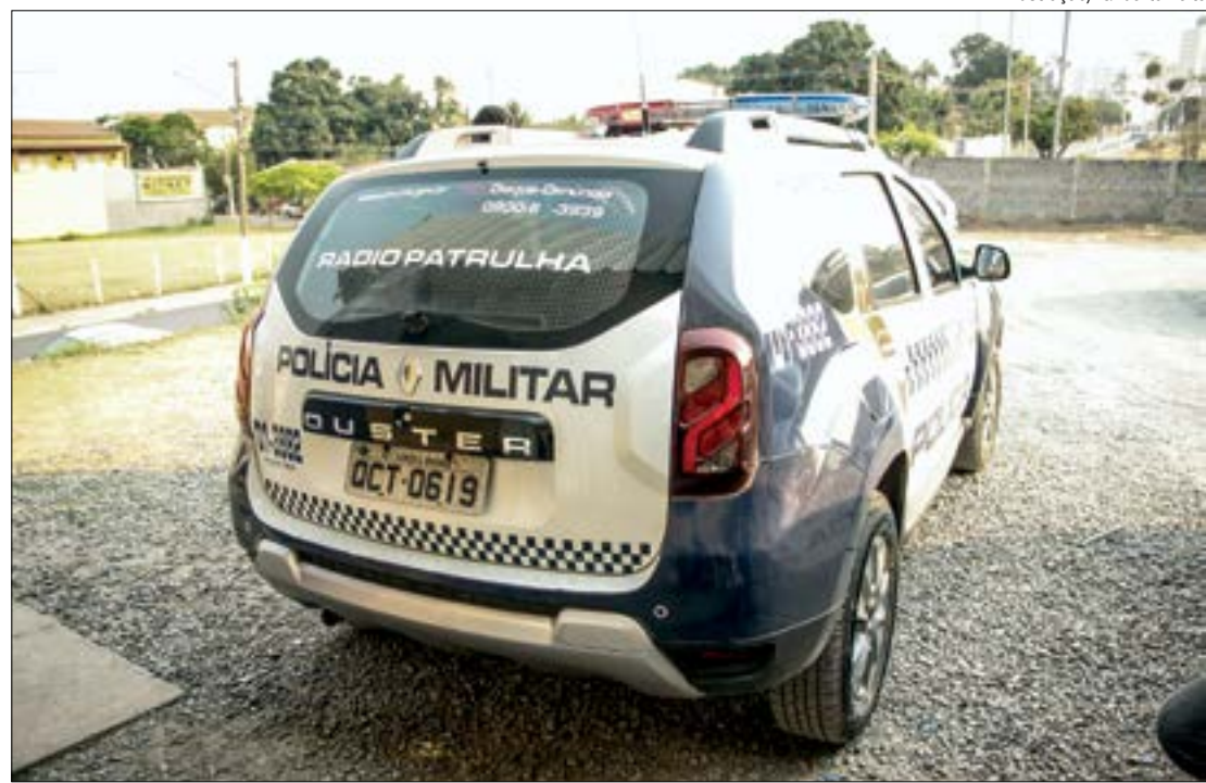
Em uma semana, esse é o segundo caso de agressão registrado após ‘salve’ de membros do CV