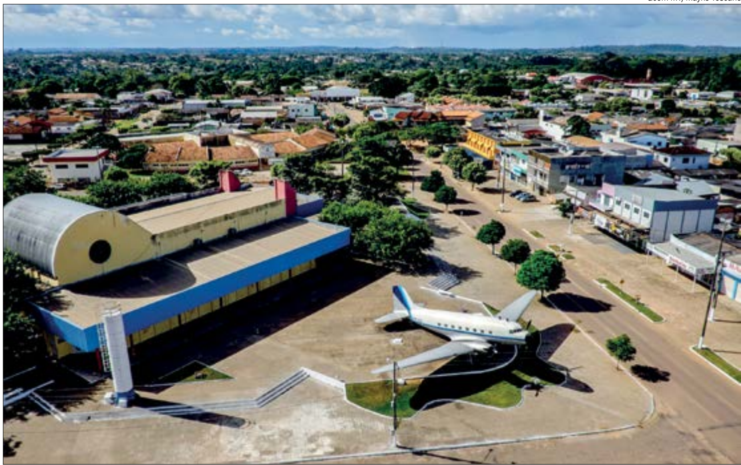
Alta Floresta, foi um dos 22 municípios que não entregou o documento de renúncia sobre as ações judiciais de compensação de perdas