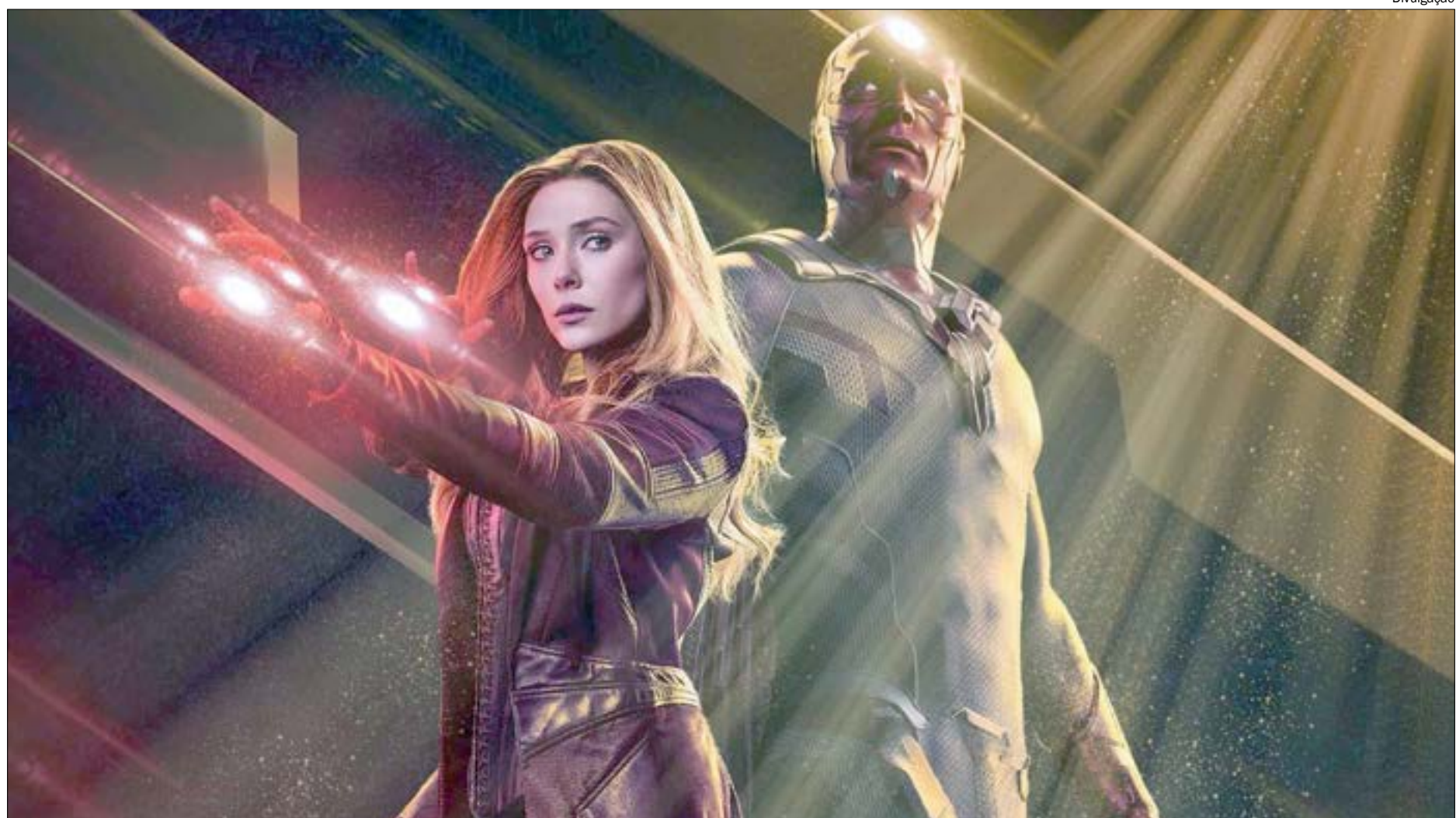
Neste mês o serviço vai ganhar uma de suas mais aguardadas produções: WandaVision

Novo filme da Pixar, estreou no Disney+ no dia 25 de dezembro e já conquistou o coração de muitos espectadores. Antes previsto para