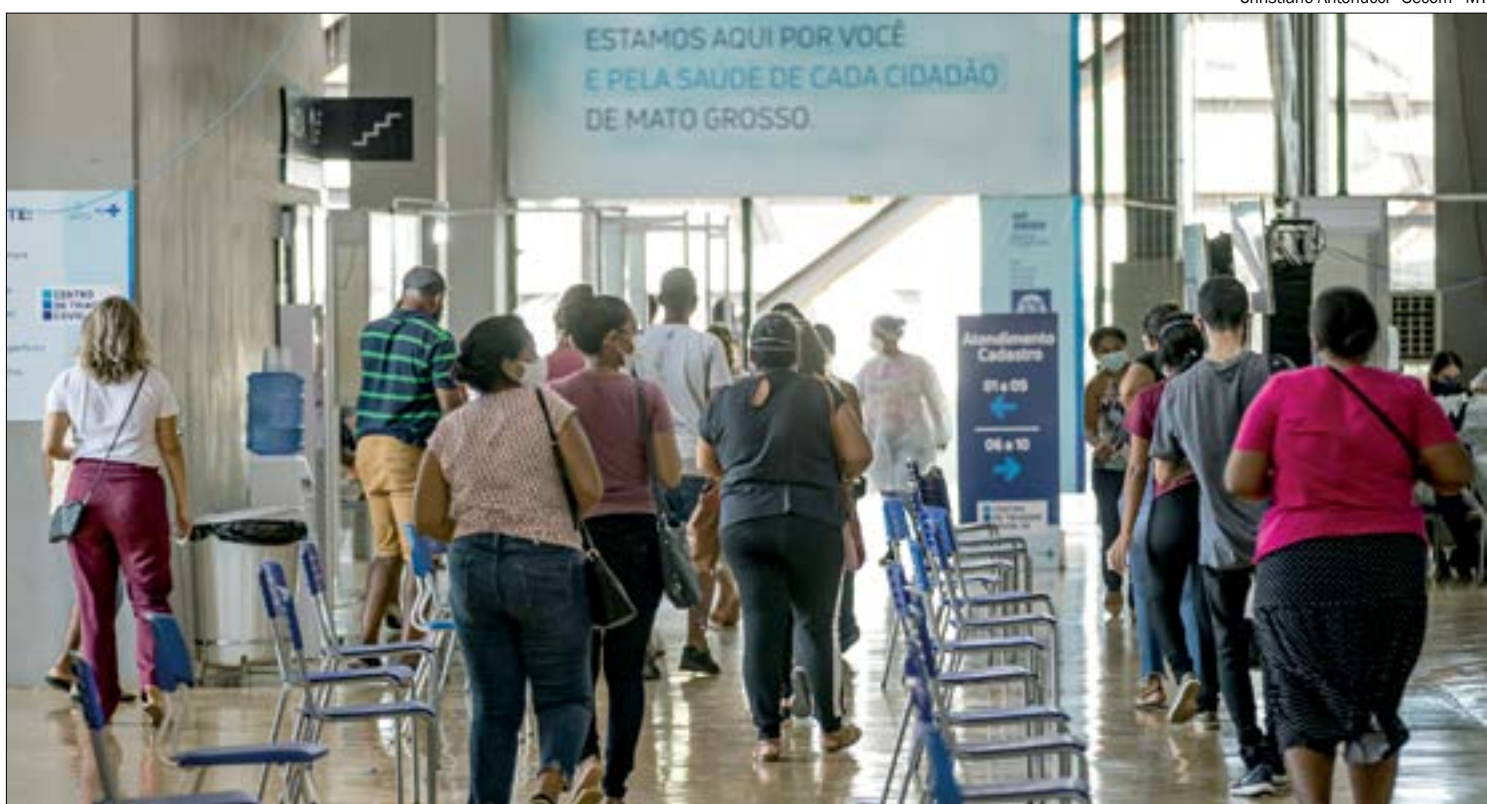
Aumento de casos faz senhas do Centro de Triagem se esgotarem em minutos

Além do Centro de Triagem, disponibilizada pelo governo, a Prefeitura Mu-