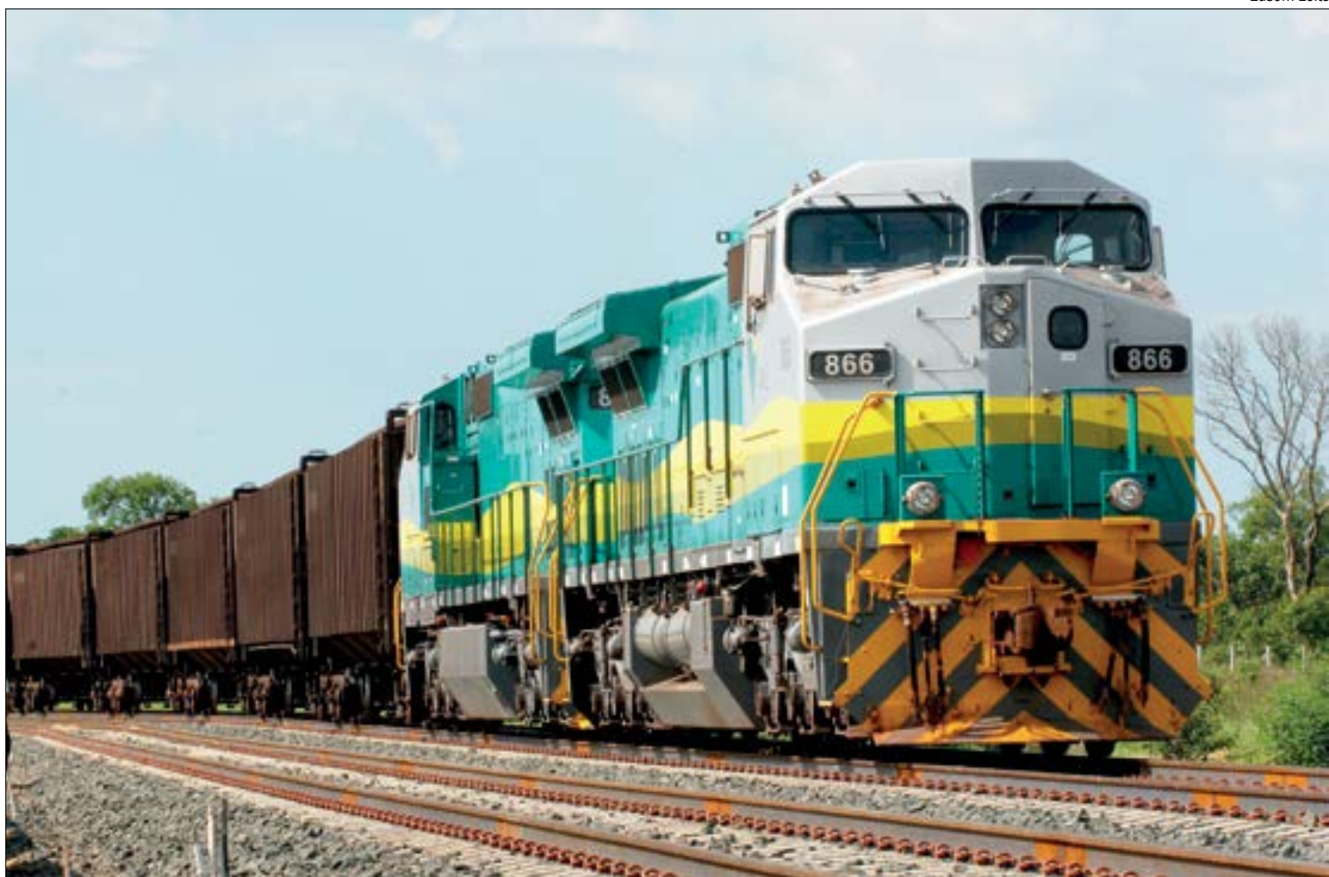
Cinco grandes projetos estão em andamento, entre eles a Ferronorte, a Fico e a Ferrogrão

FERRONORTE - Os trilhos da Ferronorte atualmente encontram-se em Rondonópolis. Operada pela concessionária Rumo, existe um projeto de investimentos na ordem de R$ 6 bilhões na extensão da ferrovia até Cuiabá e depois seguindo para o Norte, até Sorriso. Ao todo, o projeto da empresa prevê a construção de três novos terminais para o transporte da produção agrícola e industrial. O avanço dos trilhos da Ferronorte está sendo possível graças à renovação antecipada da chamada Malha Paulista.