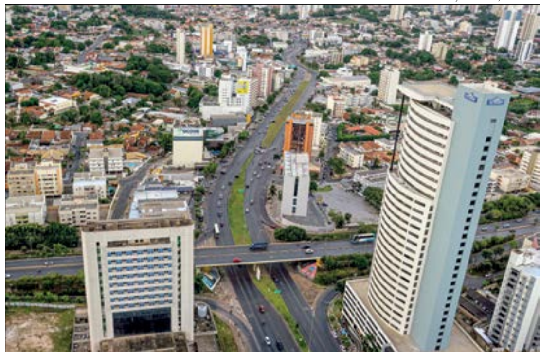
Ritmo da construção civil contribuiu para criar empregos em 2020