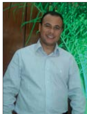
Pr Jean Klebber

Somos todos um em 2021, só resta saber quem de fato queremos ser, e o que faremos sendo.