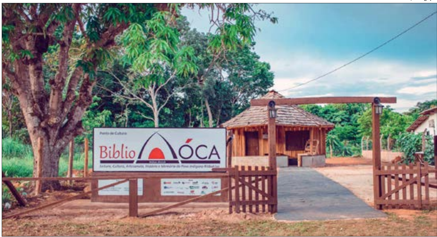
BibliÓca é um espaço para preservar e difundir a cultura e o conhecimento da etnia Rikbaktsa

Com entrada gratuita e aberto ao público em geral, o local é ponto de referência para visita e contato específico com a cultura indígena. O projeto planejado com a participação da comunidade visa dar visibilidade à história do povo Rikbaktsa e tem potencial para se tornar um ponto turístico do distrito de Fontanillas, que fica a 45 km de Juína, e é cortado pelo majestoso rio Jurueña.