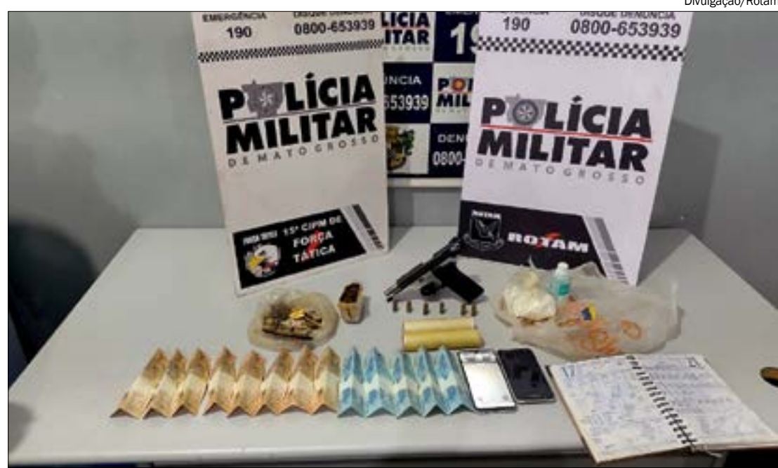
Em revista à casa do suspeito, policiais encontraram caderno com anotação de devedores