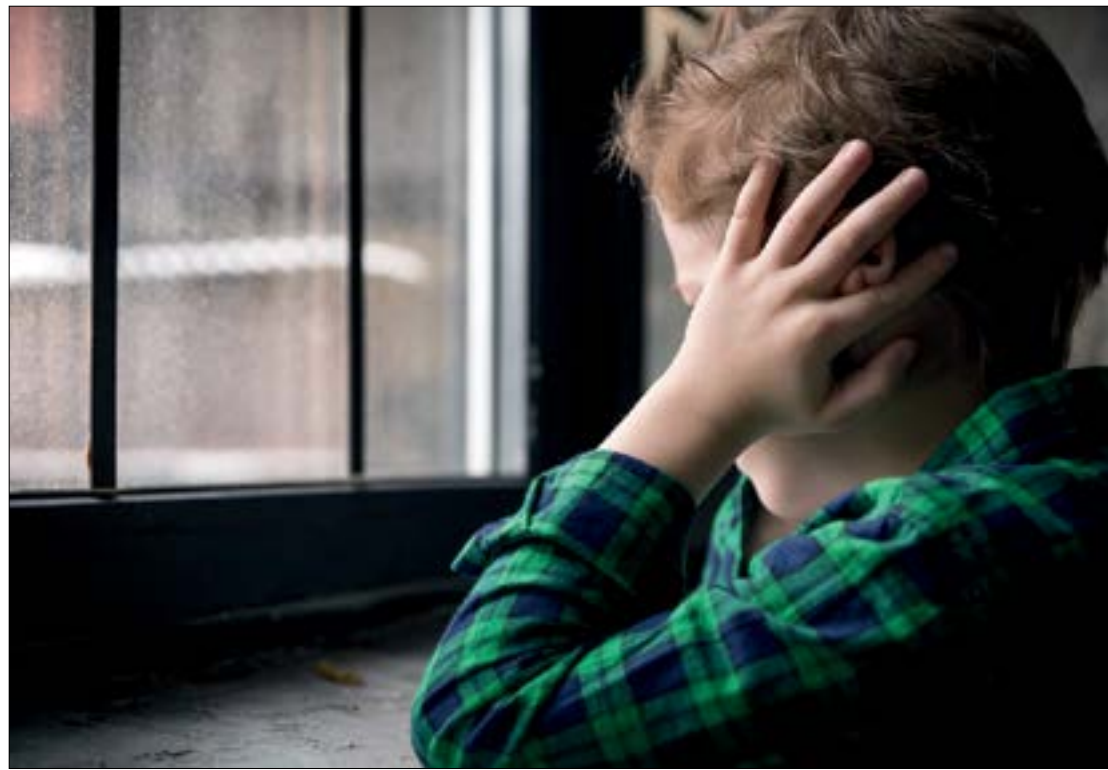
Sensíveis ao som, crianças autistas sofrem com o barulho provocado pelos fogos de artifício

“Essa hipersensibilidade do autista nem sempre tem uma divulgação e repercussão como no caso dos animais, por falta de conhecimento. Por meio de leis, isso pode passar a ter uma maior abrangência e promover a conscientização de que