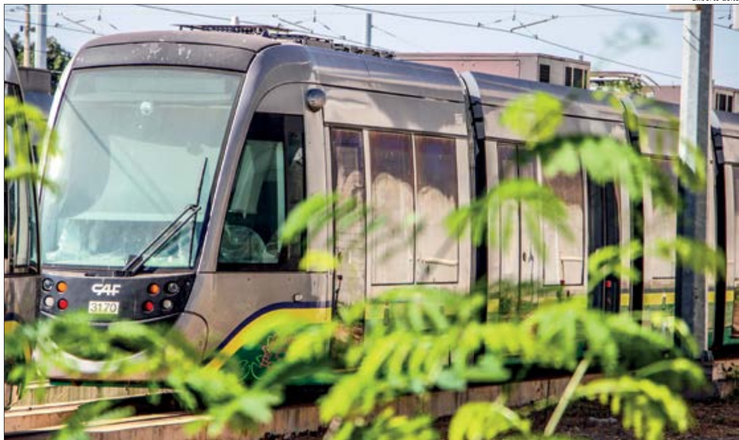
Juiz teme que materiais do VLT se deteriorem até o fim do processo e manda empresa leva-los de volta à Espanha

No processo, o Estado cita que, após Cuiabá ser escolhida para uma das cidades-sedes da Copa do