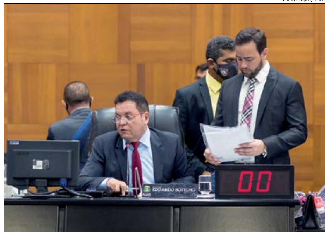
Após muito debate em 2020, reforma da Previdência deve voltar à pauta da AL em 2021