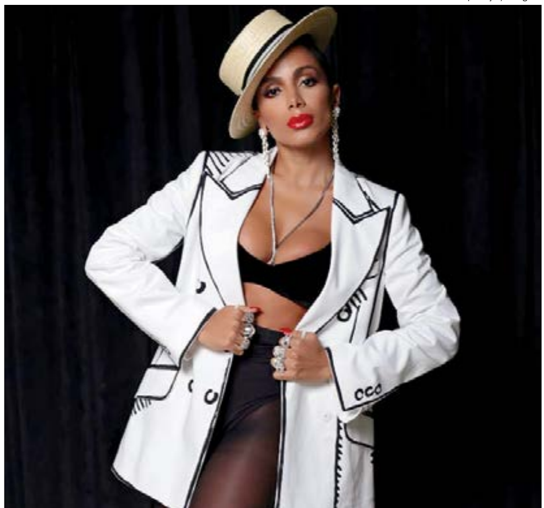
Anitta será uma das grandes atrações do réveillon de Nova Iorque, na Times Square

Pelas redes sociais, os shows poderão ser assistidos no Facebook e Twitter da Times Square.