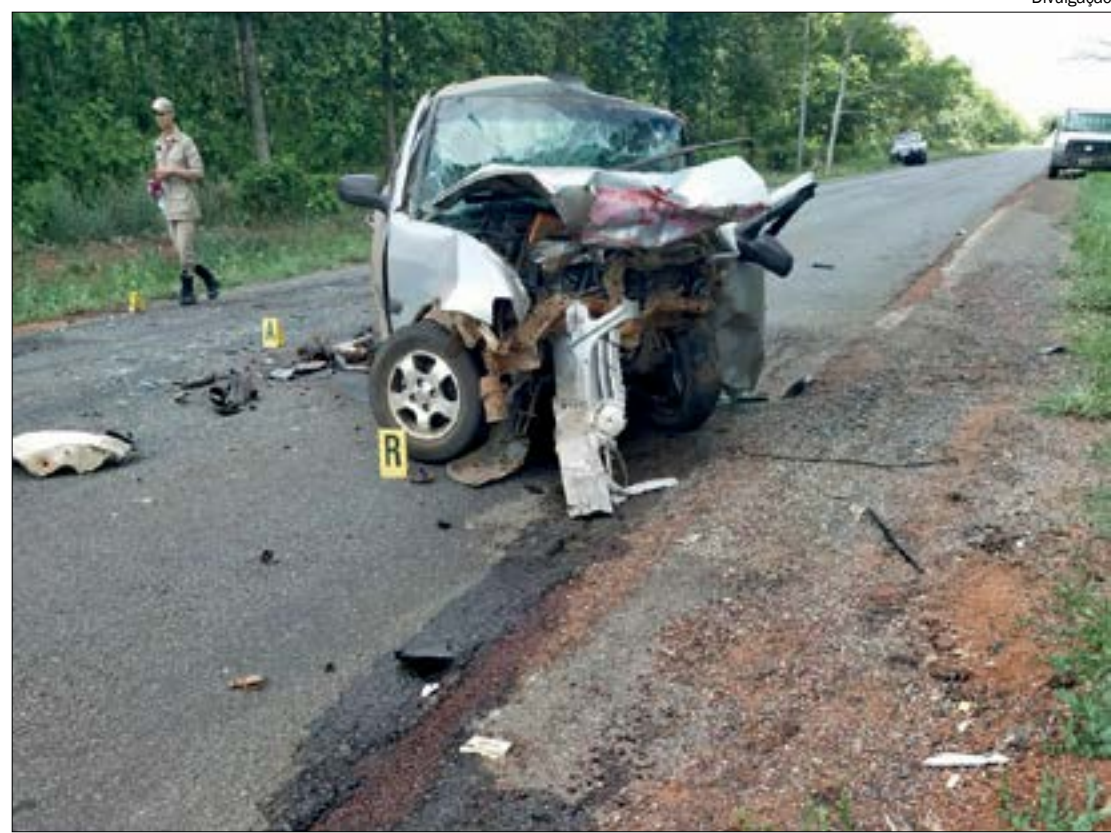
Três sobreviventes do acidente foram encaminhados ao hospital em estado grave

O Corpo de Bombeiros também se fez presente para retirar uma das vítimas que ficou presa às ferragens.