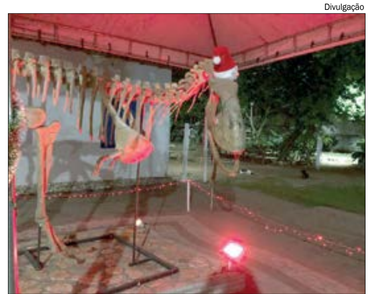
Visita especial tem até dinossauro vestido de Papai Noel

Visitas de Natal no Museu de História Natural Endereço: Av. Beira Rio, nº 2000, bairro Dom Aquino, Cuiabá Data: 18 e 19 de dezembro Horário: das 8h às 21h Mais informações pelo telefone: (65) 3634-4858