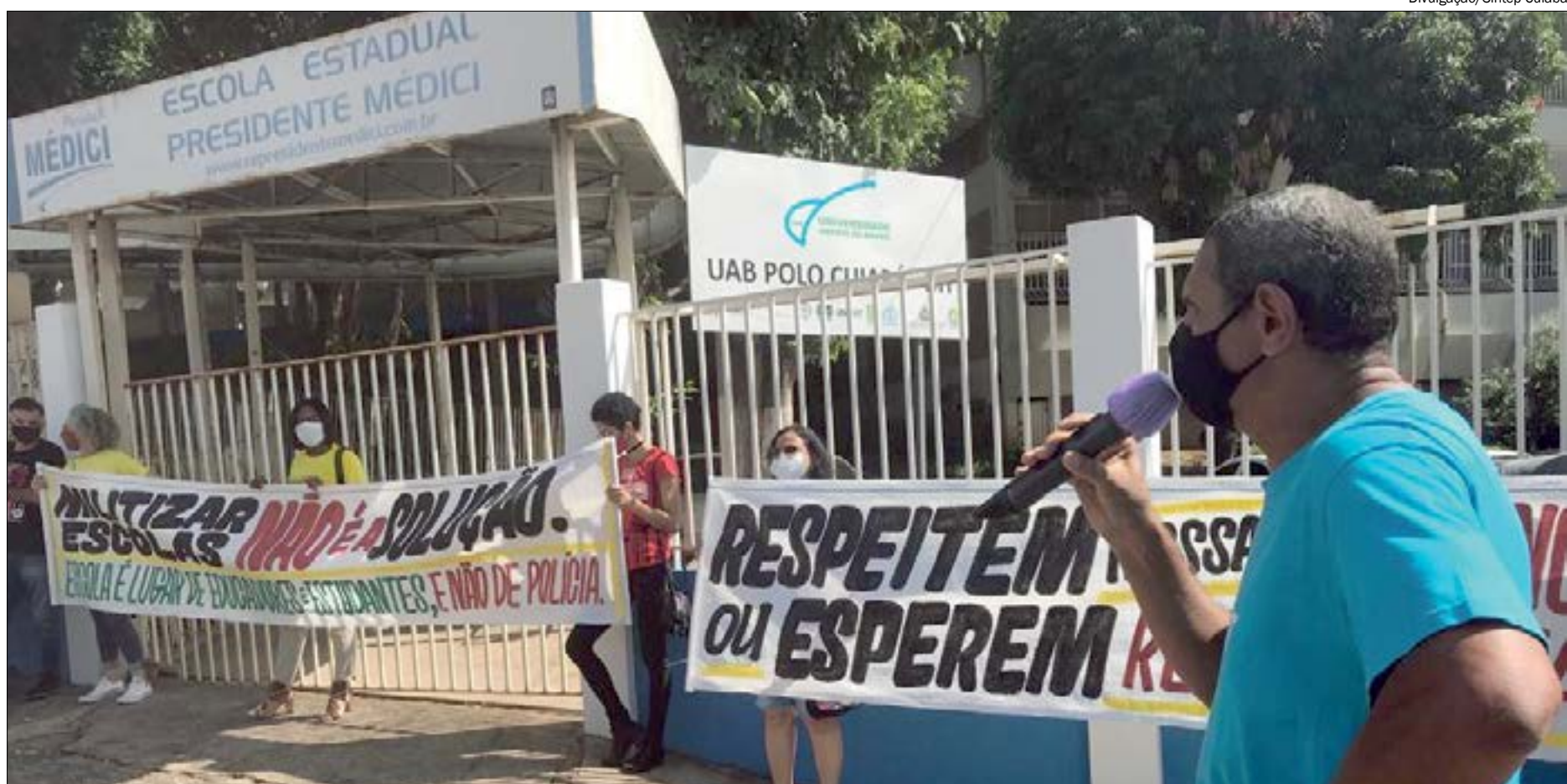
Transferência de gestão da Escola Presidente Médici para Polícia Rodoviária Federal é criticada por pais e professores