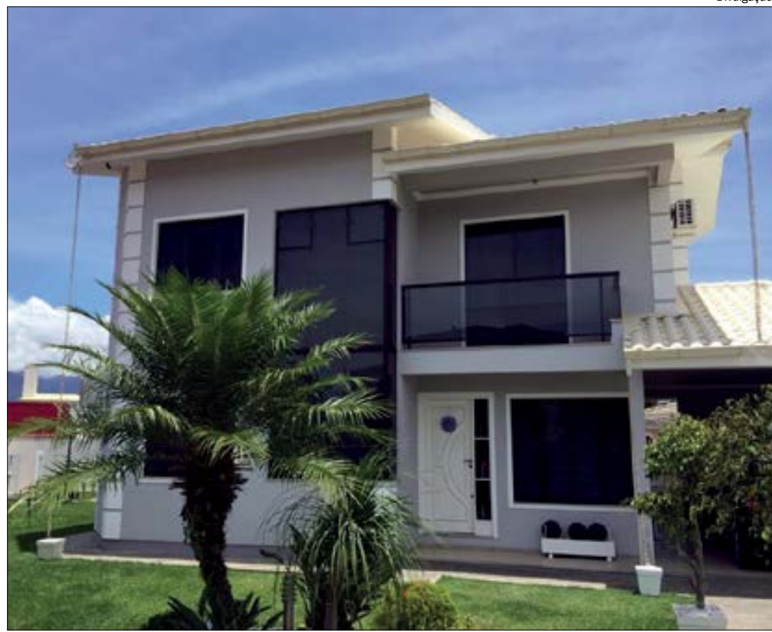
Imóveis de alto padrão são os mais procurados em Mato Grosso