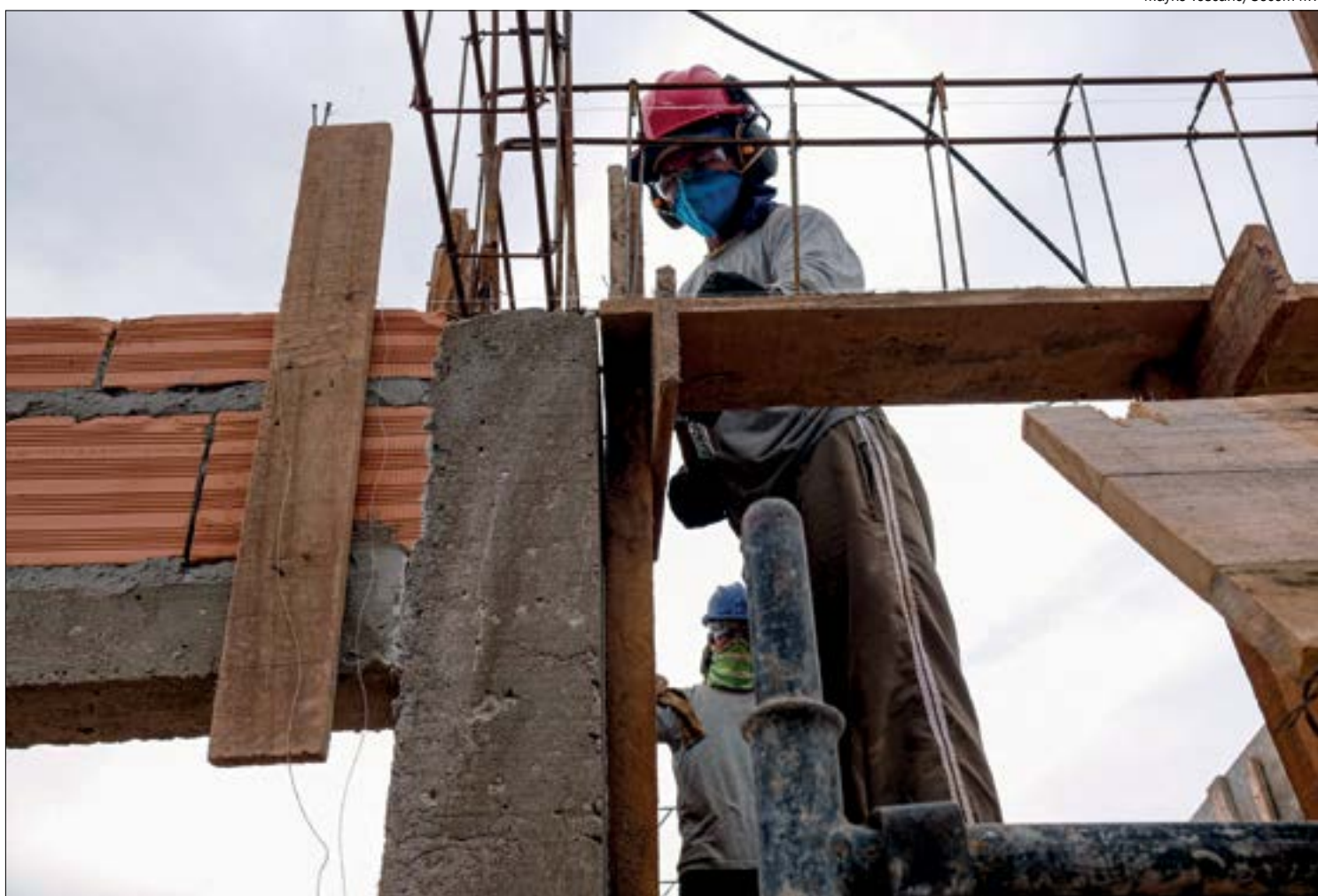
Construção civil foi o setor que mais gerou empregos no país até outubro, com 189 mil vagas

A procura por imóveis cresceu durante a crise, em razão dos estímulos econômicos: facilitação de acesso ao crédito, redução histórica da taxa básica de juros,