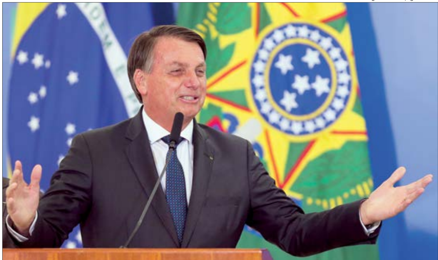
Ao assinar a MP, Bolsonaro destaca que a vacinação acontecerá de forma gratuita e voluntária

Como se trata de um crédito extraordinário, a MP não depende da aprovação da Lei Orçamentária de 2021. Contudo, a medida provisória ainda precisa ser submetida à apreciação do Congresso