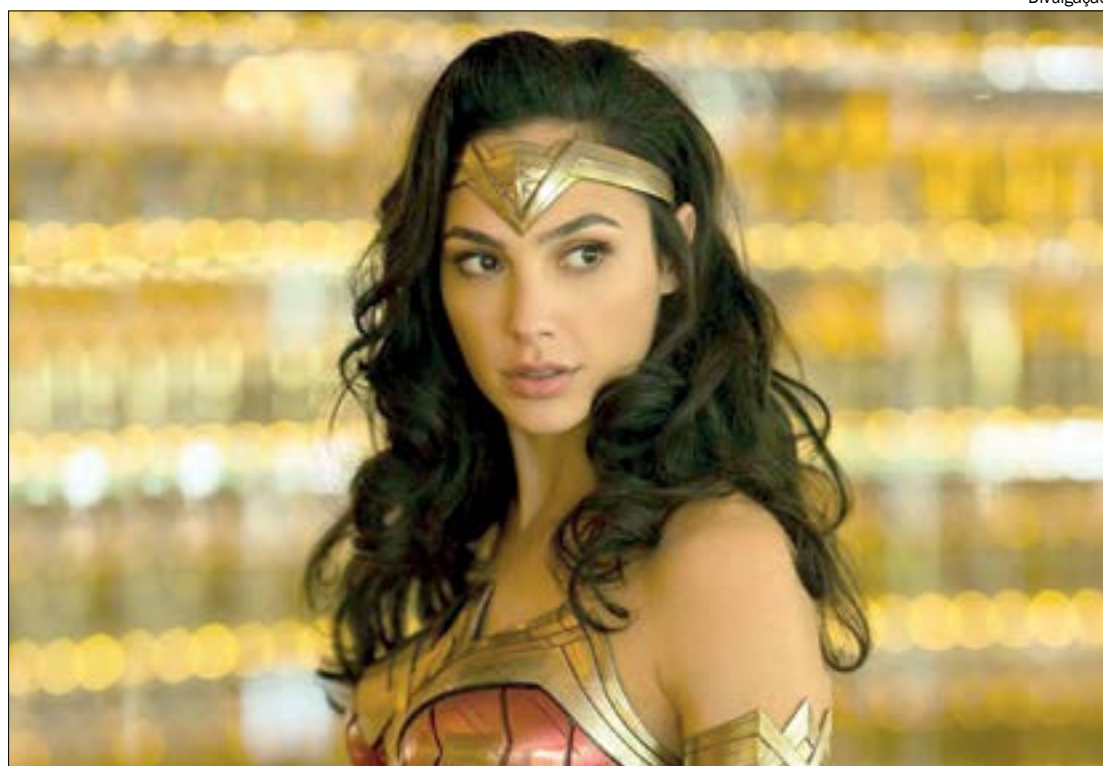
Diana está de volta mais humana do que nunca, com uma aventura cheia de mensagens necessárias para este momento