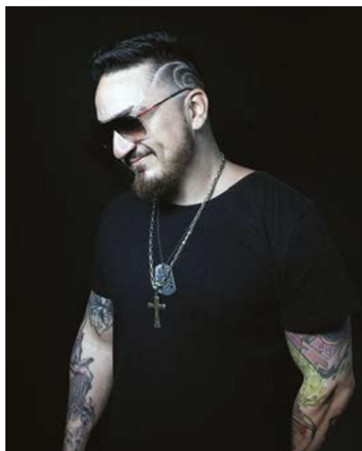
Mr. Nose, que se destaca com black music/funk, no estilo autêntico