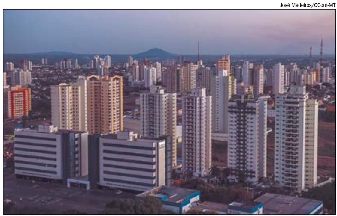
Lançamentos do quatro trimestre subiram 28,3% em relação ao 3º trimestre de 2019

lizados caiu de 1.066 em 2018 para 869 em 2019. Uma queda de 18,5%. Na direção contrária, a comercialização dos usados aumentou 8,9%, sendo 7.047 (2018) e 7.677 (2019).