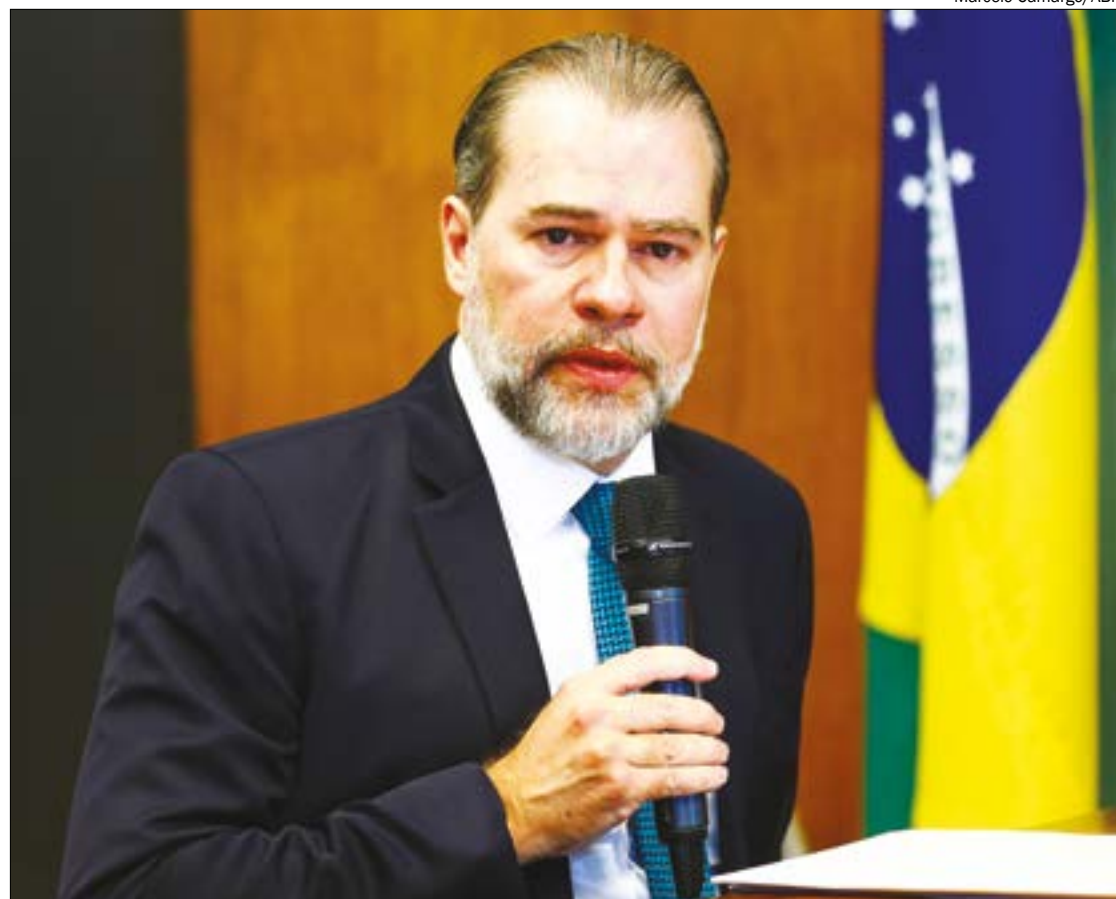
Para o ministro Toffoli, a pesquisa contribuiu para que o assunto seja discutido com base em dados da realidade

A pesquisa do CNJ foi feita a partir do Cadastro Nacional de Adolescentes em Conflito com a Lei, que é alimentado pelas Varas da Infância e da Adolescência de todo o país. O próprio estudo, porém, reconhece “a fragilidade dos dados” diante da falha no preenchimento de formulários e inconsistências nas informações, embora considere os achados válidos para indicar tendências.