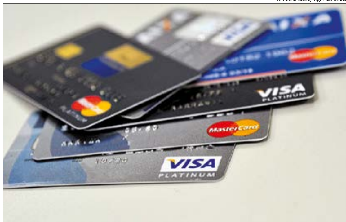
Bancos devem efetuar a conversão em reais com base na cotação da data da compra

DE OLHO NA FATURA – Em relação à fatura, é obrigatória a presença do demonstrativo de gastos ou lançamentos de compras no cartão de crédito, com informações de todas as compras efetuadas – no Brasil ou no exterior – e indicação do estabelecimento, data, número de parcelas e valor. No caso de compras fora do país, também é preciso identificar a moeda estrangeira e seu referido valor; o valor equivalente em dólar na data do gasto; a taxa de conversão do dólar para reais na data da compra; e o valor em reais que será pago pelo cliente.