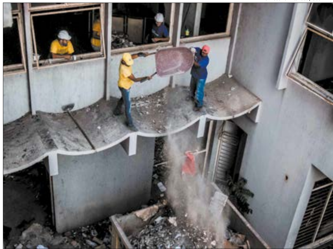
Perfil dos imóveis comercializados serve como referência para os investidores

Outro comportamento de consumo é observado nas demais regiões – nor-