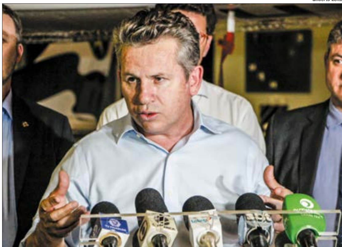
Governador diz acreditar em votação pacífica da reforma da Previdência estadual

“Olha eu acredito que não, pois aqui temos respeito à democracia. E vou dizer aquilo que já disse: hoje mais de 90% de todos os mato-grossenses estão nessa regra”, afirmou. “Eu não vejo nenhuma iniciativa para que o servidor público ou uma parte deles possam se aposentar com 45, com 46 ou com 50 anos. Nós estamos mandando uma lei dando a todos os mato-grossenses os mesmos direitos, já que nós temos os mesmos deveres”, concluiu.