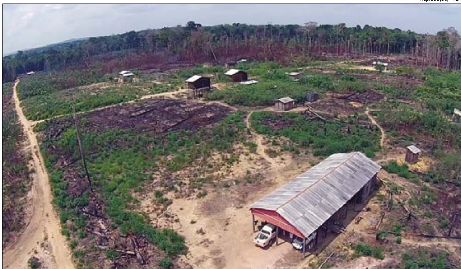
Chacina de 9 trabalhadores rurais em Colniza (MT) ocorreu em abril de 2017 e chocou o país

A JBS acabou não cumprindo o acordo firmado e, em 2017, o Greenpeace deu fim ao acordo. A empre-