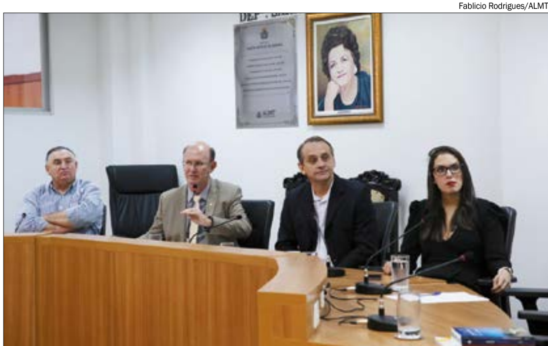
CPI aprovou convocação de ex-secretário que confessou propina de R$ 1,9 milhão