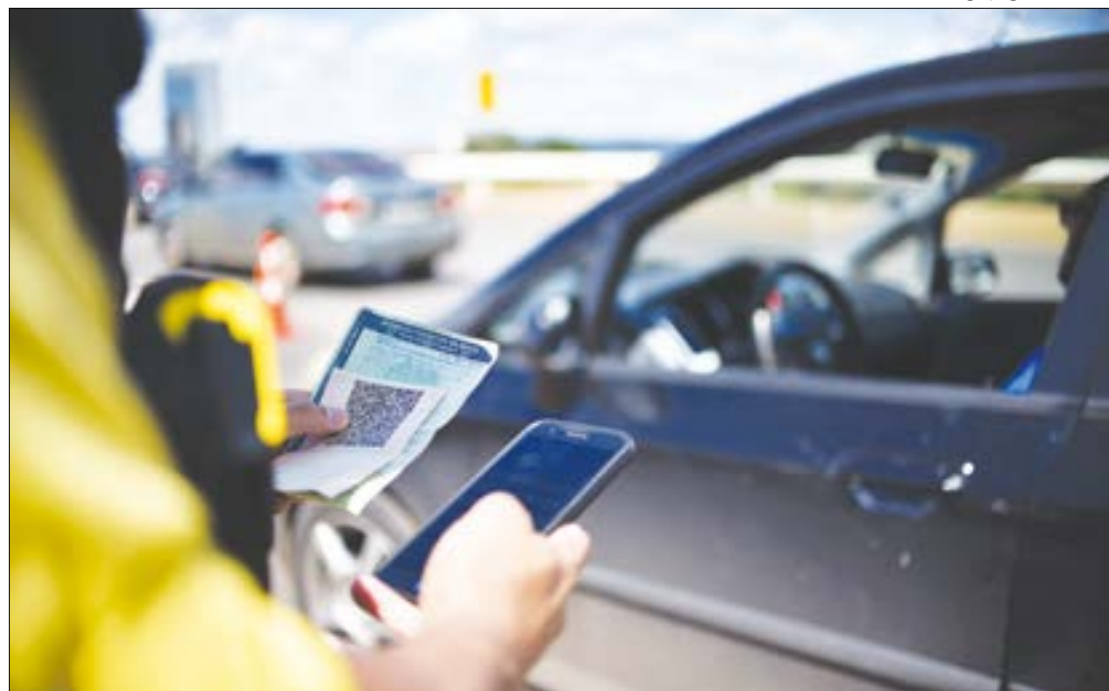
Para os motoristas que ainda não utilizam a Carteira Digital de Trânsito, o processo continua o mesmo