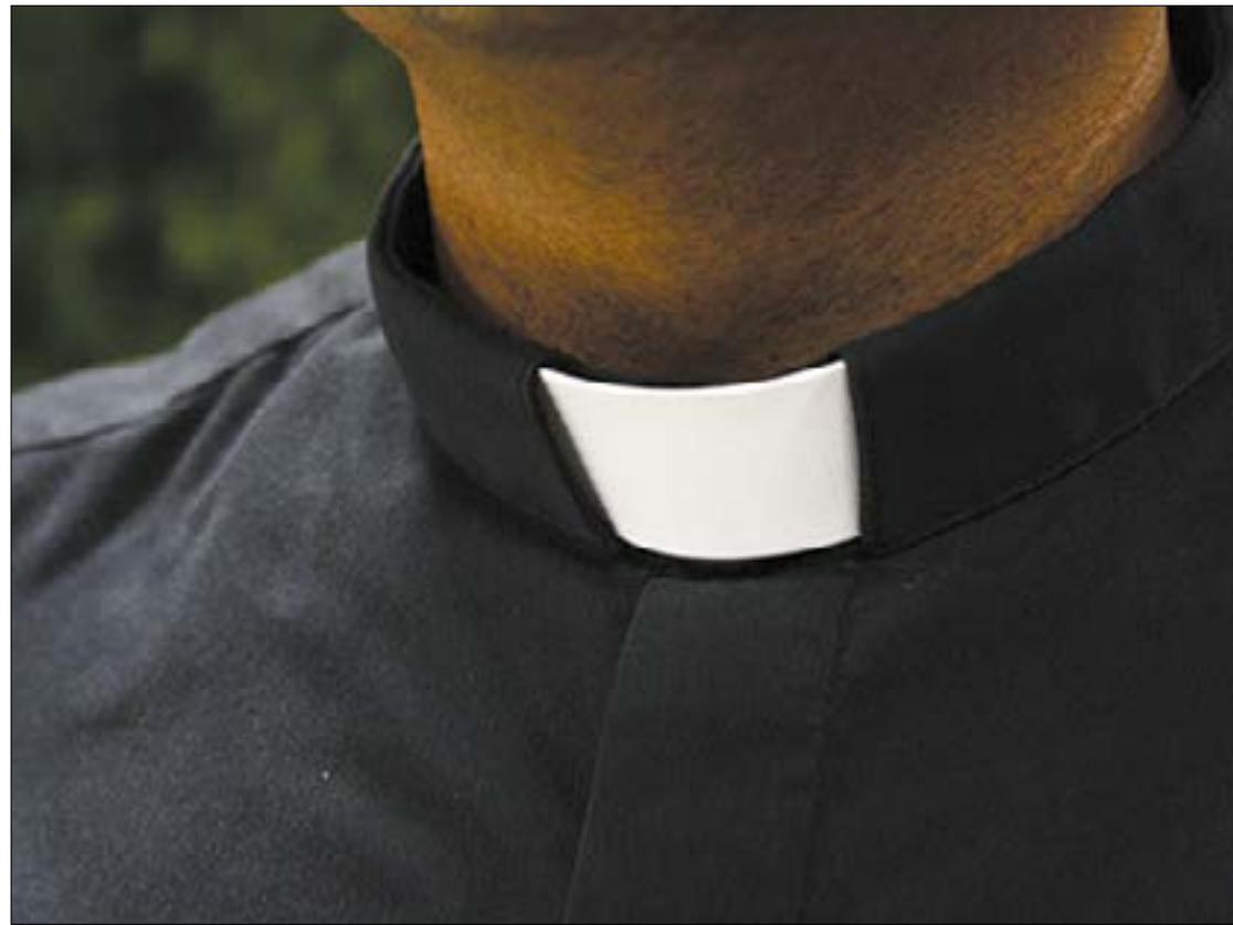
O padre Flávio Tartari foi sequestrado e mantido refém por criminosos. Um dos suspeitos tomou um ‘salve’ e vídeo circula na internet

Informações de algumas pessoas ligadas ao seminário dão conta que o líder religioso chegou a ser espancado e por pouco não se afogou, pois deixaram ele amarrado em uma poça de lama, pois chovia muito na madrugada.