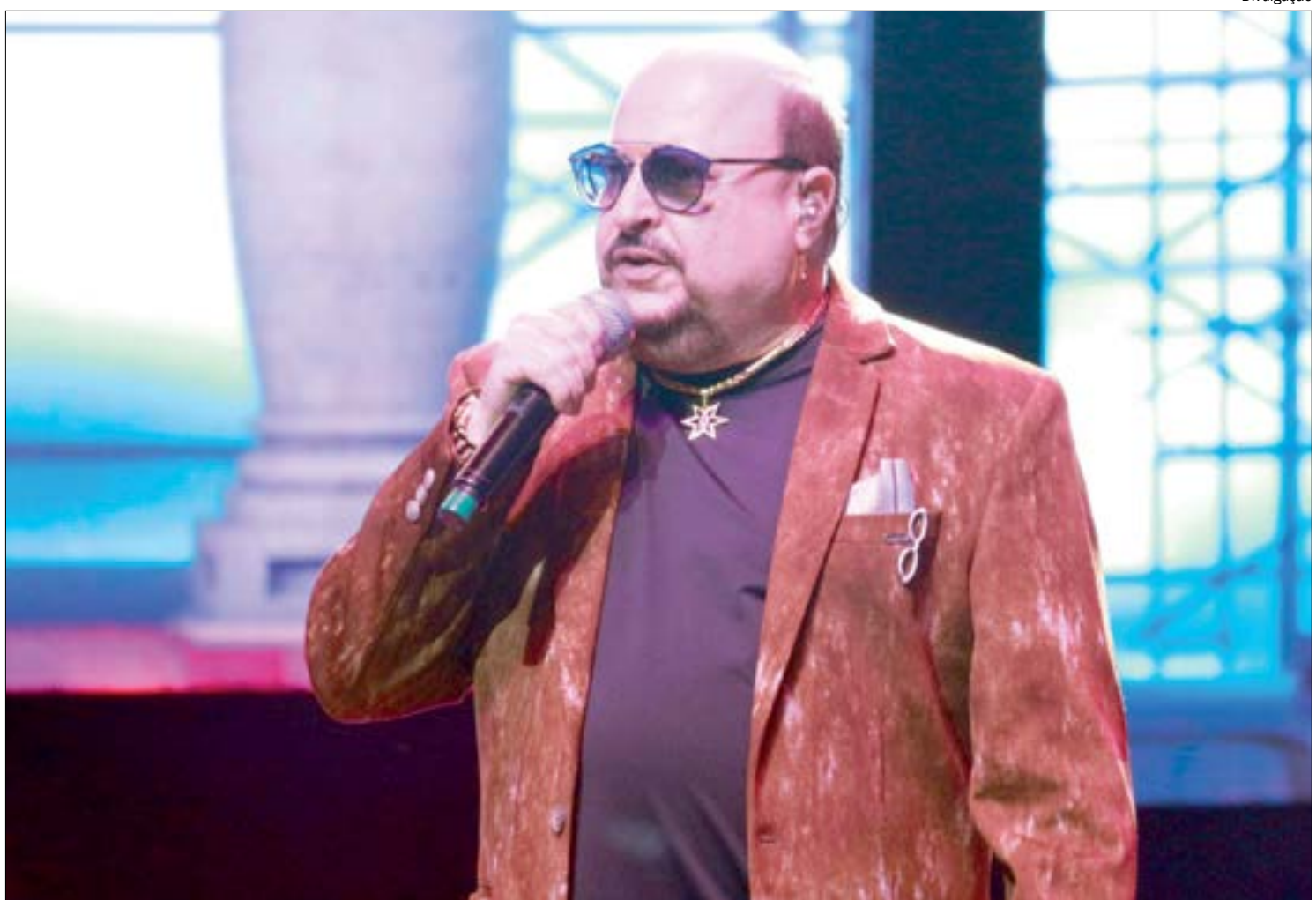
Paulinho, vocalista do Roupas Nova, morre aos 68 anos, vítima de Covid-19

Evaldo Gouveia, cantor e compositor e morreu no dia 29 de maio, aos 91 anos, após contrair o novo coronavírus. Miss Biá, a drag queen foi uma das artistas mais icônicas do universo LGBTQIA+ e uma das pioneiras no Bra-