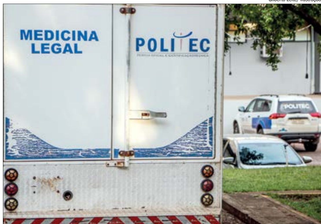
Cícero e Eliane foram baleados em frente à marcenaria da qual eram donos e não resistiram aos ferimentos