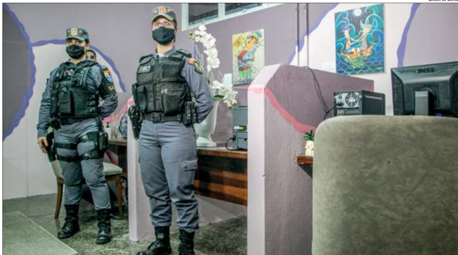
Delegacia da Mulher foi criada exclusivamente para atender vítimas de violência doméstica e sexual

PERFIL DE ATENDIMENTOS - São atendidas na unidade especializada ocorrências envolvendo vítimas de violência doméstica e familiar, conforme especificado na Lei 11.340/2016 (Maria da Penha), além daquelas vítimas de crimes contra a dignidade sexual, de acordo com a Lei 12.015/2009 e as mudanças trazidas pelas leis 3718/2018 e 3772/2018 (importunação sexual e violação da intimidade da mulher). Também são realizadas prisões em flagrante, requerimento de