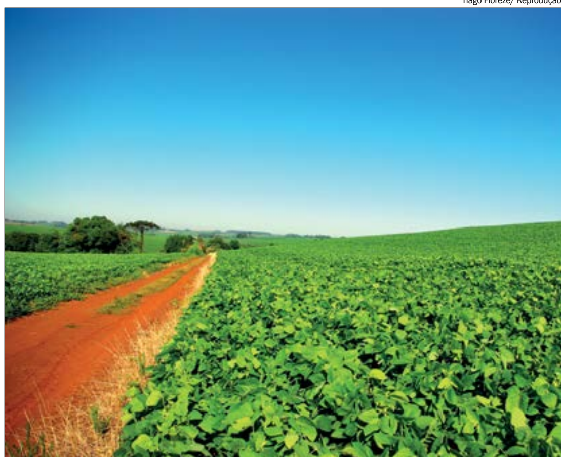
Semeadura da soja 2020/21 foi marcada por atrasos por falta de umidade e perdas para o produtor

Para 2020, aguarda-se uma oferta de 1,85 milhão de toneladas da pluma, sendo um recuou de