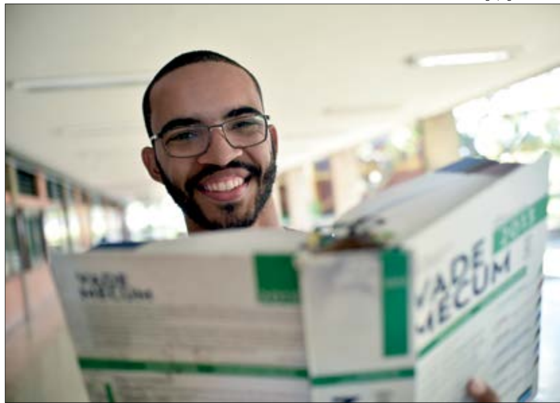
As parcelas começam a ser pagas em janeiro e descontos podem chegar a 100% dos juros de mora