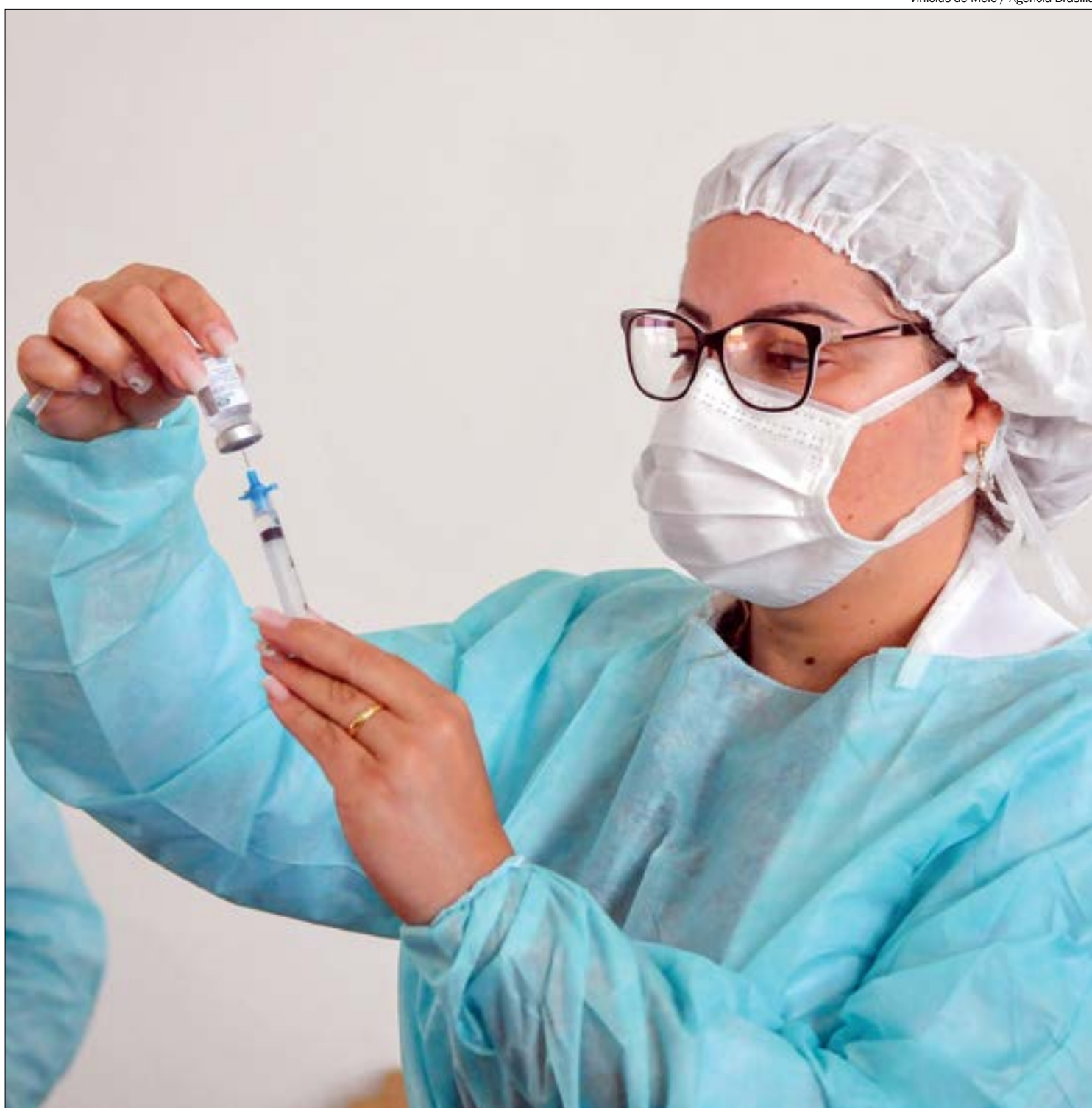
Vinicius de Melo / Agência Brasília