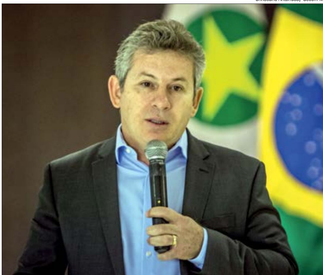
Christiano Antonucci / Secom MT

Segundo o governador, ao longo dos anos são muitos os relatos que demonstram que os peixes estão acabando. “Não há um ser humano que conheça o rio Cuiabá, que conheça o Pantanal ou que conheça outros rios de Mato Grosso que não dê esse testemunho, que ao longo dos anos vem diminuindo. É muito recorrente ver relatos de pessoas que vão pro rio pescar e voltam de lá sem pegar absolutamente nada”.