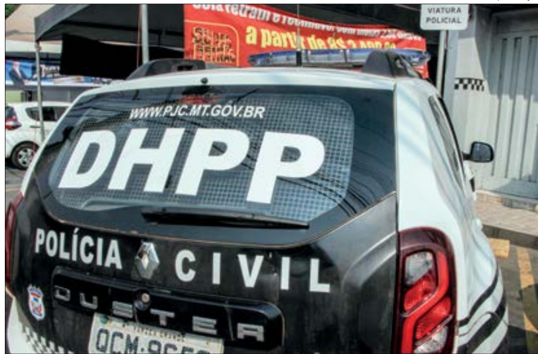
Os três jovens saíram de São Paulo para vender tapetes e alugaram uma casa em Cuiabá, mas foram mortos pelos criminosos