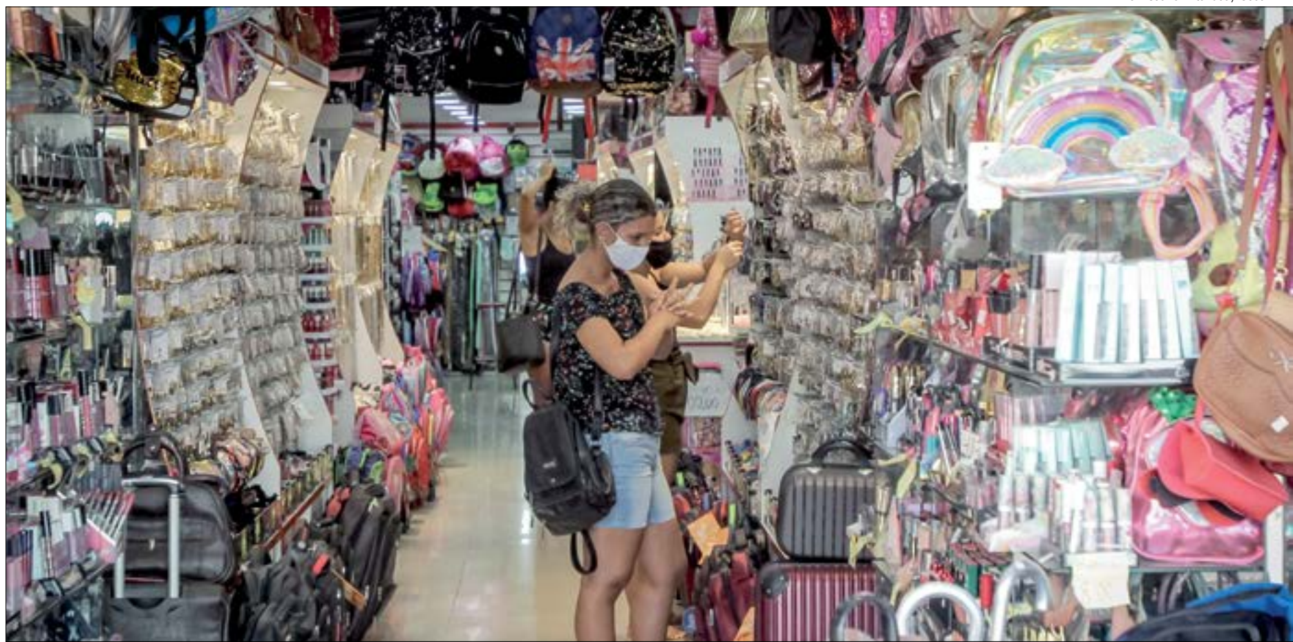
50% dos entrevistados responderam que pretendem fazer compras no Natal em Mato Grosso

“Se temos uma população de 1,8 milhão de pessoas economicamente ativas, em Mato Grosso, supõem-se que 950 mil irão às compras. A pesquisa também aponta o quanto elas irão gastar, o que nos faz chegar a uma conclusão de que esses consumidores devem colocar em circulação quase R$ 1,2 bilhão, apenas em Mato Grosso”, explica o