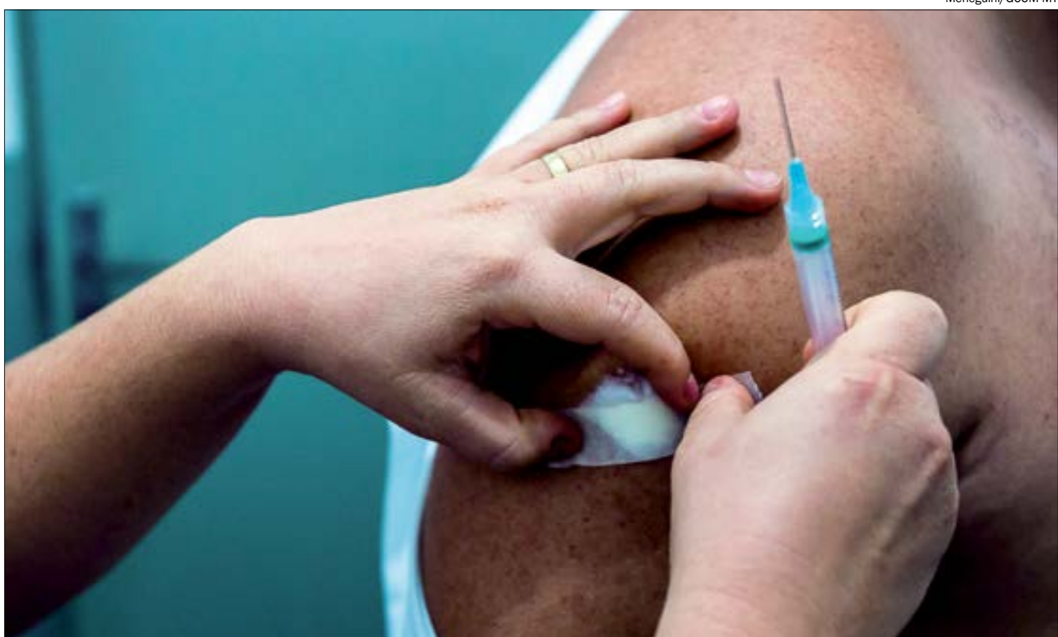
Vacina é esperança da população brasileira, que já perdeu 179.801 pessoas para a covid-19

ESTADO DE MATO GROSSO - As doses da vacina chinesa também são sondadas pelo Estado de Mato Grosso. Nessa sexta-feira