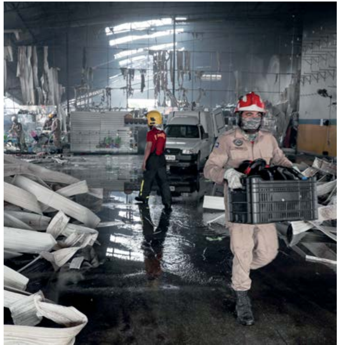
A perícia irá determinar se as causas do incêndio foram de natureza acidental ou criminosa

“O trabalho das equipes se estendeu por toda a madrugada, e apesar do grande número de materiais combustíveis e inflamáveis que havia dentro da edificação sinistrada, o Corpo de Bombeiros evitou que o incêndio passasse para o restaurante Café do Porto, para a Clínica Veterinária São Lázaro e para o setor comercial da Ciclo Ribeiro”, aponta o Corpo de Bombeiros.