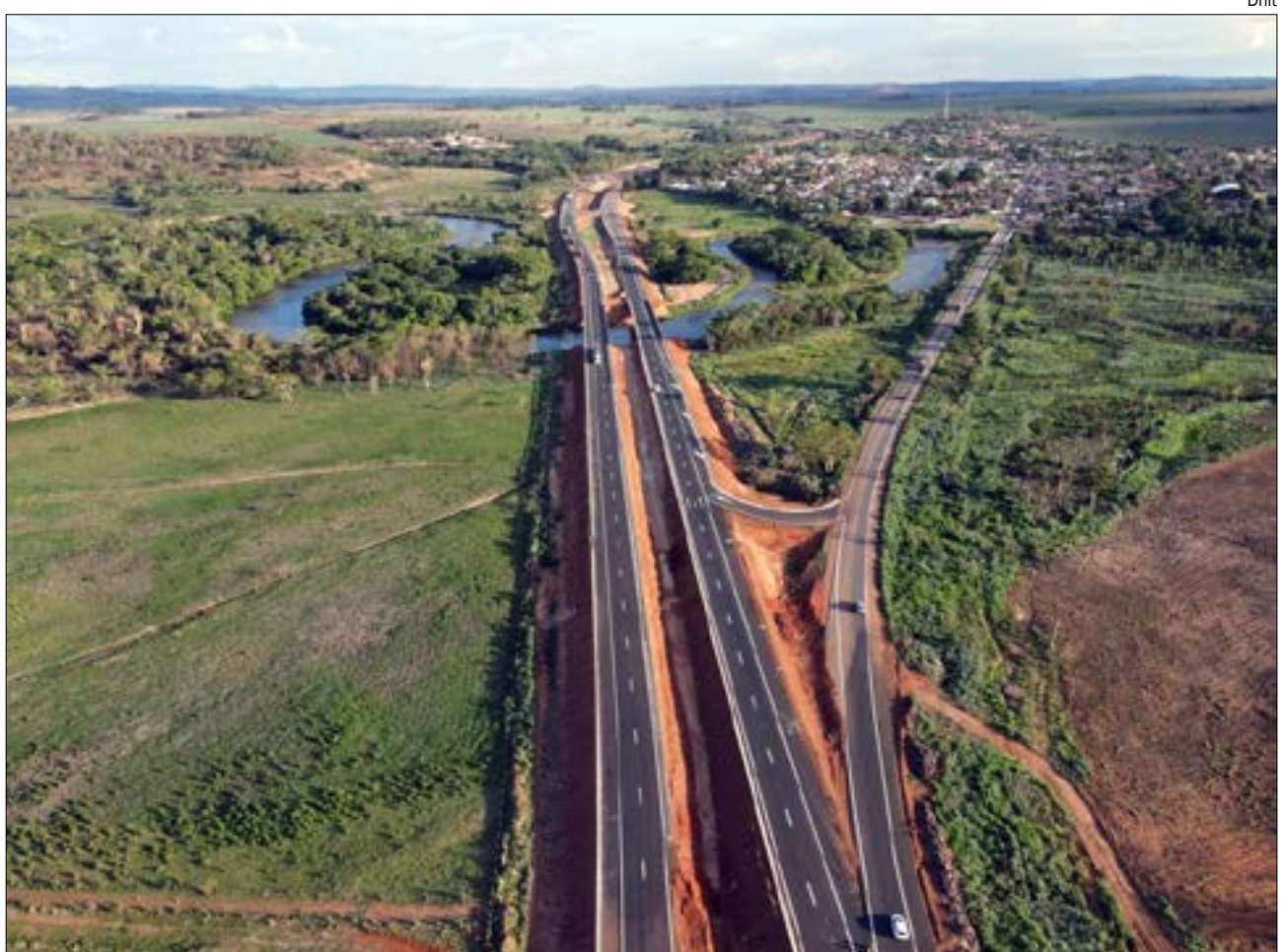
Os contornos de São Pedro da Cipa e de Juscimeira fazem parte do lote 1 da obra de duplicação da BR-163/364/MT

Os contornos de São Pedro da Cipa e de Juscimeira fazem parte do lote 1 da obra de duplicação da BR-163/364/MT. As obras estão divididas em três lotes, que totalizam uma extensão de 174 quilômetros, entre Cuiabá e Rondonópolis, e contam com obras de duplicação e de restauração da rodovia BR-163/364/MT.