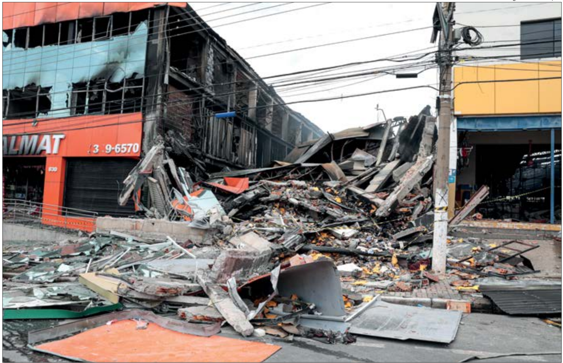
Ao todo, três estabelecimentos foram atingidos pelo fogo. Trabalho, intenso, durou 12 horas

“Eu estou vivendo um dia de cada vez. Hoje (7) estamos começando a pensar em como vai ser, falando com advogados para dar um suporte de como se vive esse momento que não temos nem noção. Eu ainda não consigo falar, mas agradeço a solidariedade de todos e acredito que Deus sabe de todas as coisas e tenho certeza