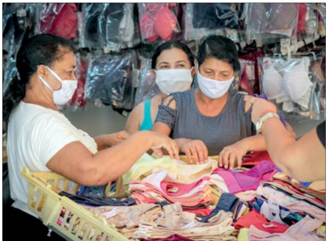
A expectativa de crescimento de vendas é em média 5,2%

PRÊMIOS - A premiação é bem atrativa, tais como vales-compras de R$ 1.000,00 cada que poderão ser utilizados somente nas lojas participantes, motos OKM, caminhão recheado de prêmios como eletrodomésticos e utensílios para casa (caminhão não faz parte da premiação) e um carro OKM.