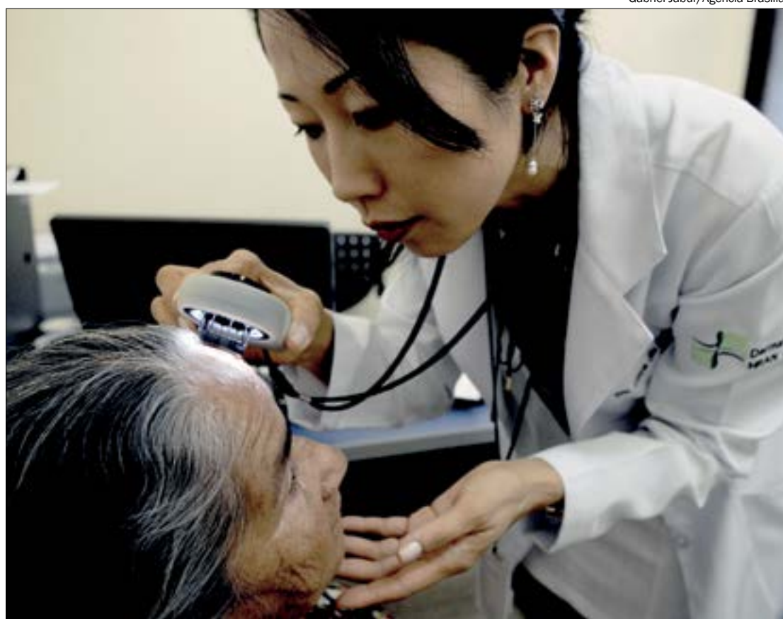
Gabriel Jabur/Agência Brasília