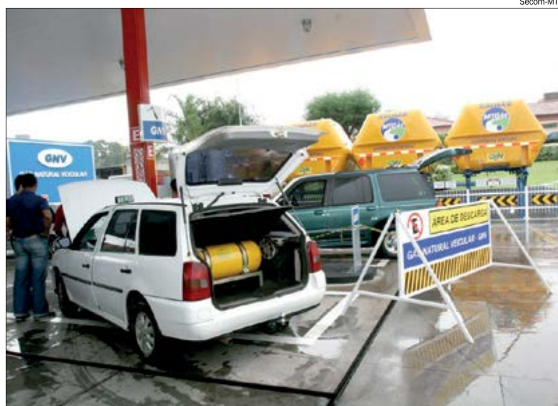
Curso gratuito faz parte do programa de incentivo ao uso de gás natural

Os benefícios sociais são pagos por meio da poupança social digital e a movimentação dos recursos é feita pelo aplicativo Caixa Tem. São 35 milhões de beneficiários que usam o aplicativo.