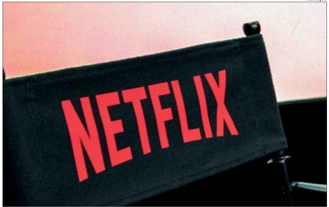
Na lista divulgada pela Netflix, você vai encontrar conteúdo original de filmes e séries e também conteúdo de terceiros

Destaques para as séries documentais brasileiras Emicida: AmarElo – É Tudo Pra Ontem e Anitta: Made in Honório. Além da quarta temporada de O Mundo Sombrio de Sabrina e para os filmes Tudo Bem No Natal Que Vem, com Leandro Hassum e A Festa de Formatura, estrelado por Nicole Kidman, Meryl Streep e Kerry Washington.