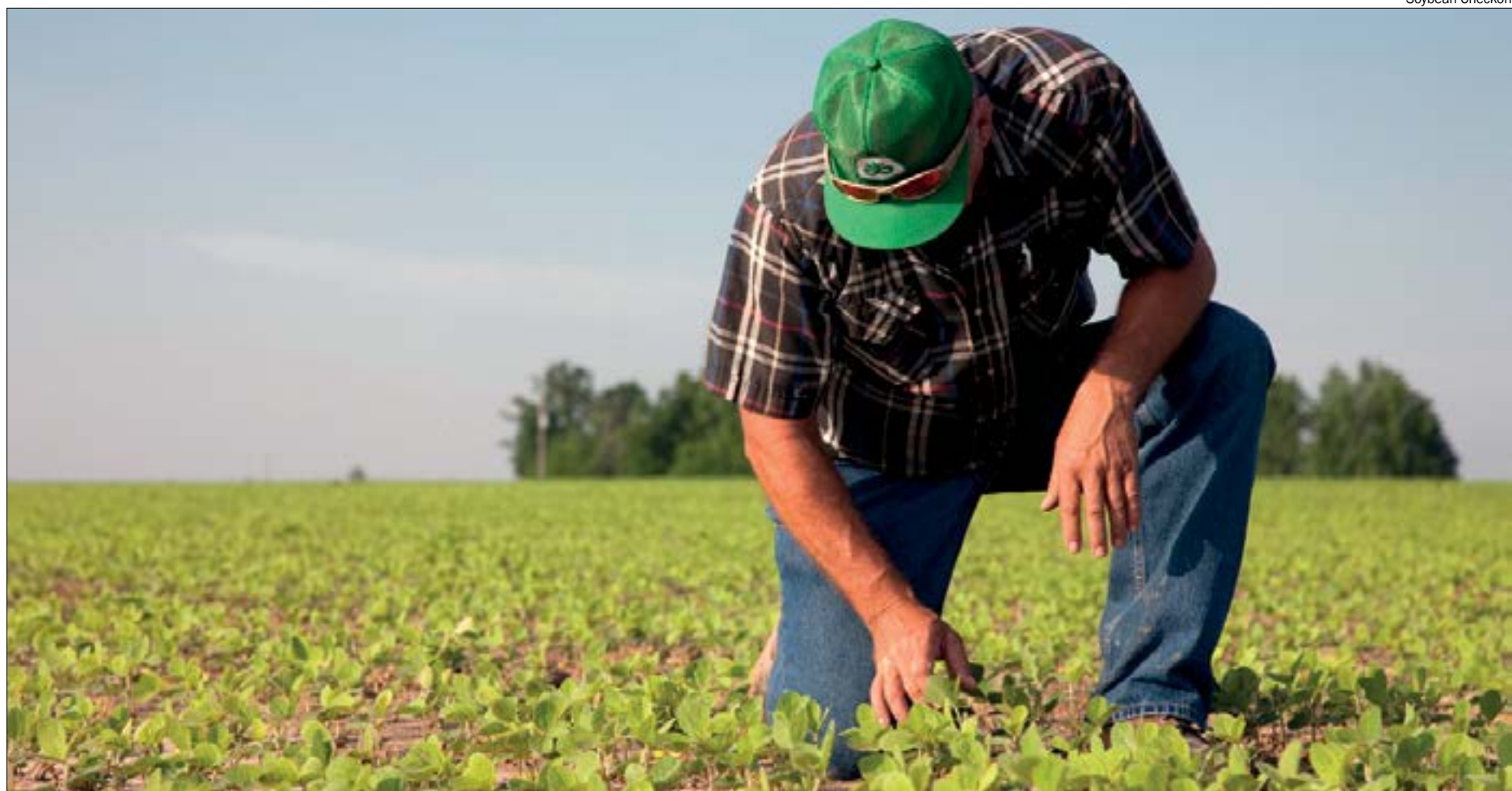
Devido à estiagem, muitos agricultores tiveram que fazer o replantio das áreas e devem ter seus resultados afetados

Ao atingir 98,47% de semeadura no dia 20 de novembro – dos 10,30 milhões de hectares previstos para a safra 2020/21 – o esforço extra dos sojicultores fez com o resultado para o período ficasse acima do ano passado e da média dos últimos cinco anos (95,85%). Conforme o Imea, a aceleração da semeadura foi possível graças aos maiores volumes