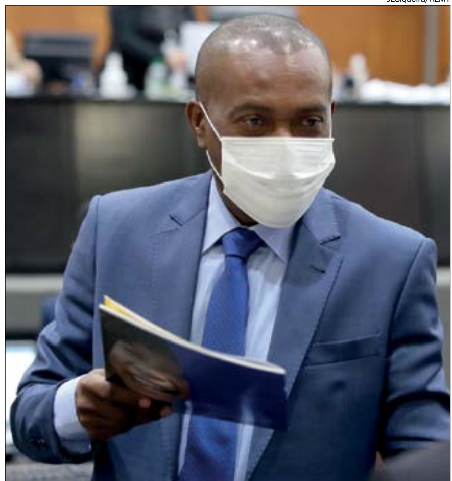
Lopes lembra que é o terceiro deputado negro em mais de 20 anos de Legislativo Estadual