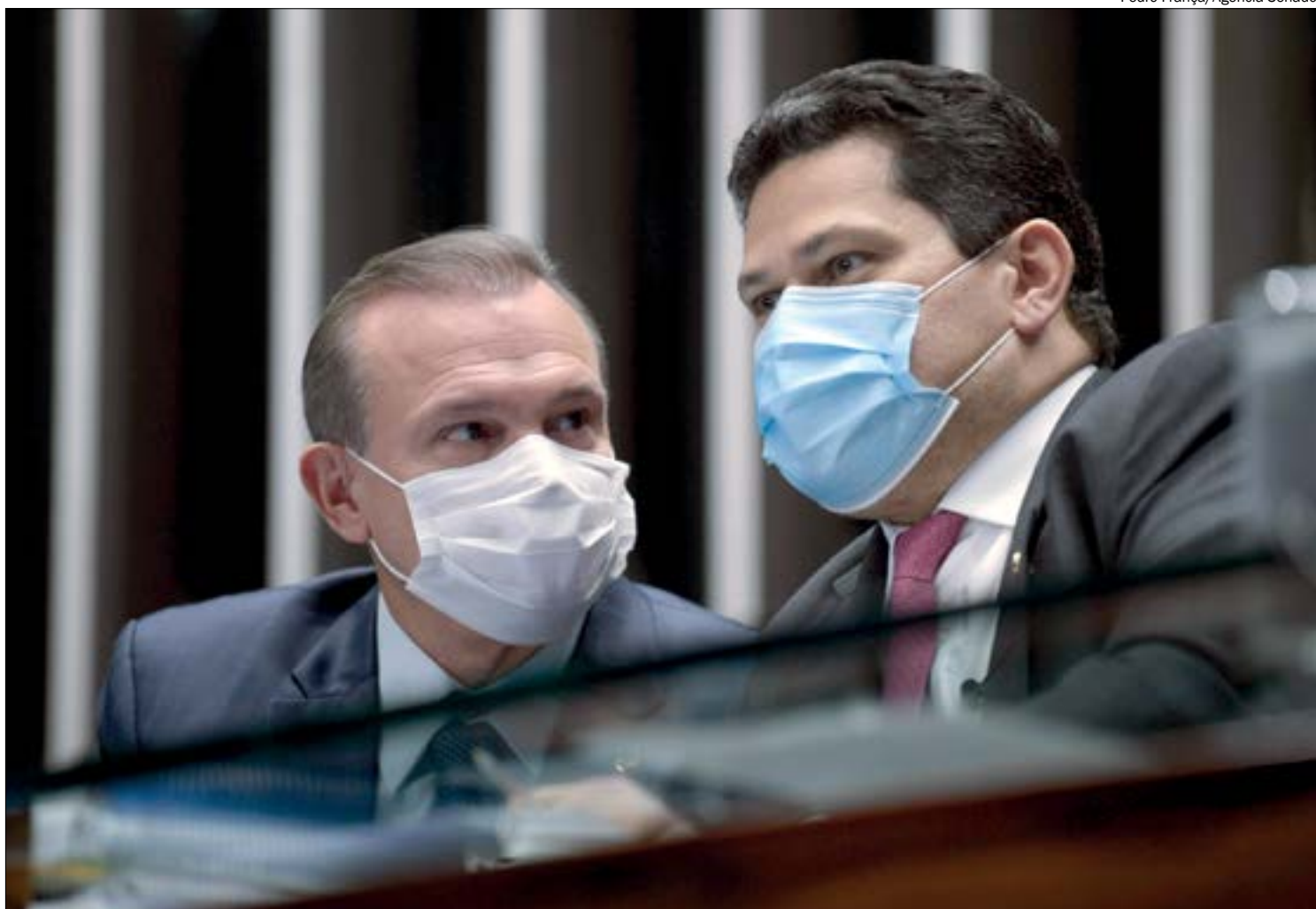
Projeto de Fagundes para pagamento de compensações da Lei Kandir foi aprovado por unanimidade no Senado

O atraso nos repasses acordados e a falta de critérios deu origem a um conglomerado de ações judiciais contra a União. Após vários anos, o Supremo Tribunal Federal (STF) conseguiu conciliar os interesses entre Estados e União e um acordo foi feito, dando origem ao projeto de lei aprovado pelo Senado.