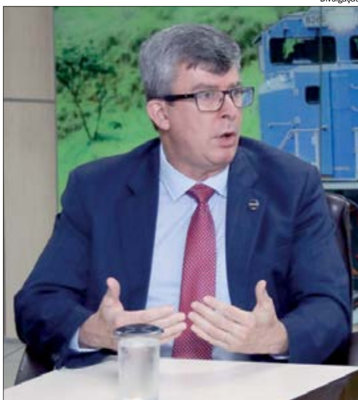
Presidente da Valec promete conclusão da Fico em cinco anos

"Quando começaram a montar os canteiros de obra, não houve uma preocupação com os impactos na saúde, na educação e, sobretudo, na segurança. Tivemos casos de cidades