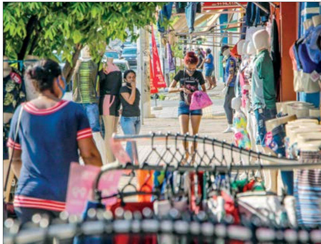
Promoções da Black Friday prometem movimentar o comércio e Procon-MT dá dicas