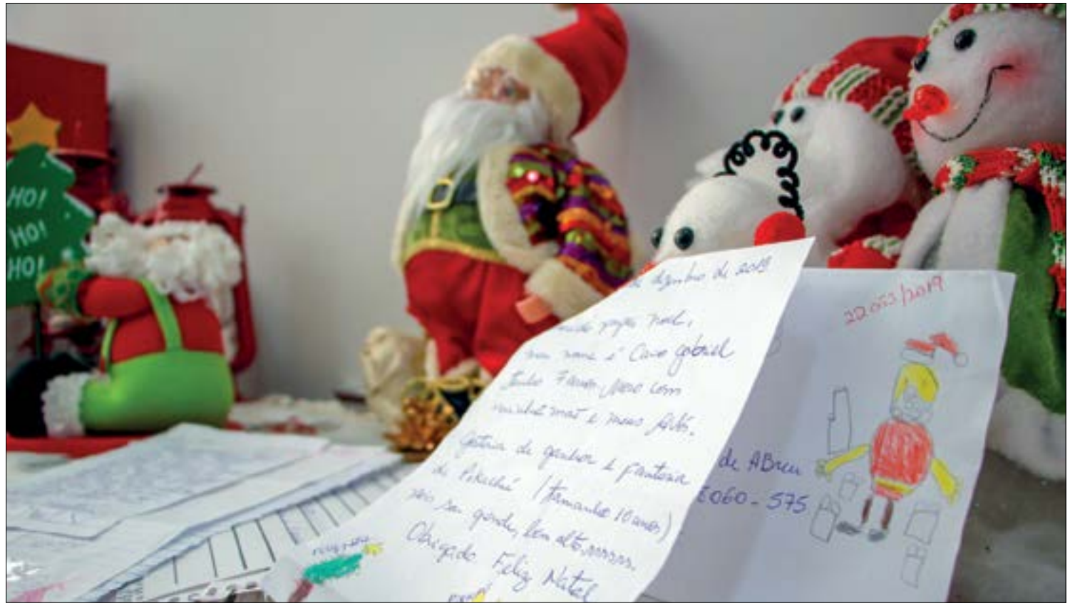
Os padrinhos receberão no e-mail cadastrado a confirmação da adoção e a entrega do presente deve ser feita presencialmente nos Correios

Os padrinhos receberão no e-mail cadastrado a confirmação da adoção. Para visualizar as cartinhas adotadas, basta acessar a página de adoção online pelo Blog e clicar na seção "Minhas Cartas".