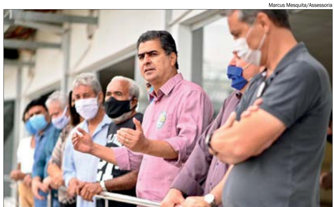
Fórum Sindical exalta Emanuel por respeitar os direitos dos servidores públicos