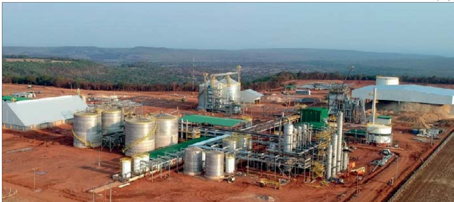
Em 2021, primeiro ano de atividade, a projeção é absorver 262,5 mil toneladas de milho

As instalações têm capacidade de produção de 112 milhões de litros de etanol por ano. Além do biocombustível, a planta também pode transformar 80 mil toneladas de