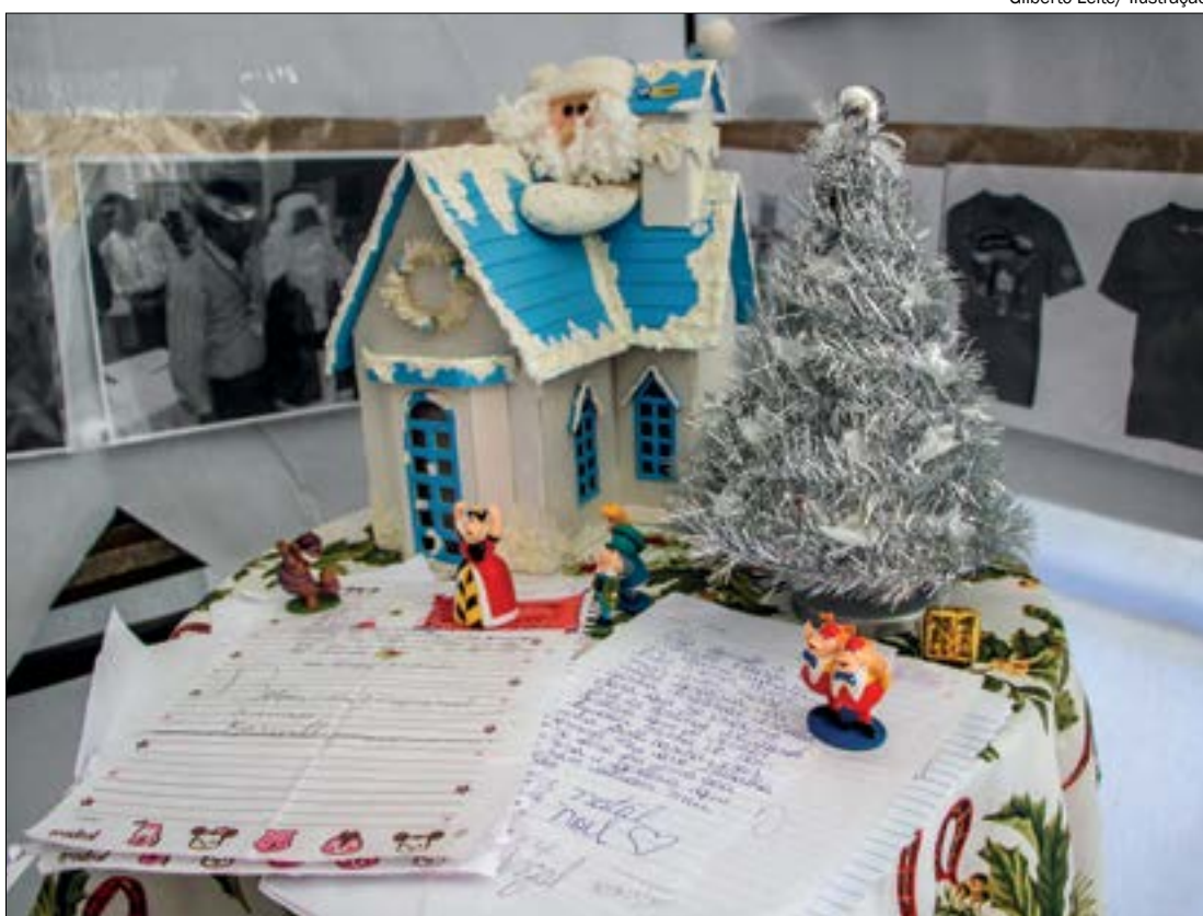
Gilberto Leite / Ilustração

Com a chegada do Natal, tem início a campanha de solidariedade mais querida do Brasil: O Papai Noel dos Correios. Mas, em função da pandemia, este ano a estatal promoveu adaptações para assegurar a realização, com segurança, mantendo a tradição. Agora o recebimento das cartinhas ocorrerá de forma virtual, assim como a adoção delas, por meio do Blog do Papai Noel dos Correios