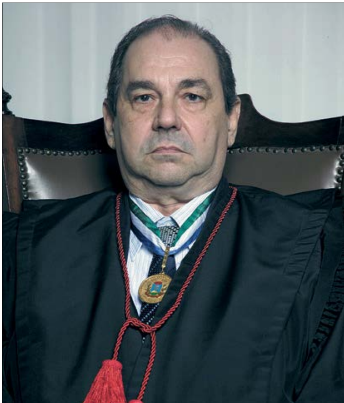
Desembargador Ernani Vieira de Souza

Após ter realizado tantas conquistas, o caminho comum seria a aposentaria. Em tal ponto da vida, muitos pensariam em 'pendurar as chuteiras' para apenas curtir o retorno de tantos anos de tra-