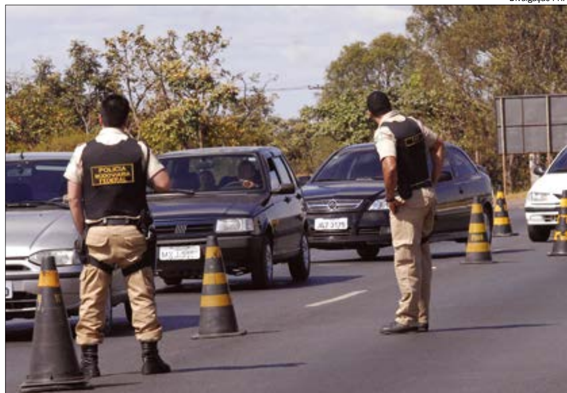
Os Estados que contabilizaram a maior quantidade de óbitos foram Santa Catarina (13), Minas Gerais (12), Paraná (11) e Bahia (11)