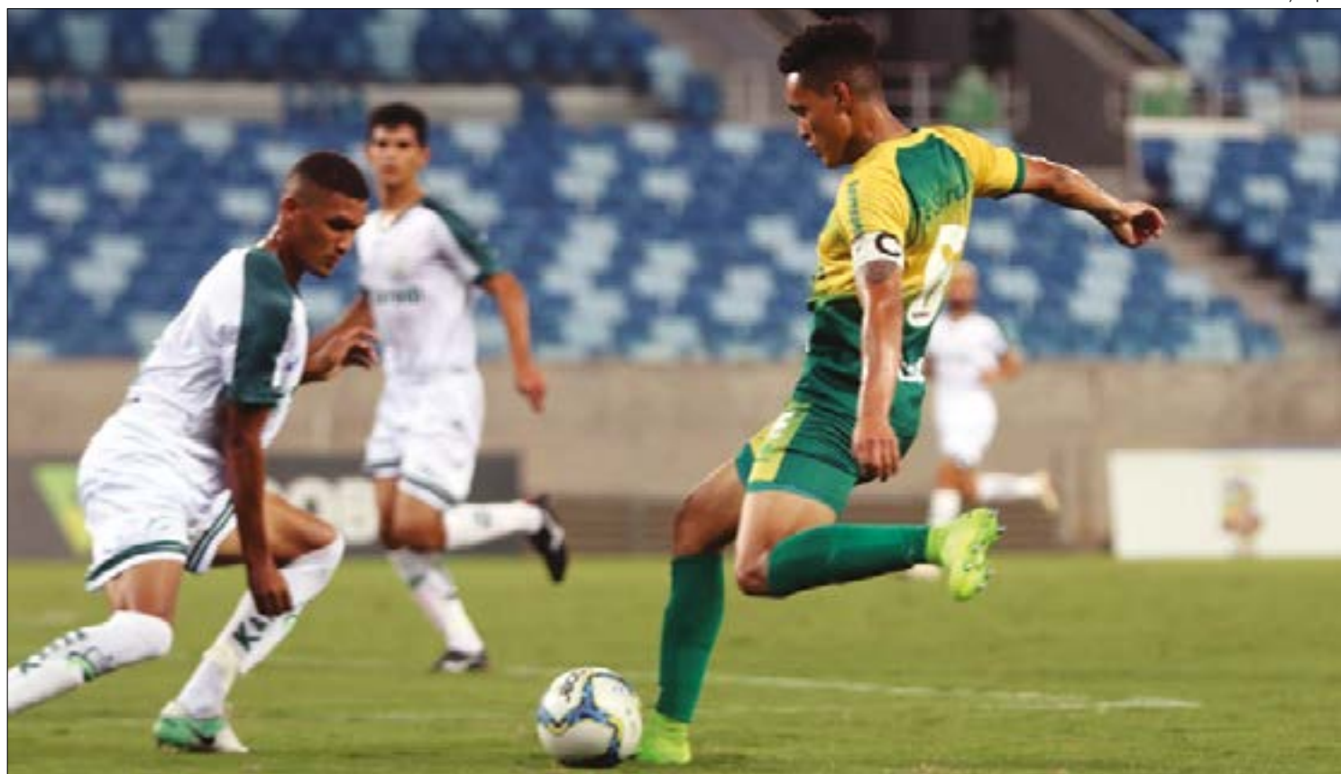
Luverdense precisa da vitória a qualquer preço no clássico contra o Sinop

Só que a disputa para ver quem será o segundo a cair está acirrada: apenas quatro pontos separam o Mixto, 9º colocado, do Nova Mutum, em