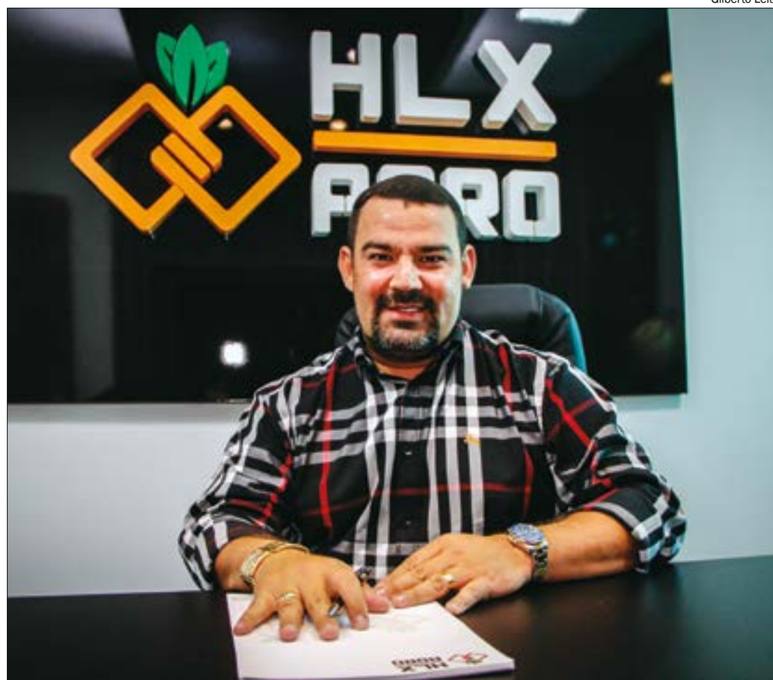
Negócio de Lázaro vai além de negociar propriedades e oferece consultoria completa para gestão de fazendas

*Estagiário sob supervisão de Felipe Leonel