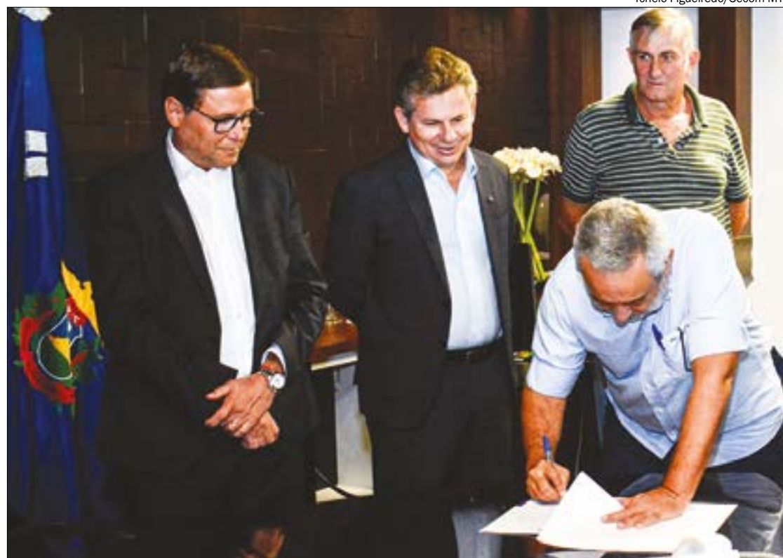
Governador assina acordo para pavimentação de estradas estaduais com recursos do Fethab

A arrecadação de Mato Grosso com o Fethab em 2019 ultrapassou R$ 1,5 bilhão. Em 2020, a previsão é que atinja até R$ 2 bilhões.