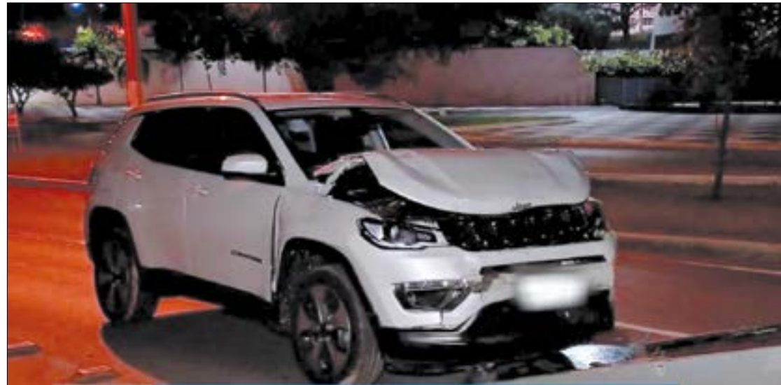
A condutora negou que estivesse errada ou sob efeito de álcool, pagou multa e foi solta