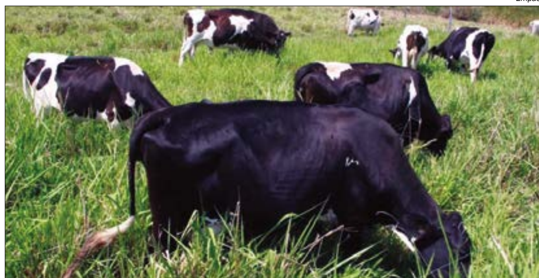
Redução de juros visa fomentar agricultura familiar em Mato Grosso

ATENDIMENTO EM CUIABÁ – Para conhecer mais sobre a linha de crédito Agro oferecida pela Desenvolve MT, o atendimento presencial é realizado de segunda a sexta-feira, das 10h às 16h, no Edifício Top Tower, Av. Historiador Rubens de