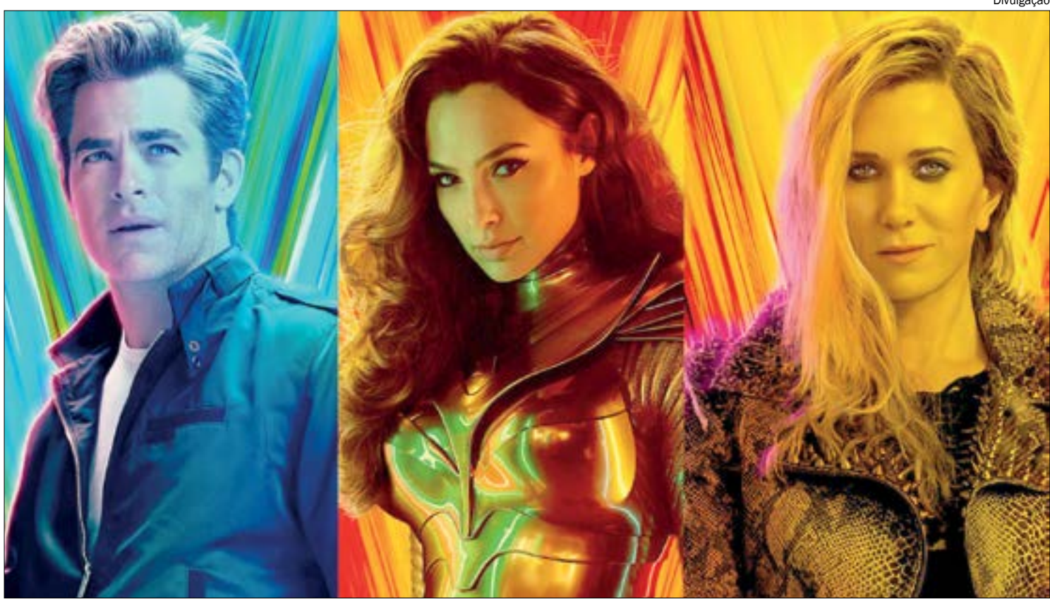
'Mulher-Maravilha 1984' entrou em um período decisivo para a definição da data de estreia

No novo longa, Diana Prince está em uma década totalmente nova, onde ela está vivendo tranquilamente em Washington, entrando em ação frequentemente para proteger as pessoas que precisam dela - principalmente quando novas ameaças na forma