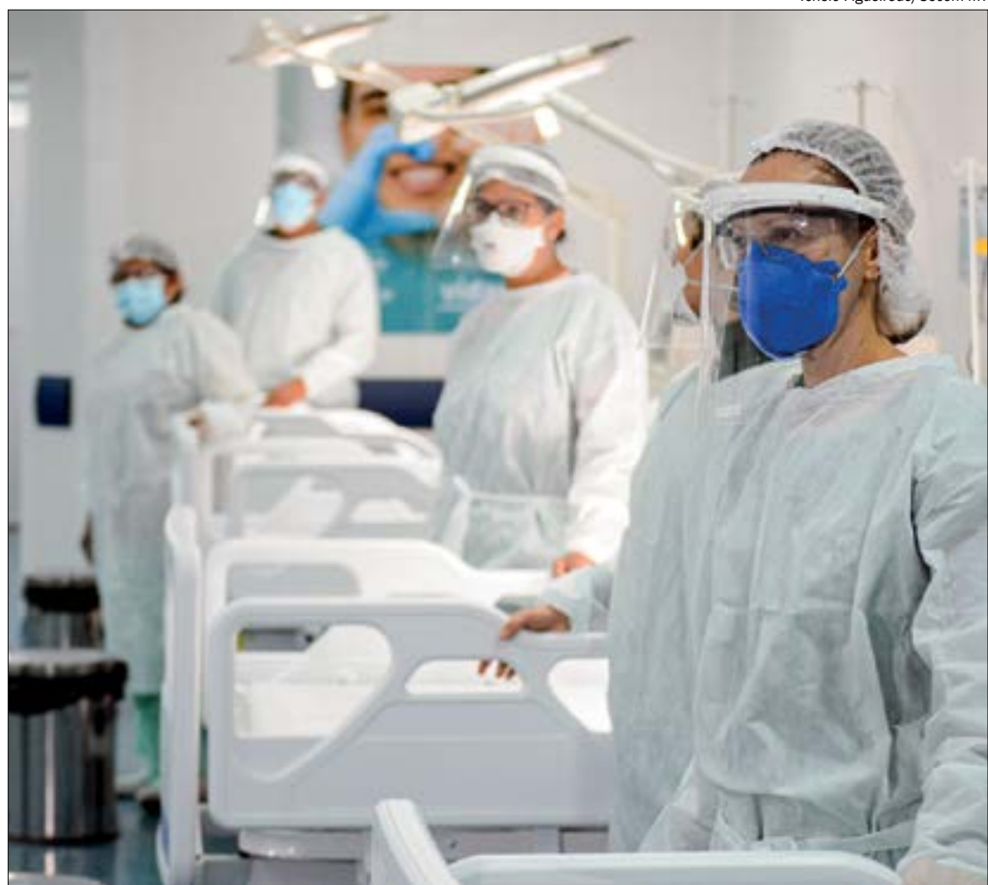
Além de aumentar gastos com Saúde, pandemia cria pressão sobre a economia e impacta a arrecadação dos municípios

"O prefeito é responsável pela cidade e precisa cobrar uma posição do governo ou estudar com a bancada federal para ver se consegue uma parceria público-privada, alguma coisa nesse sentido. É preciso dar uma solução para o VLT e tem que partir do