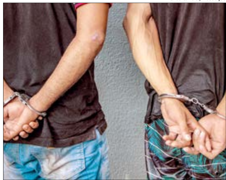
Os suspeitos foram presos e seguem à disposição da polícia. A vítima foi socorrida escondida em um matagal