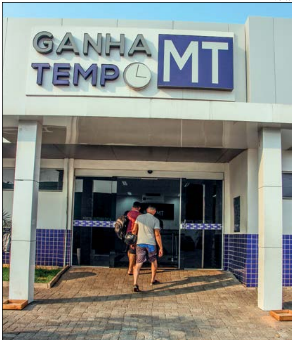
Concessionária é investigada por suspeita de fraudar atendimentos, com prejuízo de cerca de R$ 6 milhões ao Estado

O conselheiro interino também destacou uma auditoria feita pela Controladoria Geral do Estado (CGE), que detectou o registro de diversos atendimentos fictícios, o que resultou na operação Tempo é Dinheiro. O relatório da CGE aponta que, excluindo os atendimentos irregulares, o governo arcou com o valor por atendimento de R$