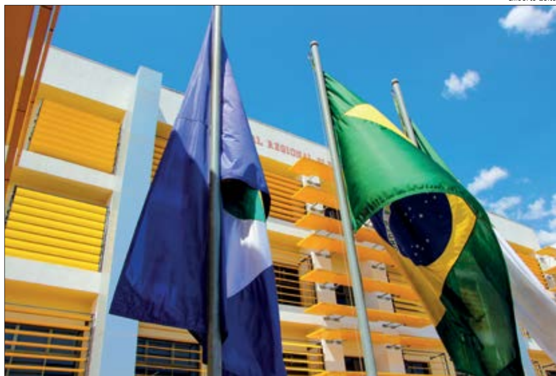
Apenas juizes, servidores e fiscais poderão acompanhar a apuração no TRE

"Houve muita falha no sistema, o que é de se lamentar porque muitos que precisavam ficaram sem receber nada", lamentou.