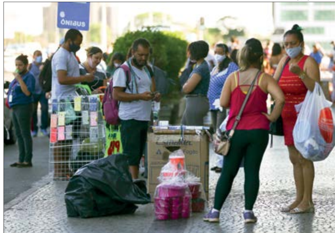
Alimentação em casa é o principal fator que gera pressão sobre a inflação