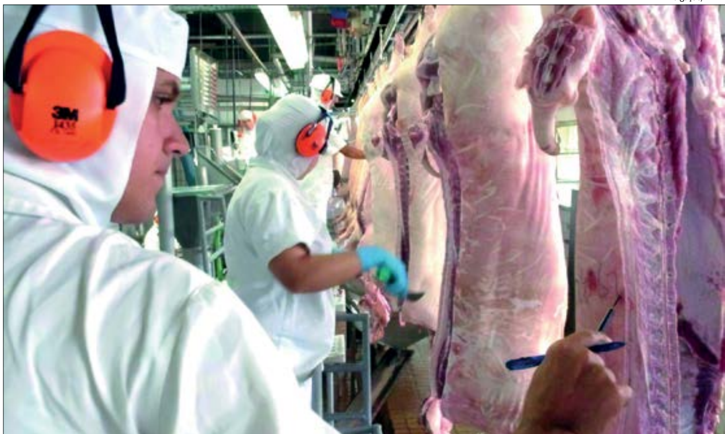
Em nove meses, exportação de suínos superou o resultado do ano inteiro de 2019

De acordo com o Imea, no segundo semestre des-