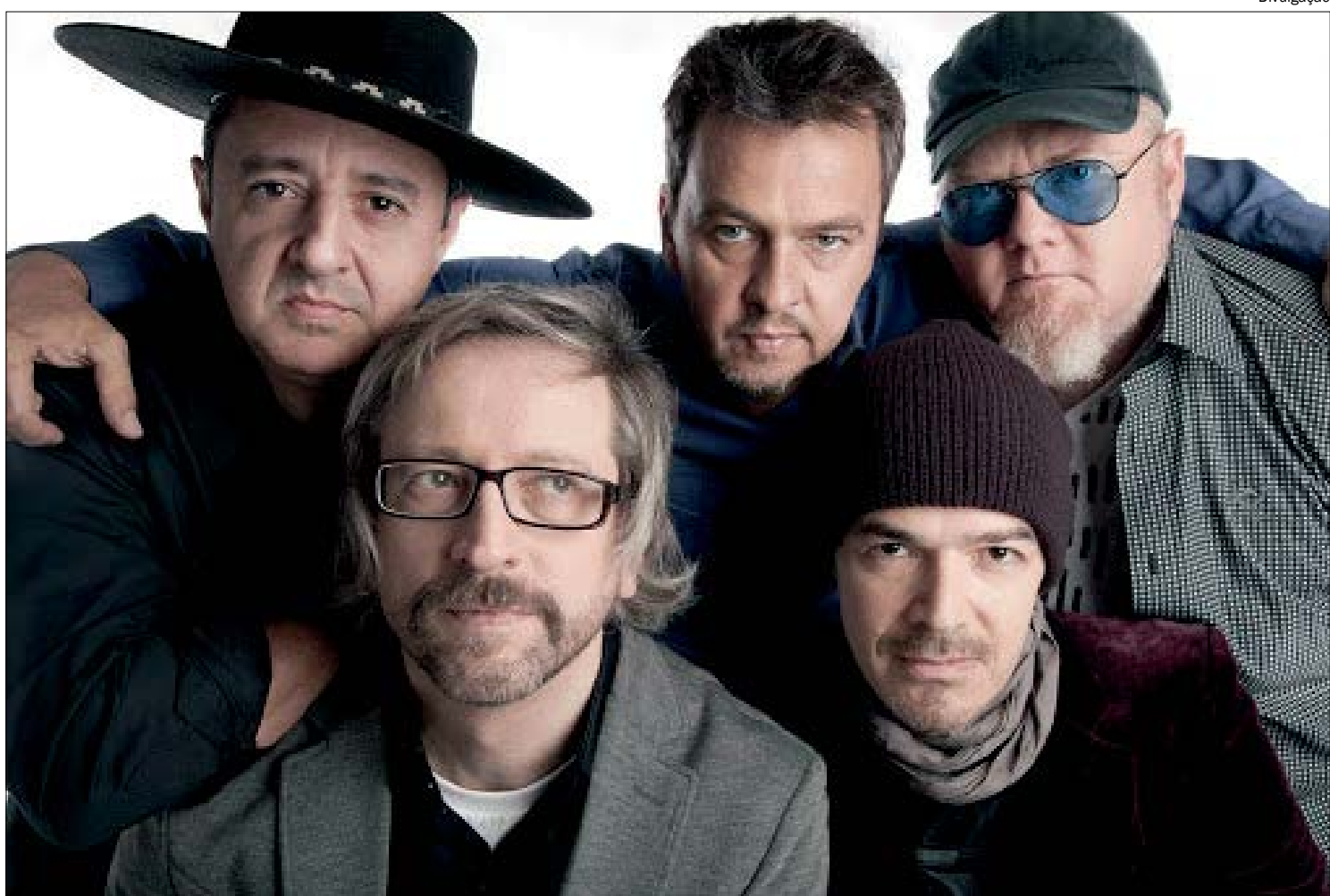
Nenhum de Nós lança novo EP "Feito em Casa" produzido durante a quarentena

BREVE HISTÓRICO - Em 1987 o disco de estreia trouxe o primeiro sucesso: “Camila Camila”. Um ano depois o Nenhum emplacou outro hit, “Astronauta de Mármore”. A versão para Starman, de David Bowie é faixa do segundo disco (Cardume). Em 1990 e 1992 dois álbuns viriam