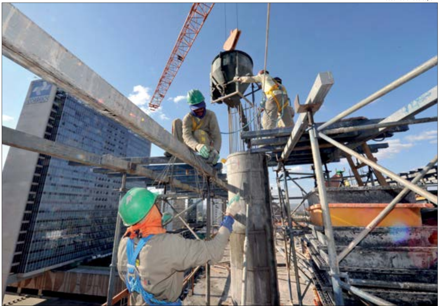
Indústria da construção foi a que mais se destacou na recuperação pós-pandemia

Renato aponta que apesar de a indústria ter se