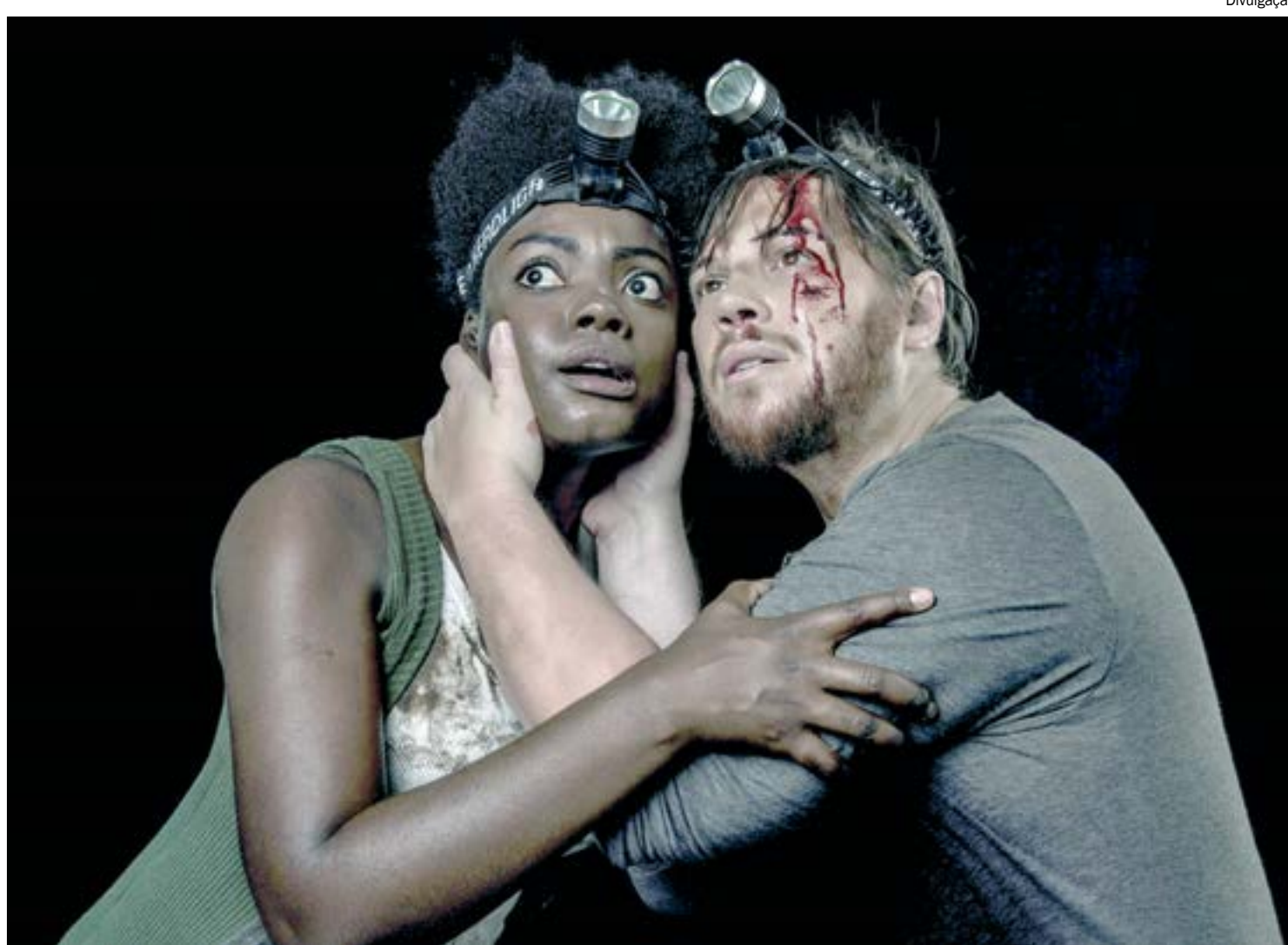
O filme de terror A Gruta já está disponível na plataforma para os assinantes