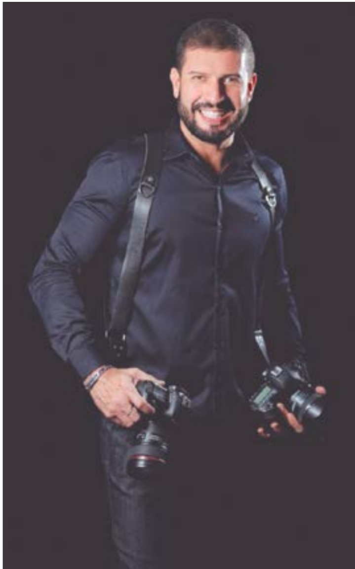
No estilo black total, o macho alfa (adoro essas news), Sérgio Soares, o fotógrafo dos melhores eventos em Mato Grosso