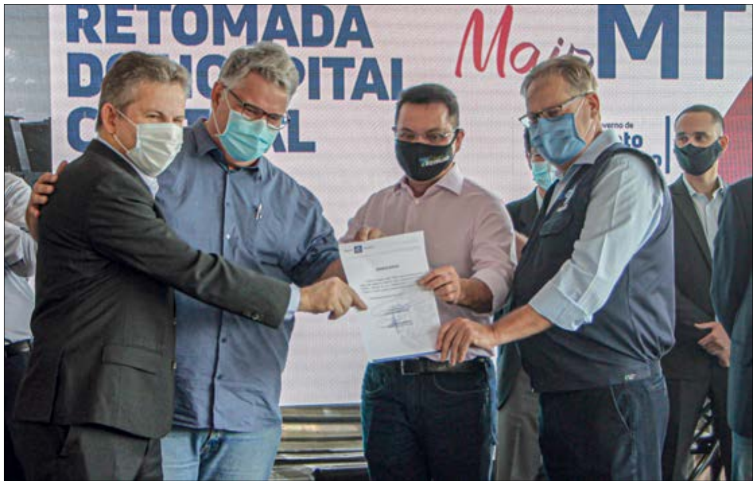
Mauro afirmou que abandono da obra "é o maior símbolo da incompetência" dos governadores que o antecederam

A OBRA - O consórcio LC Cuiabá será responsável pela retomada da construção do Hospital Central. O valor do projeto é de R$ 92,9 milhões que, segundo o governador, será inteiramente bancado com recursos do governo estadual.