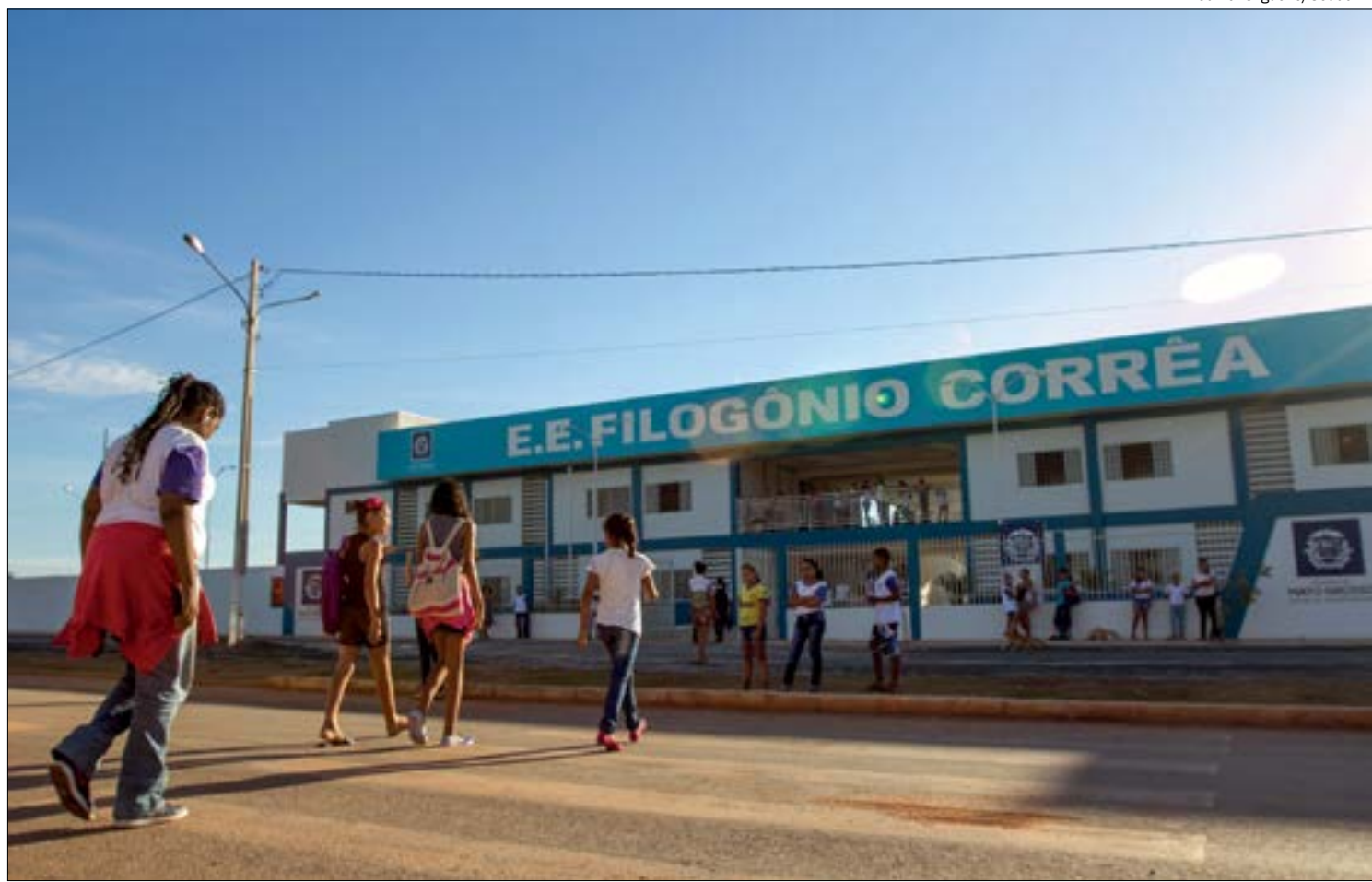
Novos professores somarão esforços nas atividades educacionais de 2021

Os professores empossados substituirão os com contratos temporários que atuam na rede estadual de ensino. No total, a Seduc possui em torno de 37 mil servidores e destina cerca de 88% do orçamento para a folha de pagamento.