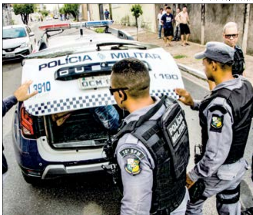
Alguns dos criminosos já possuem antecedentes criminais e ficam agora à disposição da justiça

Na casa estavam duas mulheres e um homem, que autoriza-