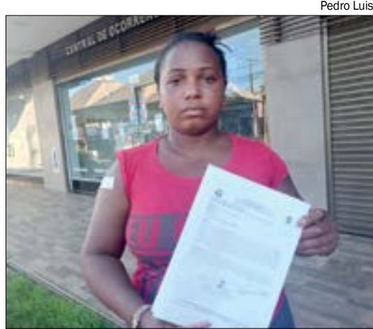
Candidata colava adesivo em seu carro quando um homem tentou esfaqueá-la

A vítima procurou uma Unidade de Pronto Atendimento (UPA) do bairro Ipa-se, onde foi atendida e fez um curativo no local do corte.