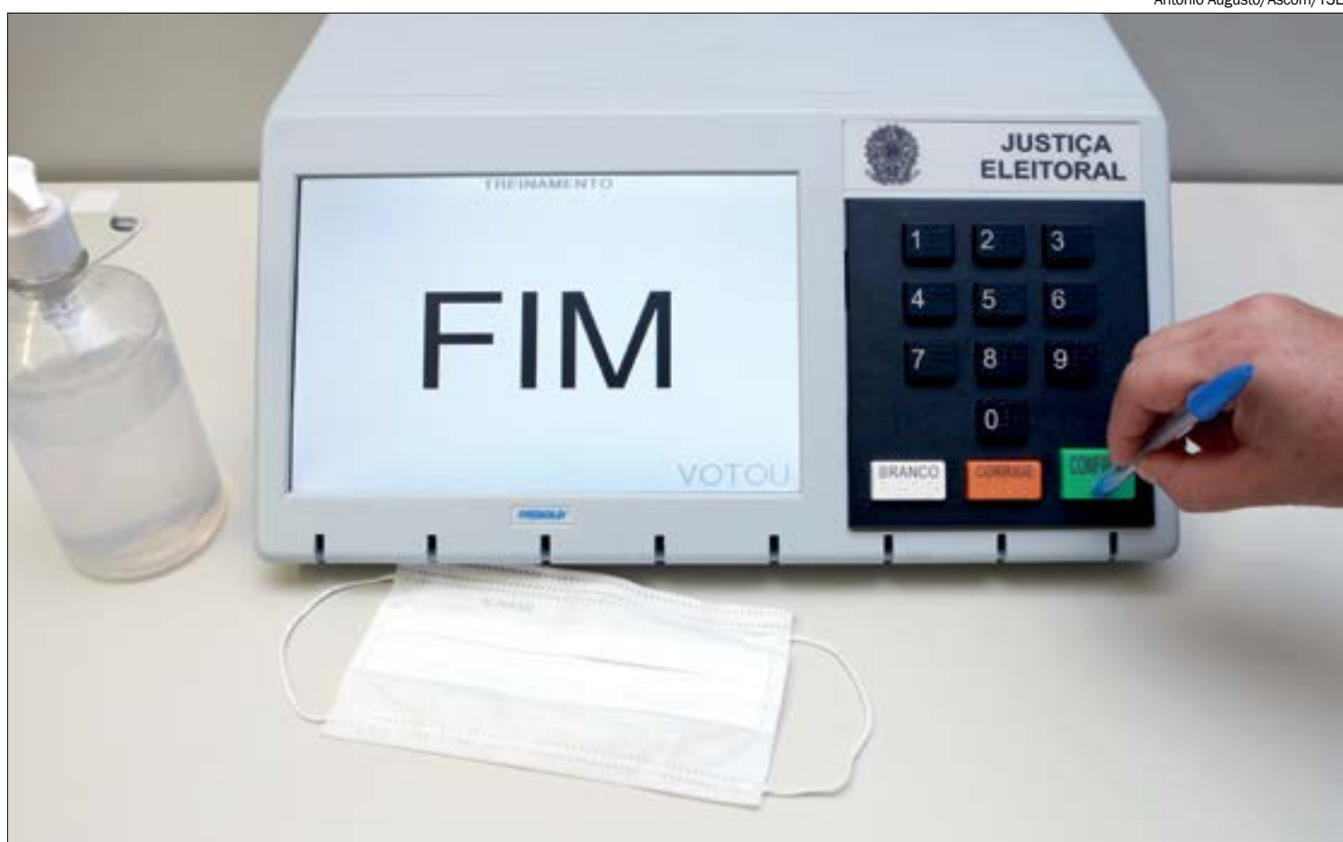
No caso específico da covid-19, a Justiça Eleitoral orienta que o eleitor fique em casa

CANETA - Além da máscara, é recomendado ao eleitor levar sua pró-