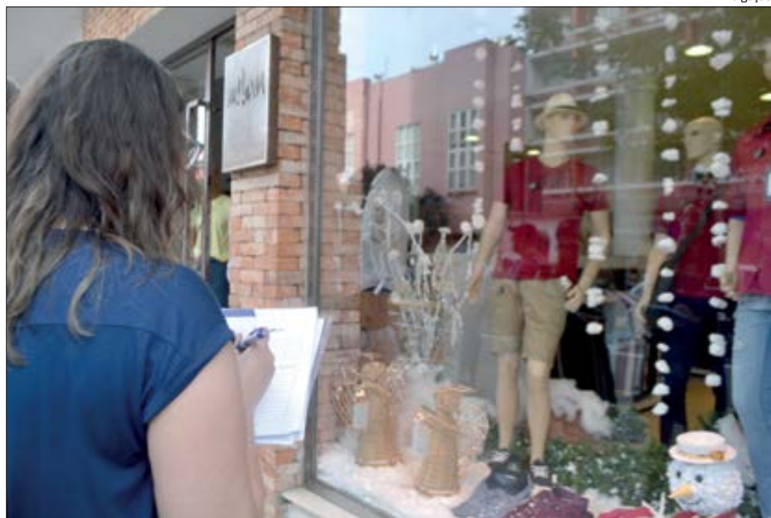
Lojistas já começam a trabalhar o tema natalino e têm expectativa de aumentar vendas em 5%

A pesquisa da CDL Cuiabá foi feita na modalidade entrevista com empresários de loja de rua e shoppings. Dentre os participantes ela abrange 33,3% do comércio de bairros; 33,3% do centro e 33,3% dos shopping centers.