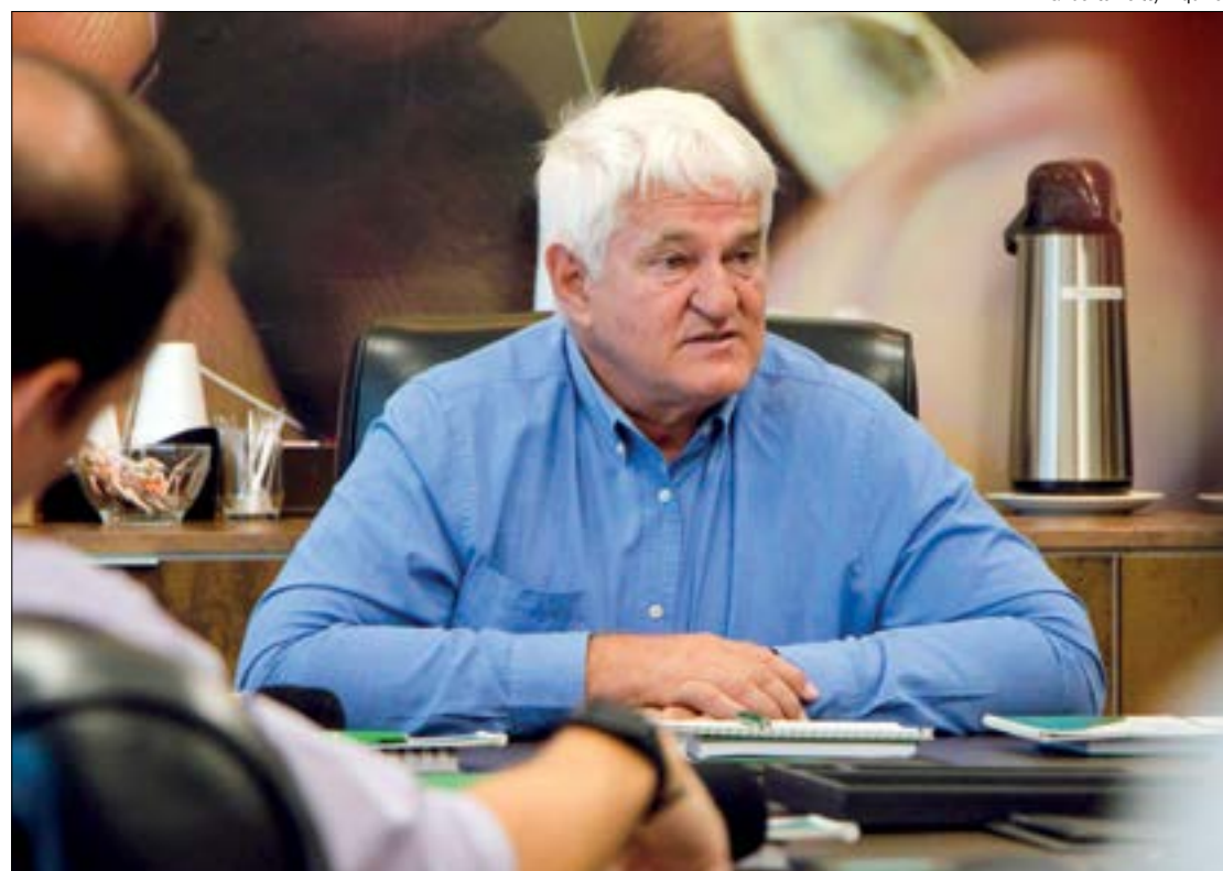
MP quer aumentar multa aplicada a Galvan e seu filho