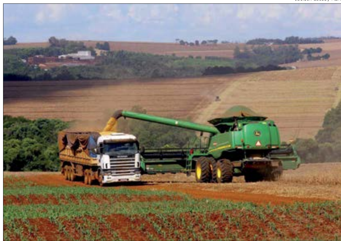
Jaelson Lucas / AEN

Os interessados podem comparecer aos postos de atendimento portando documentos pessoais, carteira de trabalho e comprovante de residência, facilitando os trâmites do atendimento. Procure os postos mais próximos de sua residência.