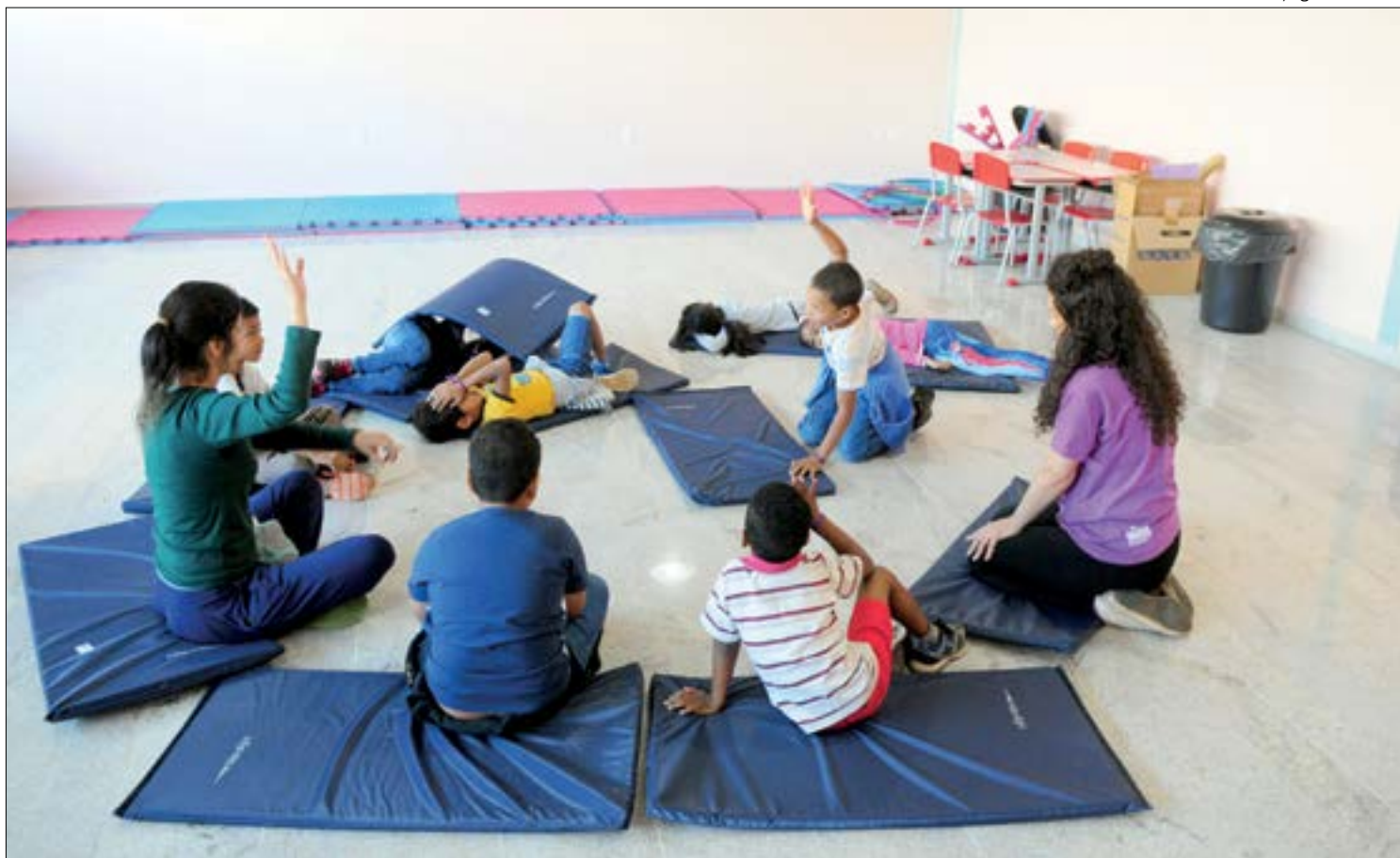
A lei institui o Plano de Atenção Educacional Especializado aos alunos com transtornos de aprendizagem

“As pessoas com dislexia eram invisíveis e hoje nos sentimos respeitados. Nos sentimos cidadãos de Mato Grosso, porque fomos vistos e começamos a ter direitos nos espaços escolares e na sociedade. Mato Grosso hoje é referência no Brasil, e digo isso porque tive a oportunidade de estar em muitos eventos pelo Brasil e todos falam desse olhar que as autoridades têm em Mato Grosso. O olhar que Mato Grosso tem para a dislexia já é