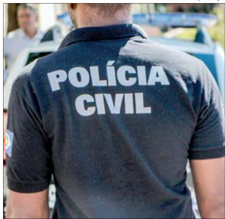
Há indícios que investigados subtraíam carregamentos de drogas e revendiam para outros criminosos