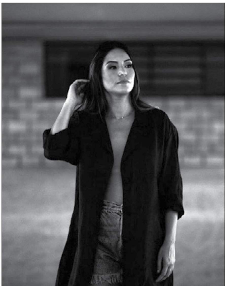
A badalada aniversariante da última semana, a DJ querida da coluna Say Ventura