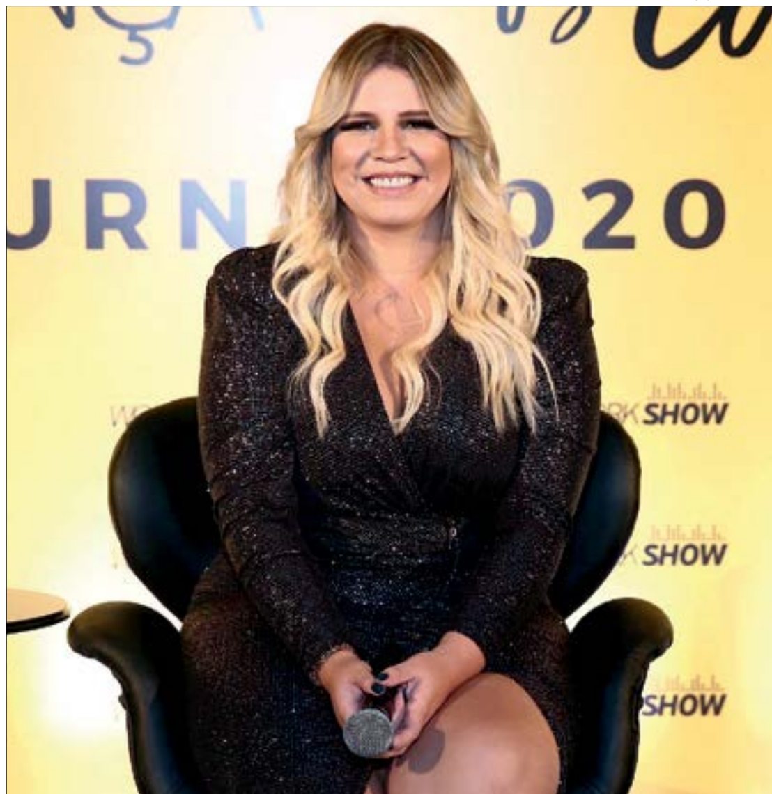
“Muito feliz em poder voltar”, diz Marília Mendonça sobre retorno aos shows

Marília Mendonça se apresenta neste final de semana (7/11 a 9/11) no Royal Weekend, da R2 Produções, na piscina do hotel Royal Tulip.