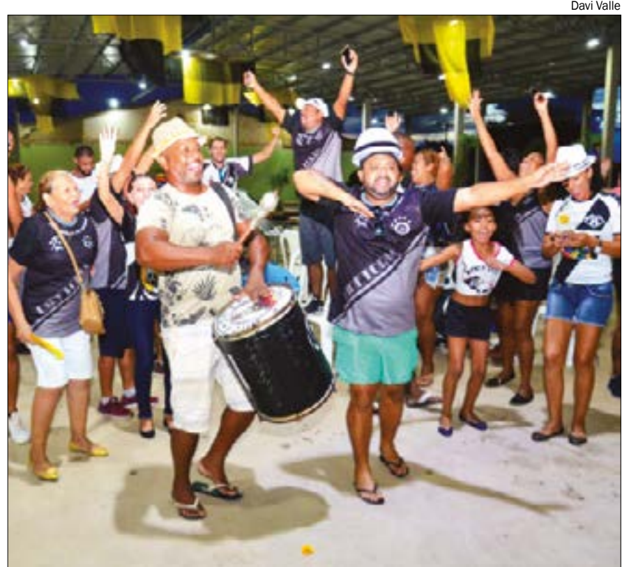
Bloco 'Boca Suja' conquista premiação do Carnaval da Gente 2020

são definidos pelo governo federal. Os pedidos passam por uma análise antes da confirmação do benefício.