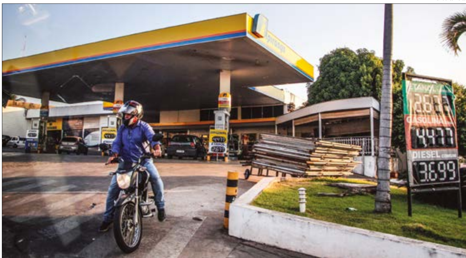
Motorista deve priorizar postos nos quais confia para evitar ser vítima desse tipo de fraude

Num primeiro momento, pode ser que não vejamos tanta importância na existência de tais laboratórios, mas ela é fundamental. Em 1998, quando não existia esse departamento, o índice de desconformidade da gasolina oscilava entre 17% e 20%. Em 2015, por sua vez, esse índice estava em torno de 1,3% apenas.