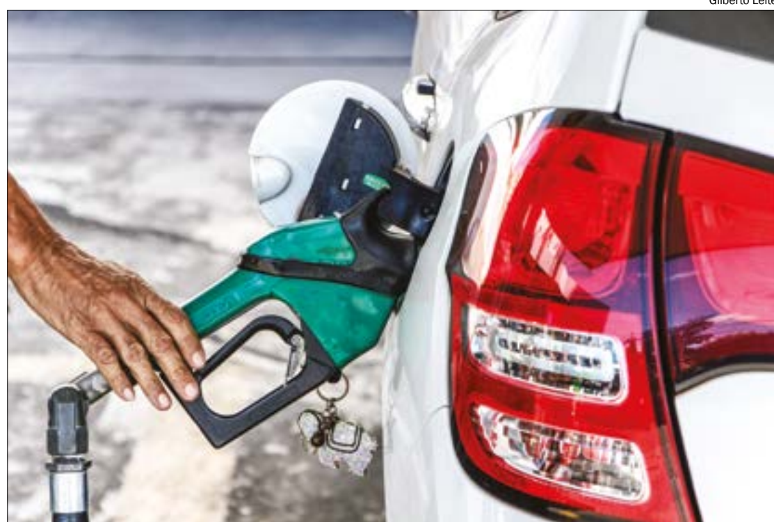
Como já dizia o ditado: “tá o olho da cara”. Pior é que o motorista não tem segurança da qualidade dos combustíveis