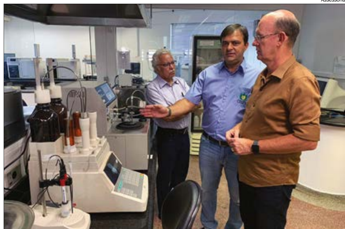
Deputado visita laboratório da UFMT e articula retomada do convênio para análise de combustíveis

O relatório também indica outro tipo de fraude realizado no comércio de combustíveis, mas este contra o Estado e não contra o consumidor. É o descaminho de produtos, esquema em que os criminosos emitem nota fiscal como se o produto fosse ‘exportado’ para outro estado. Isso porque a tributação de ICMS é feita com base no estado de destino. Assim, eles podem verificar um local em que a alíquota é menor que a nossa, emitir a nota como se fosse destinado para lá, quando, na verdade, será comercializado aqui no próprio estado.