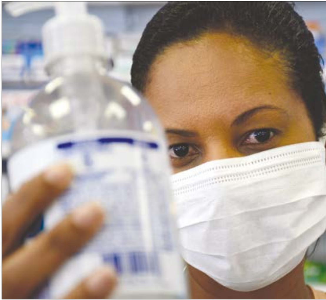
Homem de 33 anos voltou da Itália e apresentou sintomas do coronavírus; SES trata caso como um rumor

"RUMORES" MOVIMENTAM A SES - A SES informou que tem identificado os rumores a cerca