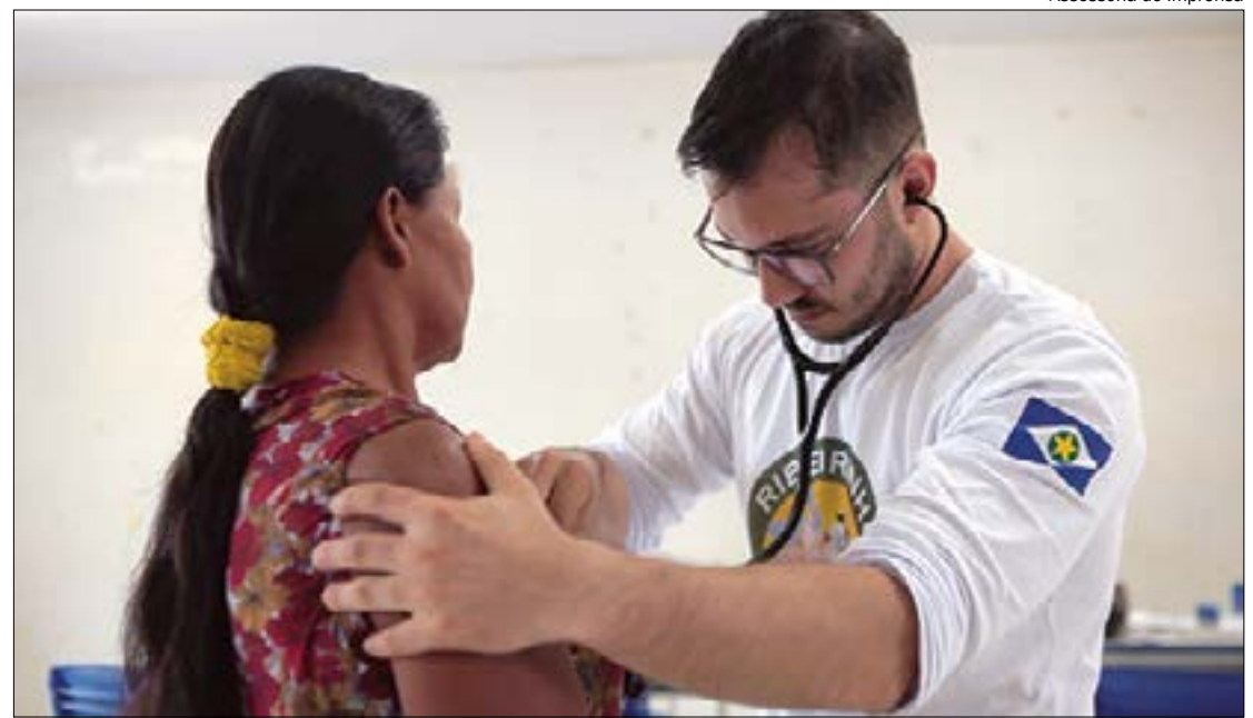
População ribeirinha pode procurar pelos serviços gratuitos de justiça, cidadania e saúde a partir desta sexta (28) até o dia 8 de março

TARIFA SOCIAL - Para se cadastrar na Tarifa Social é preciso ter em mãos um documento pessoal com foto e uma conta de luz em seu nome.