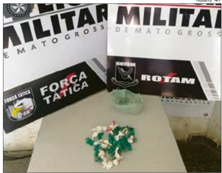
Traficante tentou se livrar da droga, mas foi preso e precisou explicar escoriações apresentadas pelo corpo

Diante do flagrante, o criminoso foi encaminhado até a Central de Flagrantes para serem tomadas as medidas cabíveis.