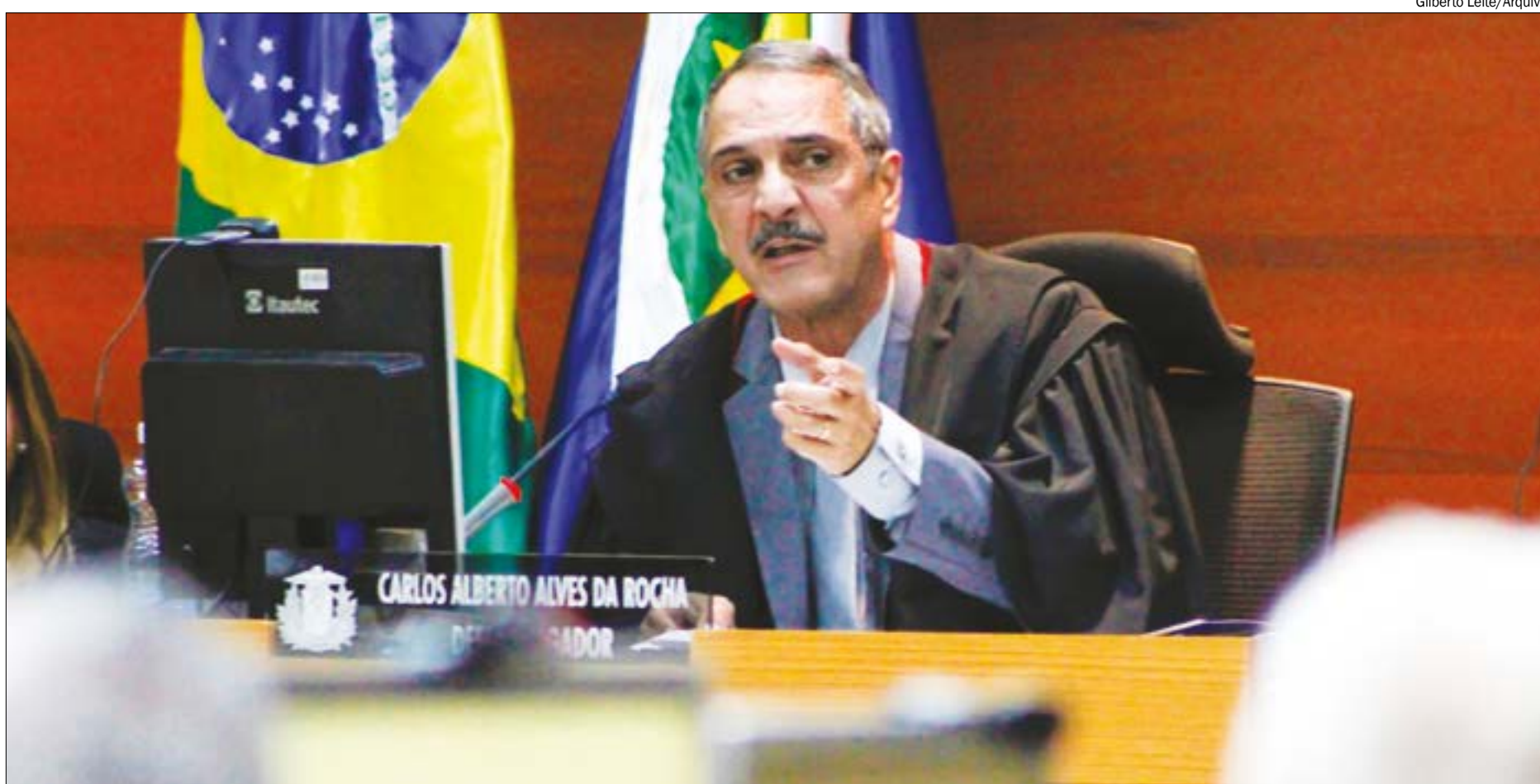
Pleno do TJ aprovou criação de novas vagas por unanimidade, mas há ressalvas quanto à quantidade

A proposta segue agora para a Assembleia Legislativa para apreciação.