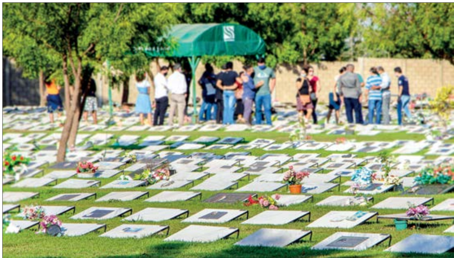
85 mil pessoas costumam ir aos cemitérios nesta data. Neste ano devido a covid-19 a visitação será diferente

Segundo a psicóloga, é cultura do brasileiro visitar uma pessoa enlutada, prestar solidariedade e apoio, mas muitos não ajudam. “Não se pede para uma pessoa não chorar, ou deixar de falar da perda. Devemos na verdade incentivar que essa pessoa chore e fale, pois