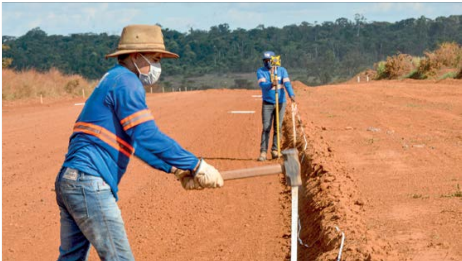
Investimento em obras públicas deve gerar 40 mil empregos no setor da construção

Além das vagas estimadas para a construção civil e comércio, também estão previstos novos empregos relacionados a serviços de arquitetura, engenharia, testes/análises técnicas, pesquisa e desenvolvimento