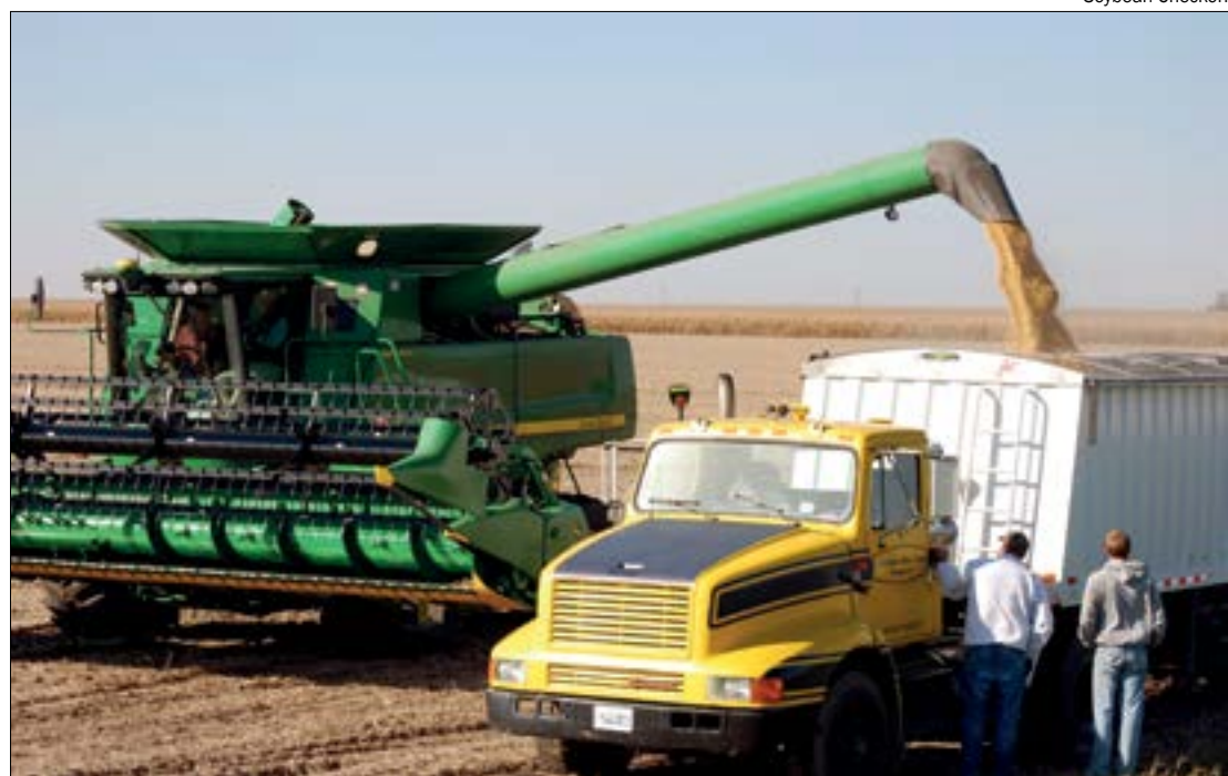
China quer reduzir dependência da soja brasileira e norte-americana

Especialistas apontam que a soja da Tanzânia é para suprir a demanda chinesa. Contudo, os agri-