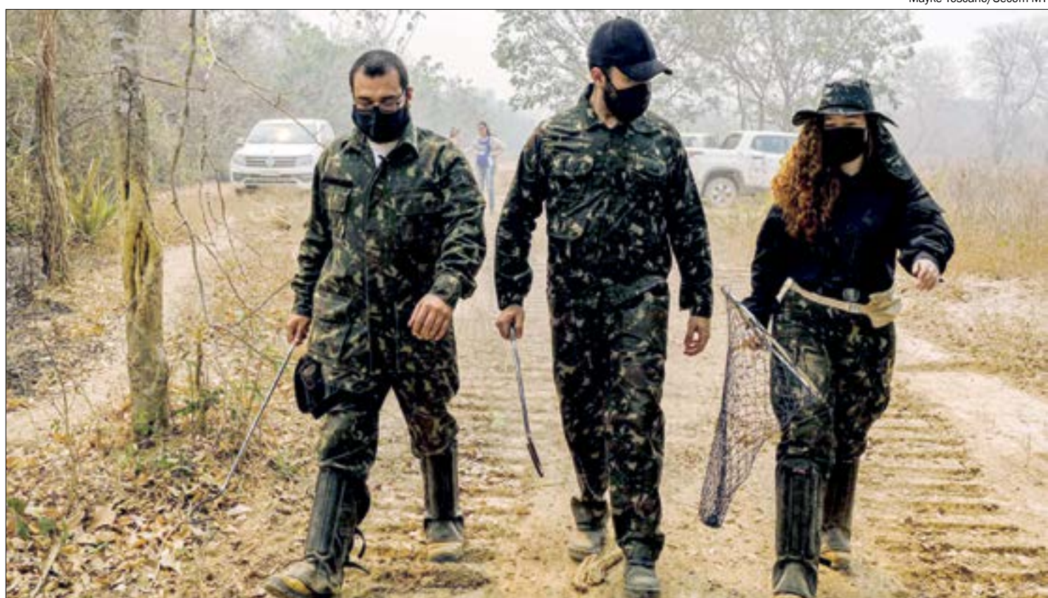
Os 44 profissionais atuaram por quase um mês no combate aos incêndios florestais