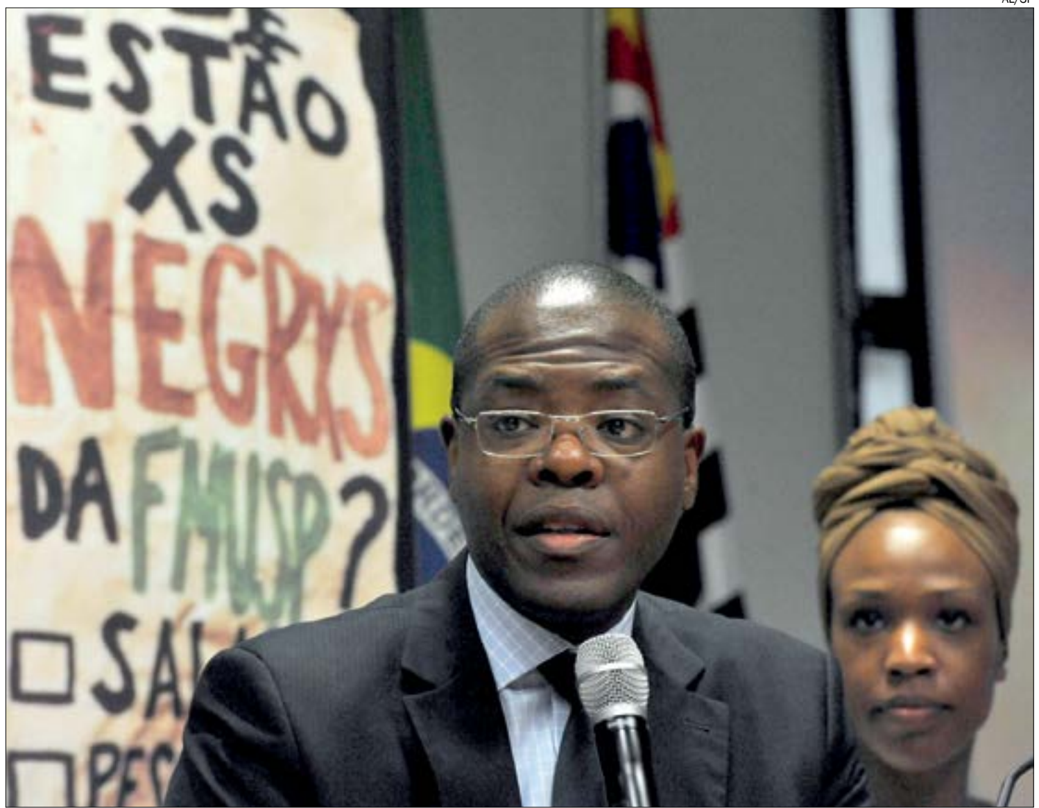
Silvio Almeida é hoje um dos principais pensadores brasileiros e uma voz potente e com credibilidade nas redes sociais

“Eu aceitei rápido o convite do Silvio Almeida para participar desta ideia. Ele foi recomen-