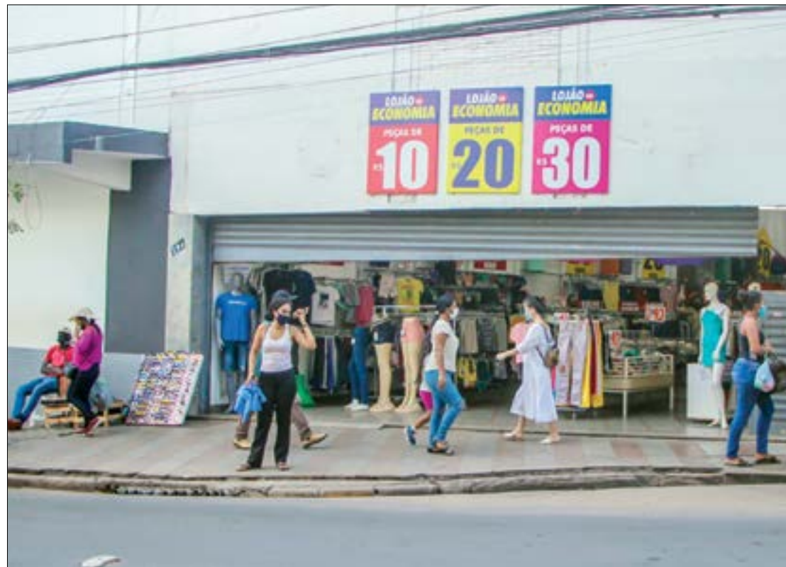
Cuiabá libera comércio aos fins de semana e feriados; bares e restaurantes têm novas regras