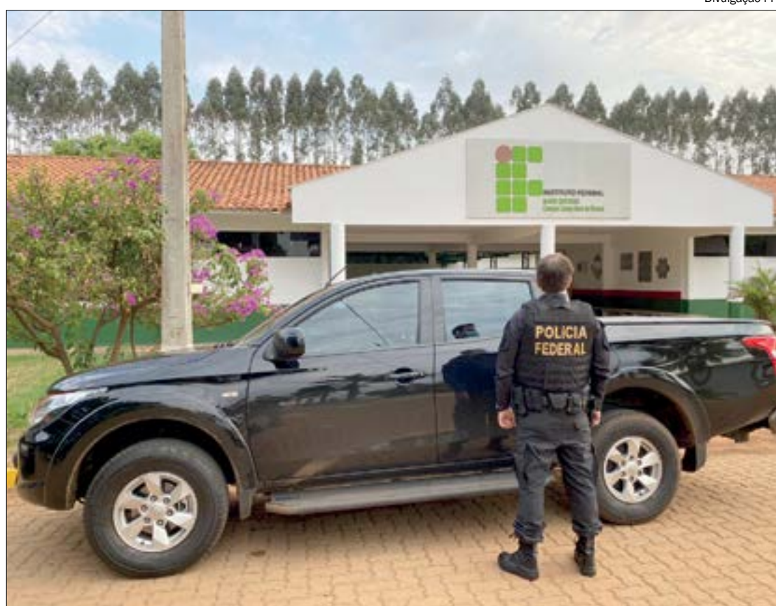
PF deflagra em Cuiabá e no interior operação contra desvio milionário no IFMT

Dentre as irregularidades investigadas, além de fraude na entrega de gêneros alimentícios, há também pagamento de notas fiscais em duplicidade, indícios de fraude na