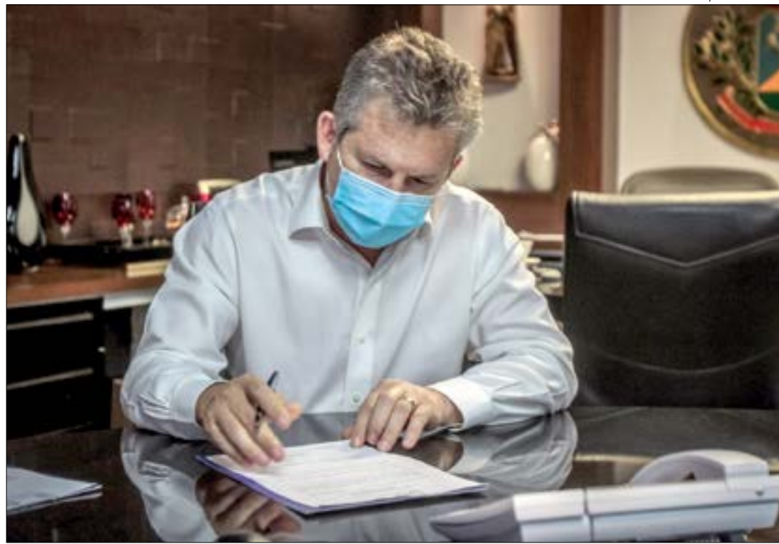
Mauro diz que bolsa para contratação de ex-reeducandos é uma forma de evitar que voltem a cometer crimes

Legislativo um pedido para dar continuidade do pagamento da verba adicional aos servidores da Saúde que atuam na linha de frente da covid-19 até dezembro. Os valores va-