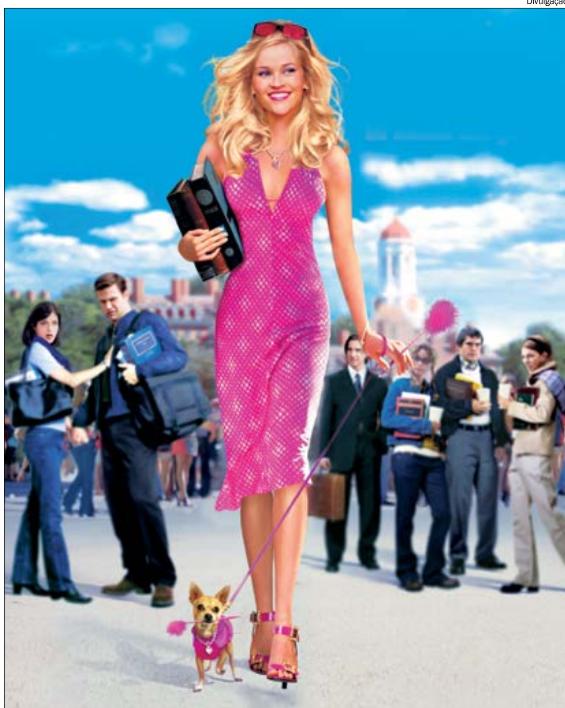
Legalmente Loira conta a história da jovem Elle Woods, estudante de moda e presidente da sua casa na faculdade

Os dois primeiros filmes de “Legalmente Loira” faturaram juntos quase US$ 267 milhões nas bilheterias. O detalhe é foram feitos por “apenas” US$ 18 milhões.