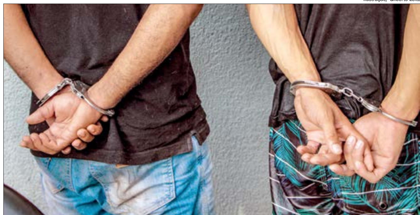
Os dois foram conduzidos, ouvidos em depoimento pela autoridade policial e autuados