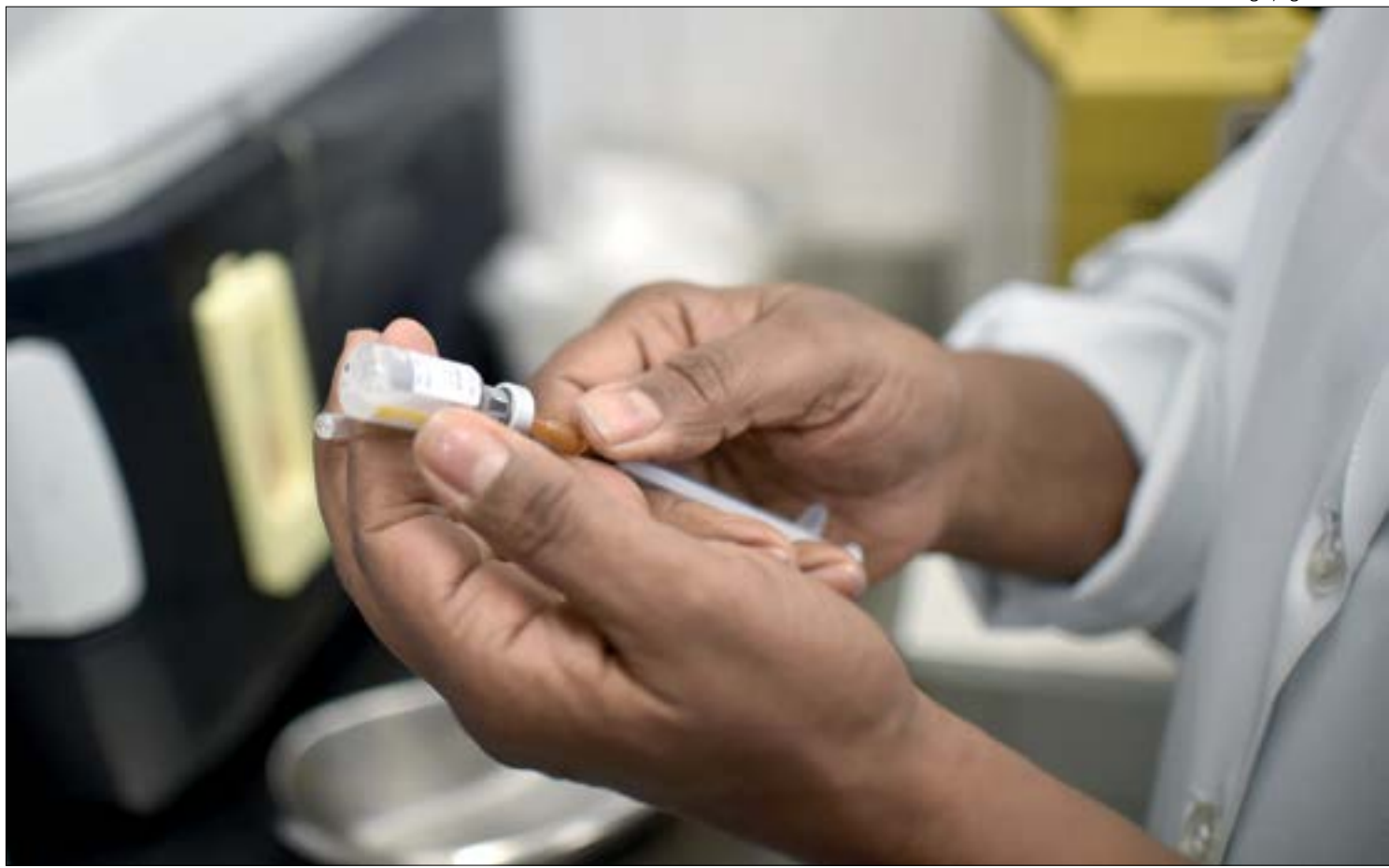
Nenhuma das vacinas tem eficácia comprovada até o momento, contudo ambas estão sendo testadas em vários estados brasileiros

Enquanto a Coronavac pode ser disponibilizada já no começo de 2021, a vacina de Oxford só deverá começar a ser entregue após o segundo semestre