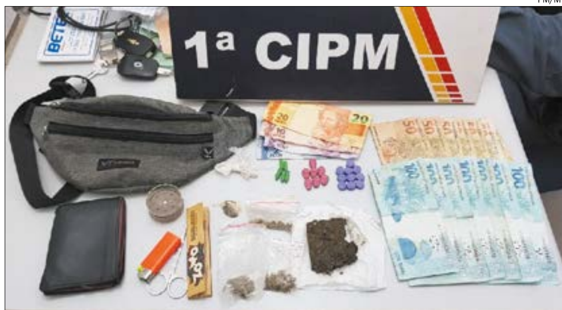
Dupla foi presa com comprimidos de ecstasy que seriam vendidos para foliões no carnaval de Chapada dos Guimarães

Os jovens confessaram que estavam fazendo a venda do entorpecente para os foliões que estavam curtindo o carnaval. Diante dos fatos, a dupla foi encaminhada à delegacia de Chapada dos Guimarães, onde ficou à disposição da justiça.