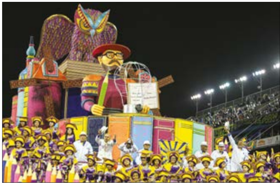
Águia de Ouro mostrou o lado bom e ruim da sabedoria, da invenção da roda até a bomba atômica, e ainda homenageou Paulo Freire

A história da campeã da Pompeia começa com integrantes da Faísca de Ouro, que até então pulavam o carnaval na cidade de Tietê