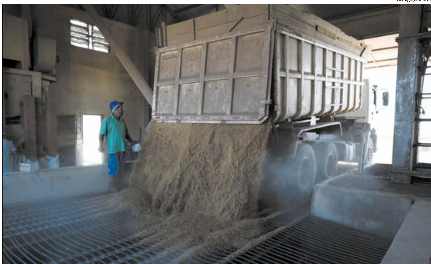
Aumento na demanda por biodiesel fez esmagamento de soja bater recorde histórico

Outro reflexo é observado nas exportações de subprodutos da soja, que também registram mudanças de comportamento. O óleo de soja reduziu 8,45% ao ano, nos últimos cinco anos e a expectativa é que a procura interna continue crescente.