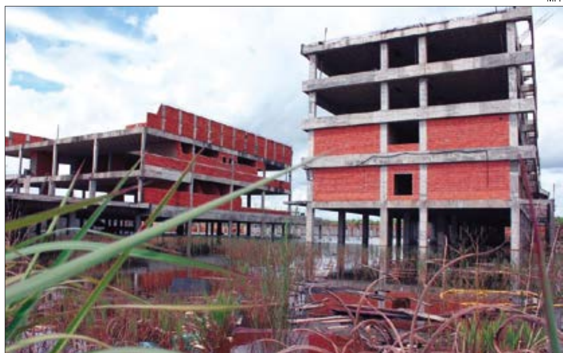
Governo já tem R$ 96 milhões garantidos para retomar as obras do Júlio Müller

O hospital contará também com 12 centros cirúrgicos, 85 consultórios, 45 salas de exame, 21 para banco de sangue e triagem e outras 53 salas administrativas.