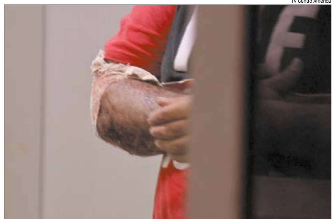
Mulher contou que namorado lhe deu socos e chutes, mas que ela conseguiu escapar e atingiu com uma faca para se defender

A Polícia Civil investiga o caso, e levantou que a briga se originou após a vítima ofender a esposa do assassino. O criminoso está sendo procurado pela polícia.