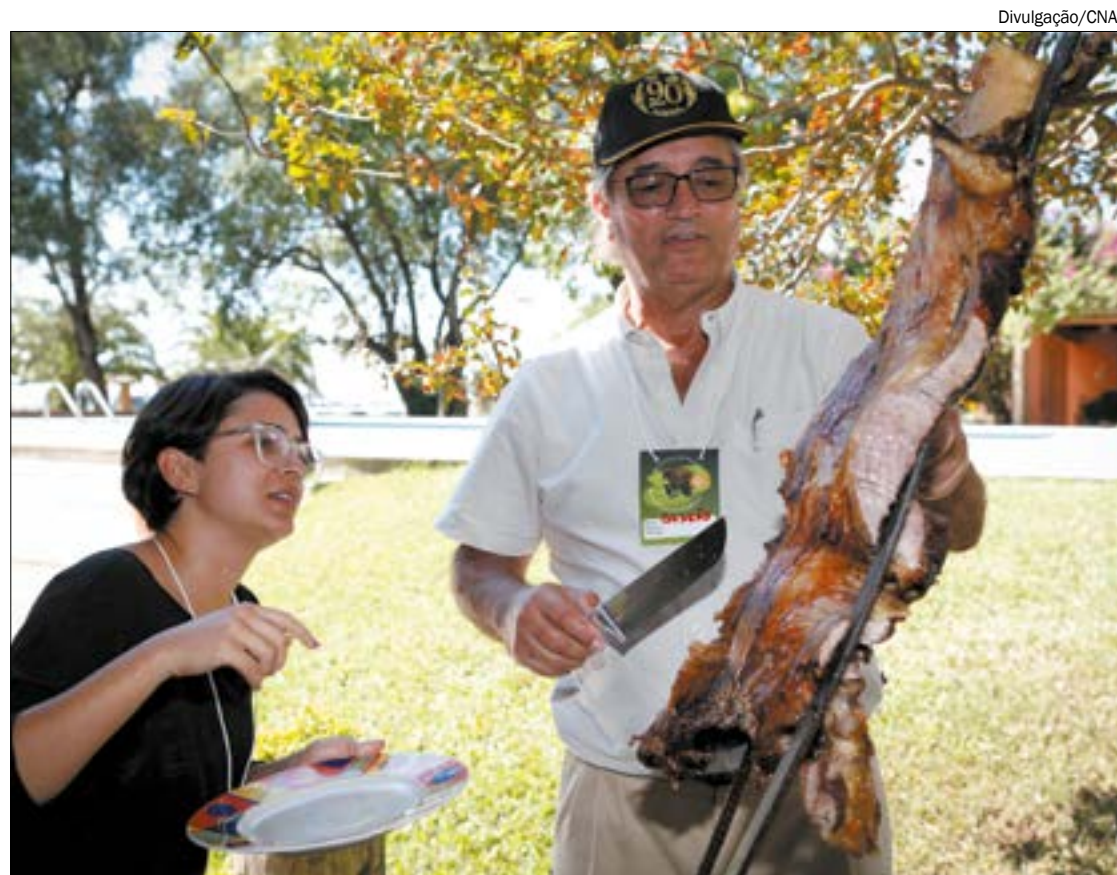
Carne brasileira voltará a fazer parte dos churrascos norte-americanos

no país. São 17 unidades que juntas possuem capacidade de produzir 5,9 m 3 por dia. No entanto, o estado fica em segundo lugar na produção nacional, com 22% do total, contra 27% do líder do ranking, o Rio Grande do Sul.