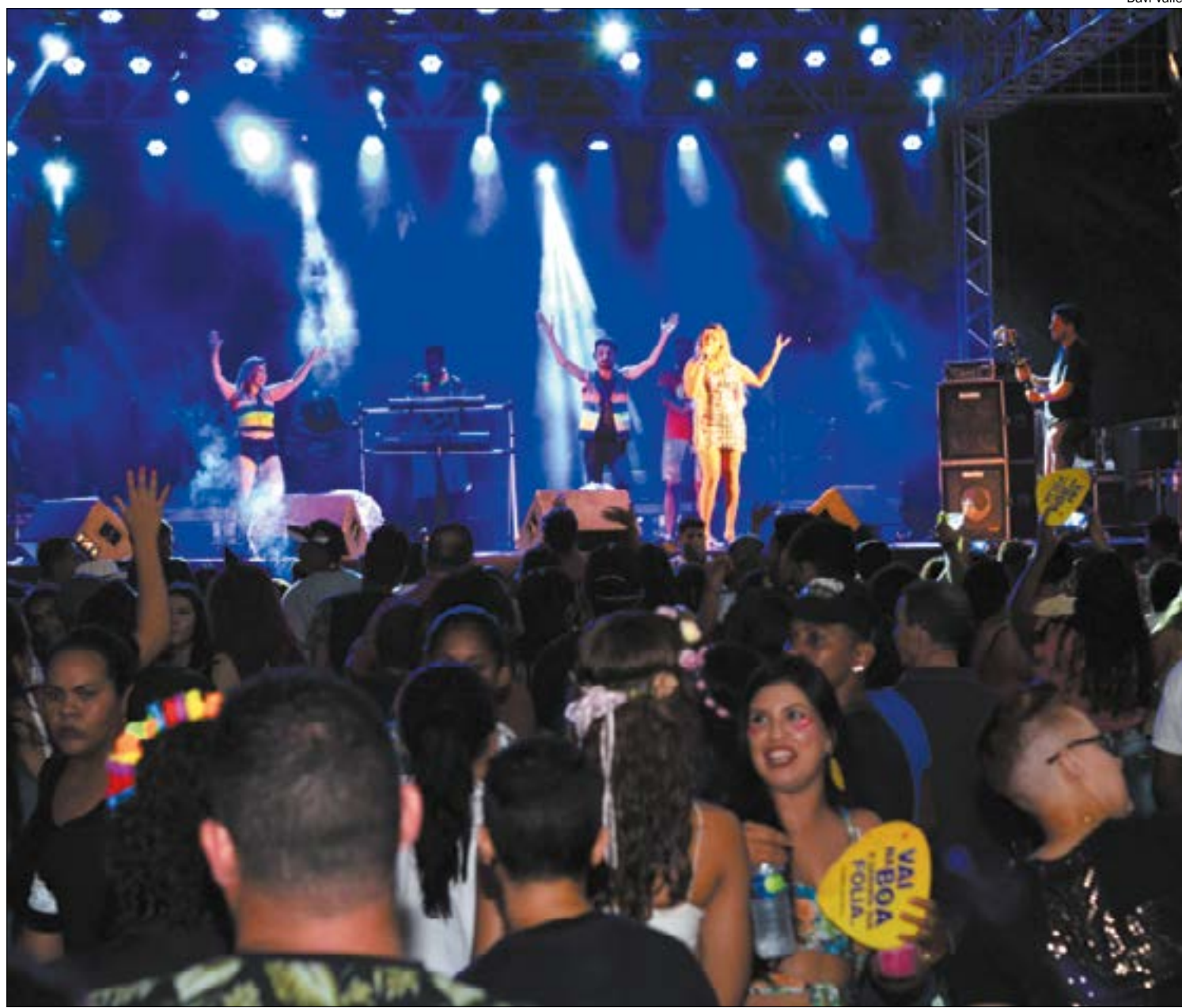
Foliões sambaram no ritmo da Bahia durante a terceira noite do Carnaval da Gente, na segunda-feira (24)

O último dia do Vinde e Vede, realizado nesta terça-feira (25), também marcou a abertura da Campanha da Fraternidade em Cuiabá, onde os fiéis fazem orações nas casas e refletem sobre um tema específico. Neste ano o tema é ‘Viu,