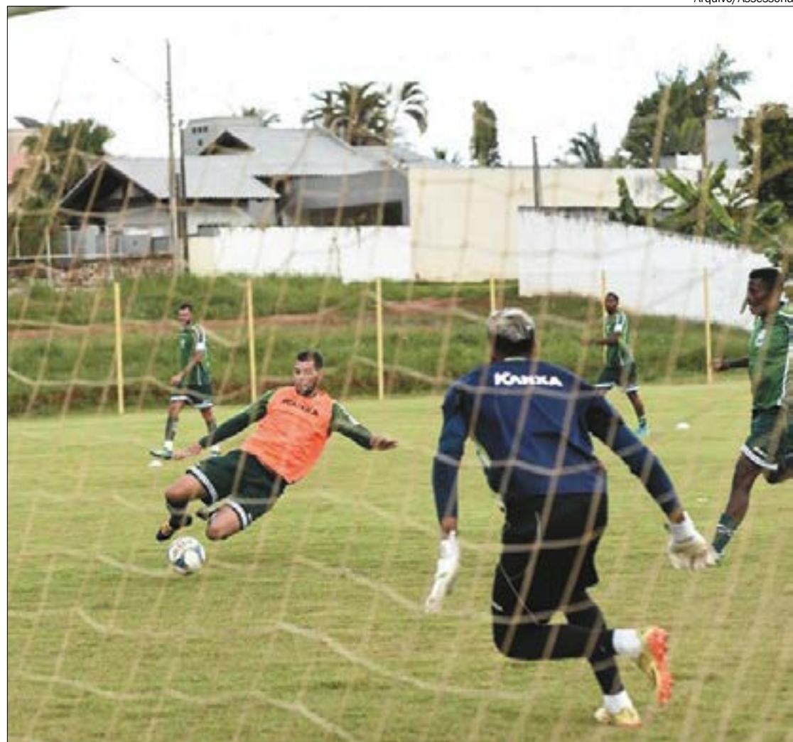
O Luverdense não tirou folga de carnaval e reforçou os treinos para enfrentar o Sinop no domingo