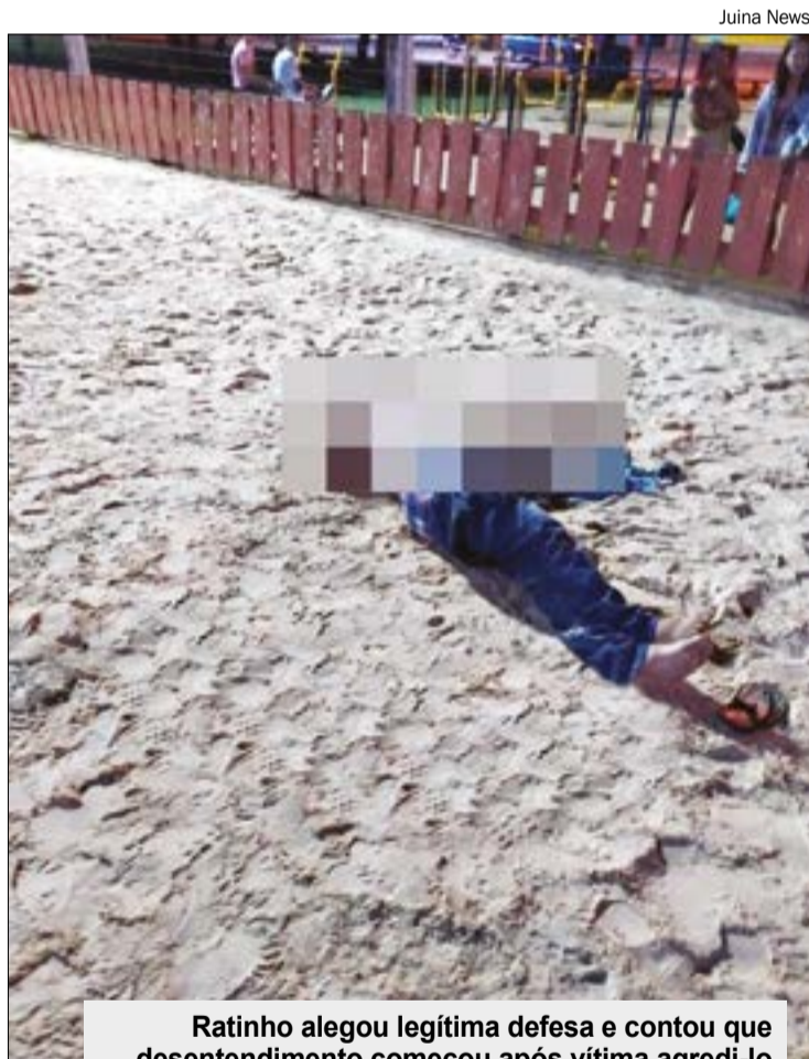
Ratinho alegou legítima defesa e contou que desentendimento começou após vítima agredi-lo com socos e chutes

meteu o homicídio em legítima defesa. De acordo com Ratinho, horas