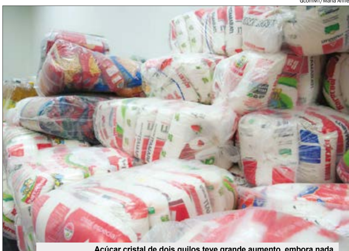
Açúcar cristal de dois quilos teve grande aumento, embora nada tenha mudado no imposto