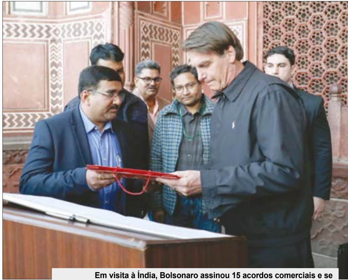
Em visita à Índia, Bolsonaro assinou 15 acordos comerciais e se reuniu com lideranças locais