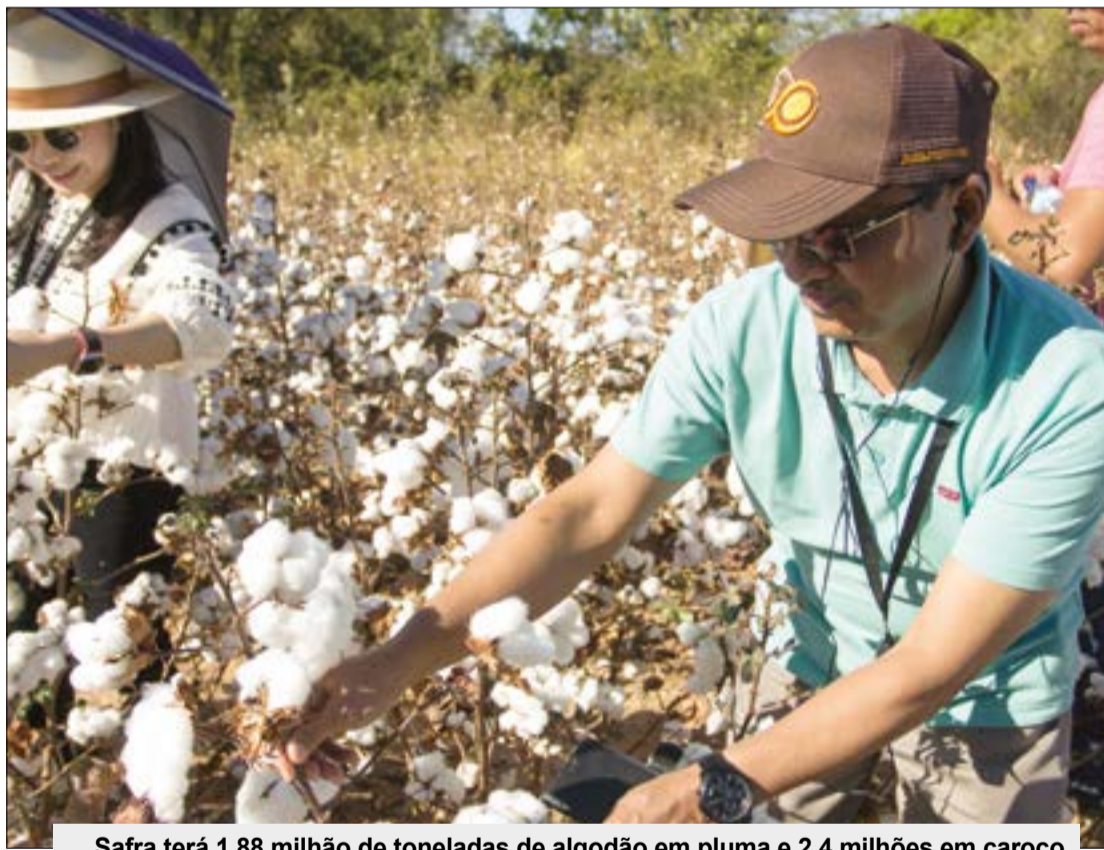
Safra terá 1,88 milhão de toneladas de algodão em pluma e 2,4 milhões em caroço

Conforme o Imea, para os contratos de julho e dezembro deste ano, as cotações no dia 23 de janeiro avançaram 3,66% e 1,80%, respectivamente, quando comparado ao mesmo dia do mês passa-