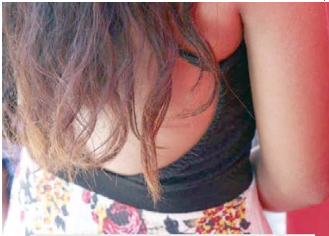
A garota contou que tomou remédio dado pelo pai e apagou. Apenas depois de cinco dias sendo abusada, ela conseguiu pedir socorro

Disque 180 - A Central de Atendimento à Mulher em Situação de Violên-