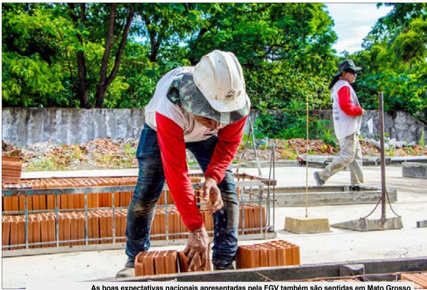
As boas expectativas nacionais apresentadas pela FGV também são sentidas em Mato Grosso

EXPECTATIVA LOCAL - As boas expectativas nacionais apresentadas pela FGV são sentidas em