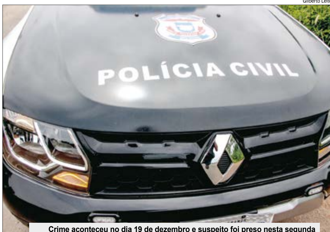
Crime aconteceu no dia 19 de dezembro e suspeito foi preso nesta segunda (27), após investigação da Delegacia de Homicídios e Proteção à Pessoa

CRIME - O crime aconteceu na noite do dia 19 de janeiro deste ano. Uma das vítimas, atingida por disparos de arma de fogo, morreu no local. O outro rapaz foi ferido e socorrido ao Pronto-Socorro da cidade. Vítimas e o suspeito tiveram discussões via aplicativo de mensagens envolvendo, supostamente, questão do trabalho.