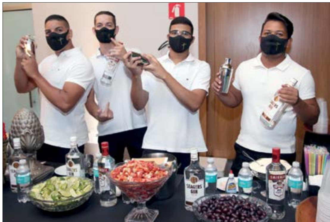
Os bartenders superanimados e que arrasaram nos drinques