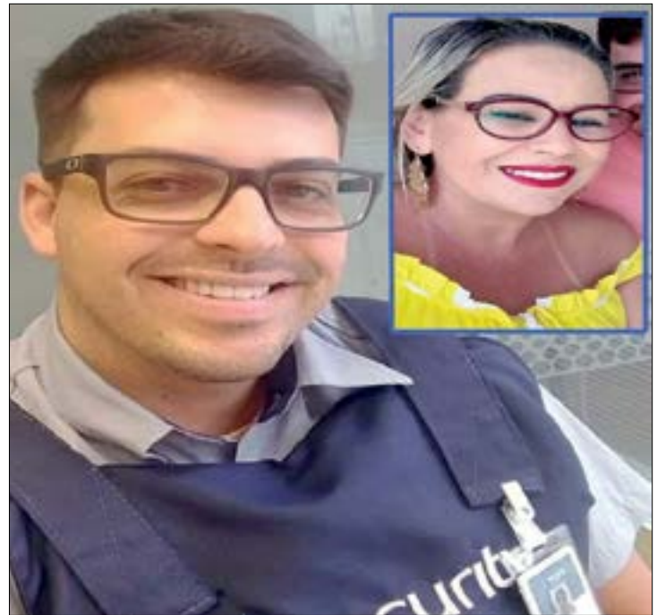
Meire foi presa e encaminhada à delegacia. Ela aguarda a transferência para um presídio feminino