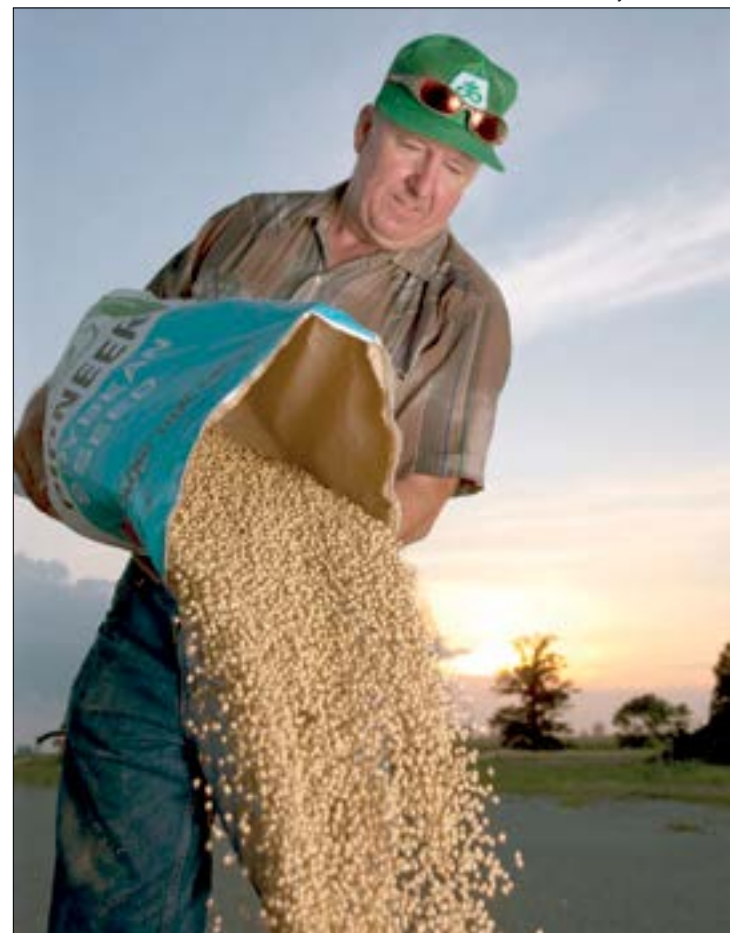
Mais de 60% da safra já foi vendida, porém agricultores têm dificuldade na semeadura