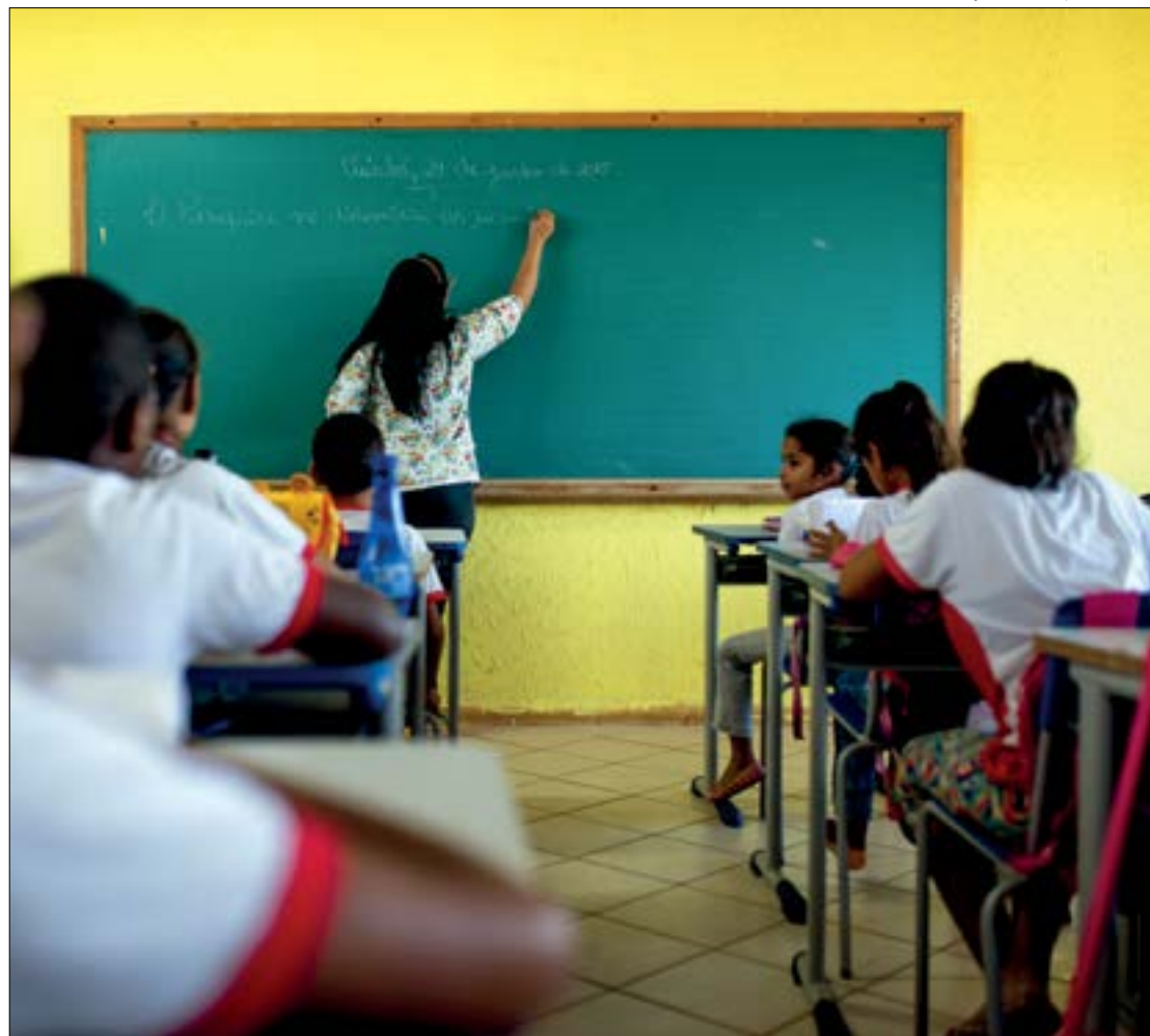
A sala de aula antes cheia de alunos agora se adapta à nova realidade com ensino remoto

“Educar é uma convivência, não é só conteúdo. A convivência via remota é muito superficial apesar do contato de ouvi-los e vê-los, não tem o tato de estar todo dia, de poder olhar nos olhos. O aprendizado vai muito além do que só o livro oferece”, conta Mário.