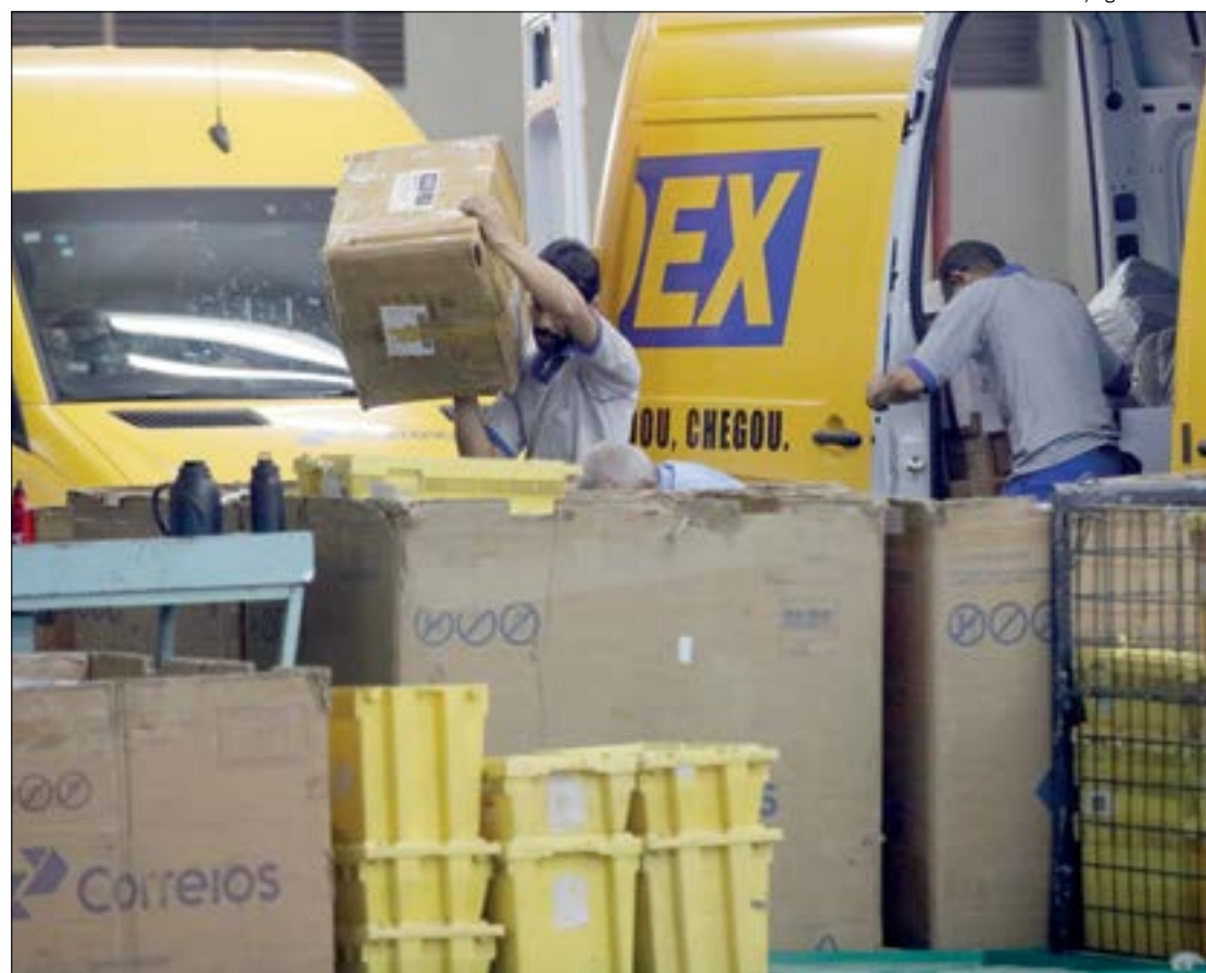
Privatização dos Correios ainda tem um longo caminho até chegar ao Congresso