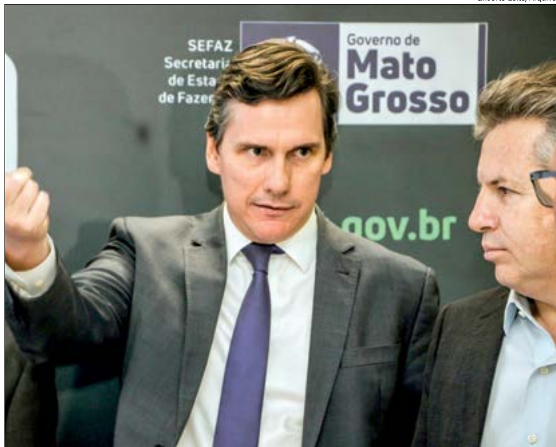
Após iniciar o ano com previsão de déficit, Gallo revela superávit de R$ 3,6 bil nas contas estaduais

Sobre as perspectivas para o futuro, Gallo lem-