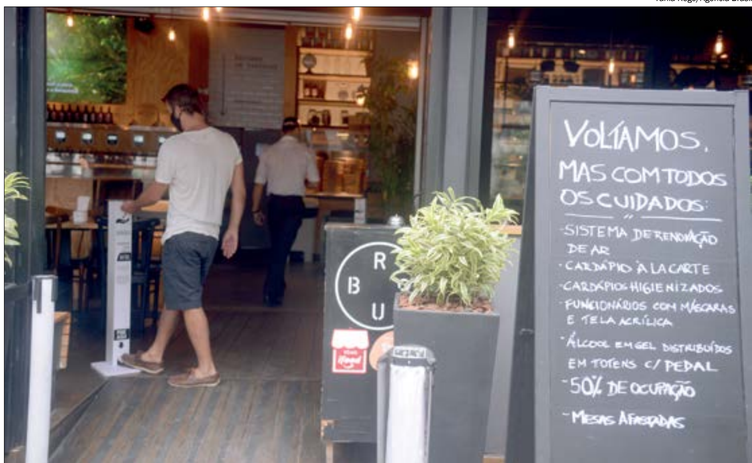
Funcionando ainda sob restrições, setor de restaurantes luta para reaver o faturamento e superar as dívidas