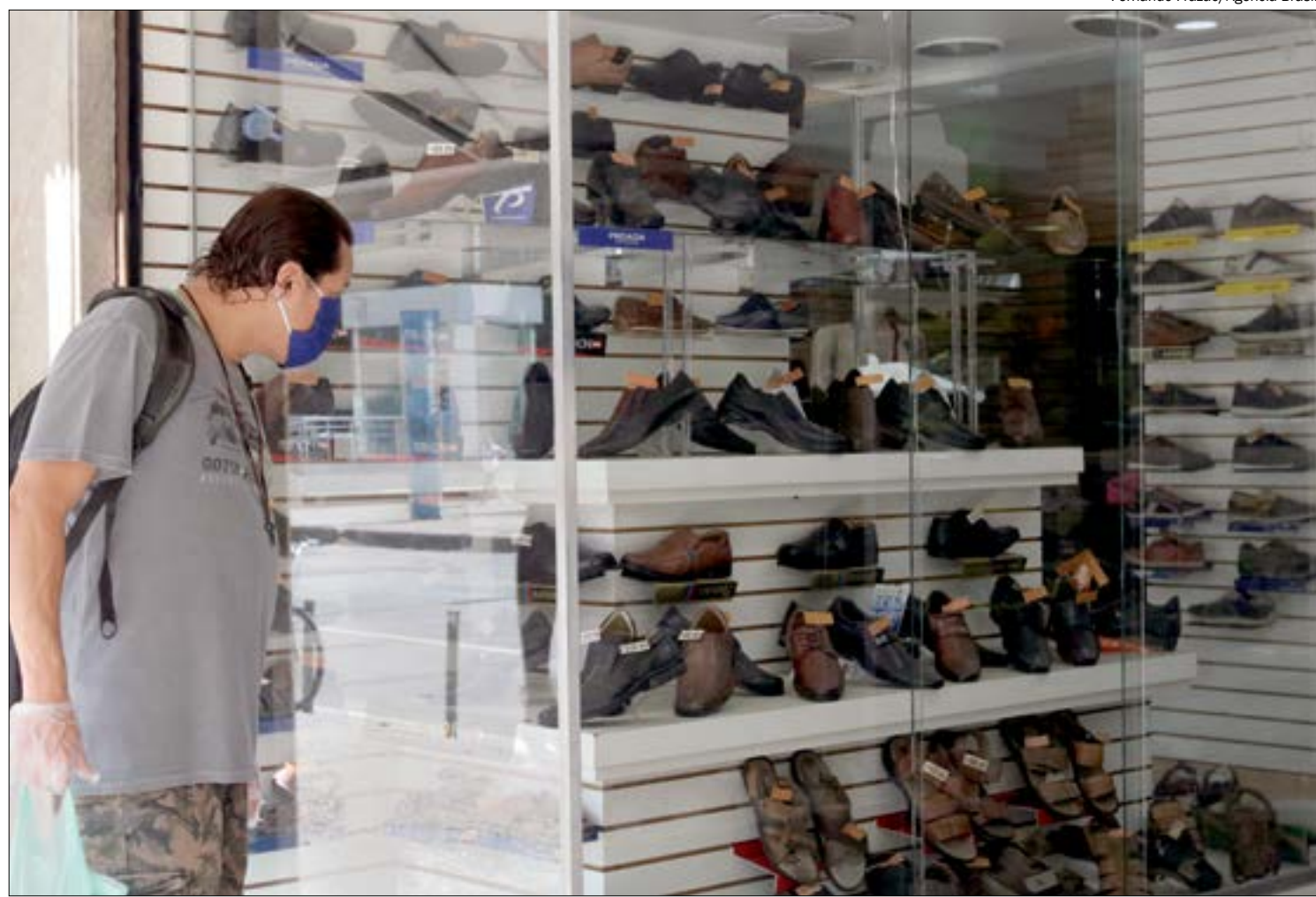
Faturamento do comércio cresceu 3,4% de julho para agosto e atingiu maior patamar em 20 anos