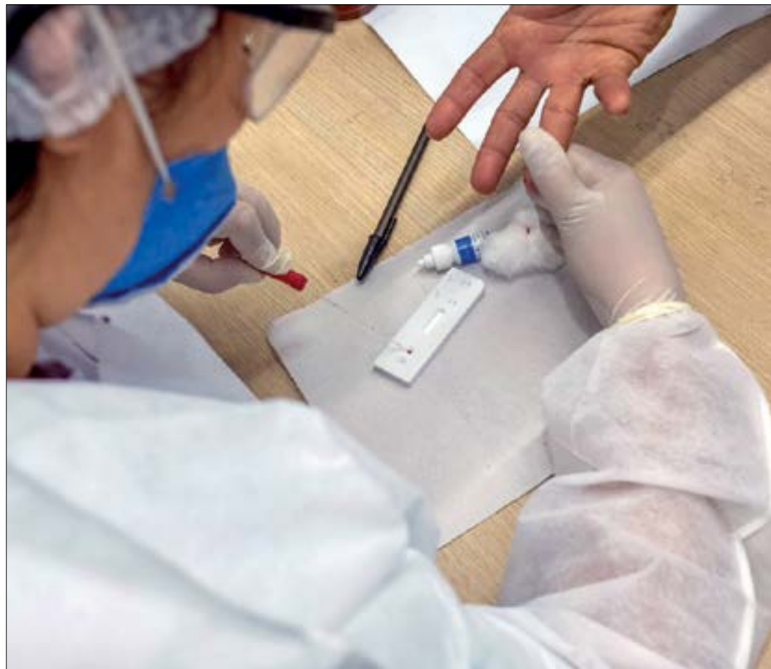
Do total de casos de covid-19 em residentes em Mato Grosso, 19,6% foram de residentes na capital