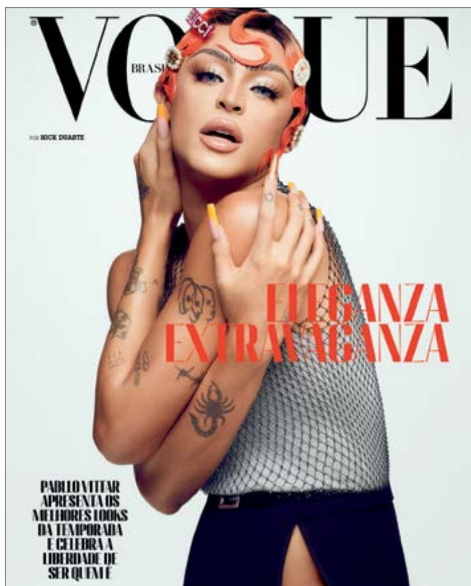
A capa da revista “Vogue Brasil” com a drag queen Pabllo Vittar foi um momento histórico. Trata-se de um grande passo em representatividade ver drag queens estampando a capa da conceituada e veterana publicação tão respeitada no mundo da moda. Muitas celebridades parabenizaram a revista pela atitude