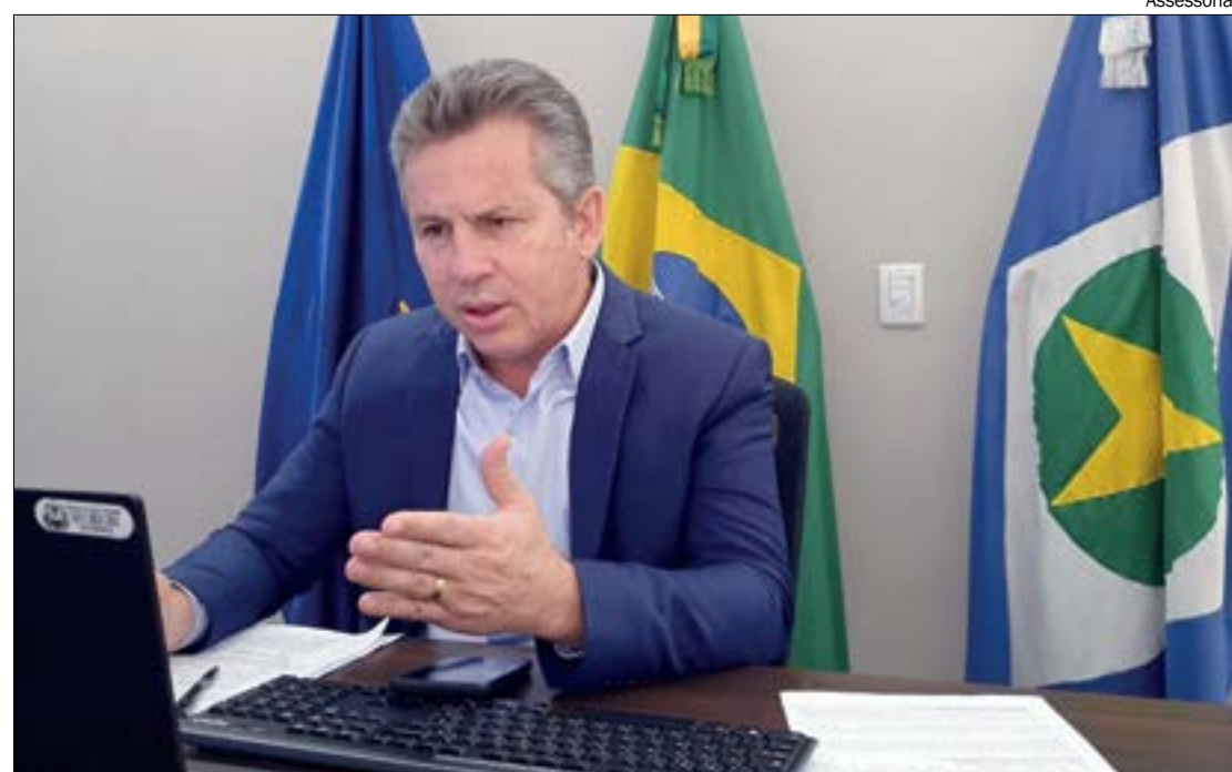
Mauro lembra que áreas desmatadas legalmente são usadas para gerar milhares de empregos

giões pouco habitadas, o que gera grande custo para o Estado e traz pouca receita em função dessa pouca ocupação”, disse.