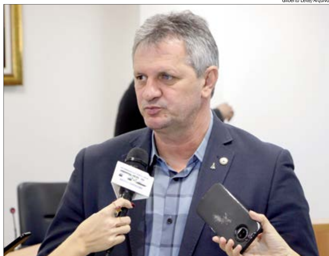
Após derrota no plenário com votos da base, líder do governo tenta mudar o projeto para recuperar apoio