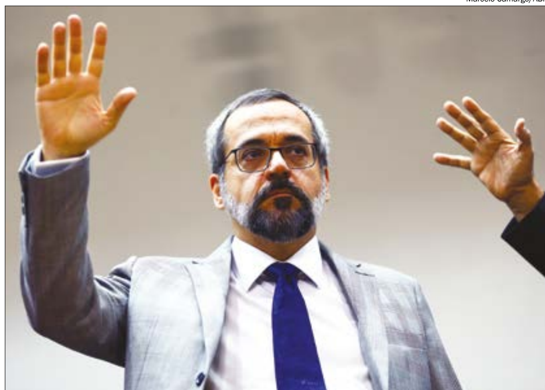
Deputados pedem abertura do processo, pois alegam “ineficiência do ministro quanto à gestão das políticas de alfabetização”

“A ilegitimidade ativa dos requerentes é prejudicial que obstaculiza