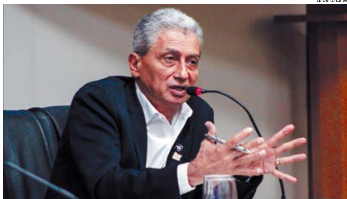
Presidente da AMM, Neurilan diz ter apoio de 80 prefeitos para disputa ao Senado

Ainda que a instituição conte com um orçamento na margem de R$ 1 bilhão, a cada ano a UFMT tem cada vez menos poder de investimento.