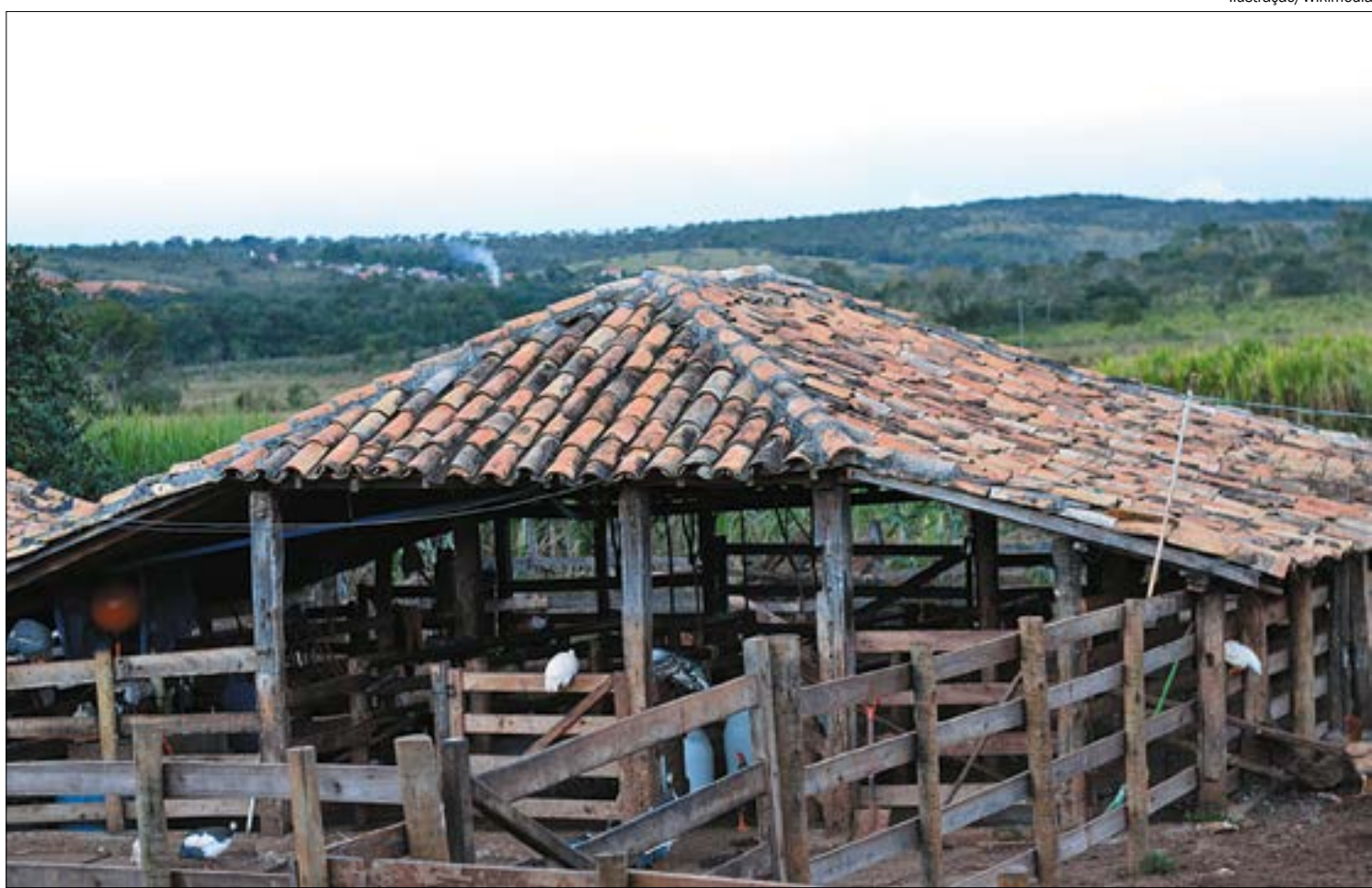
Homem foi mantido por quatro dias no curral de uma fazenda próximo à fronteira com a Bolívia

Os criminosos levaram seu celular, carteira de habilitação e R$ 300,00 em dinheiro. O empresário não soube indicar o rumo que eles tomaram após libertá-lo.