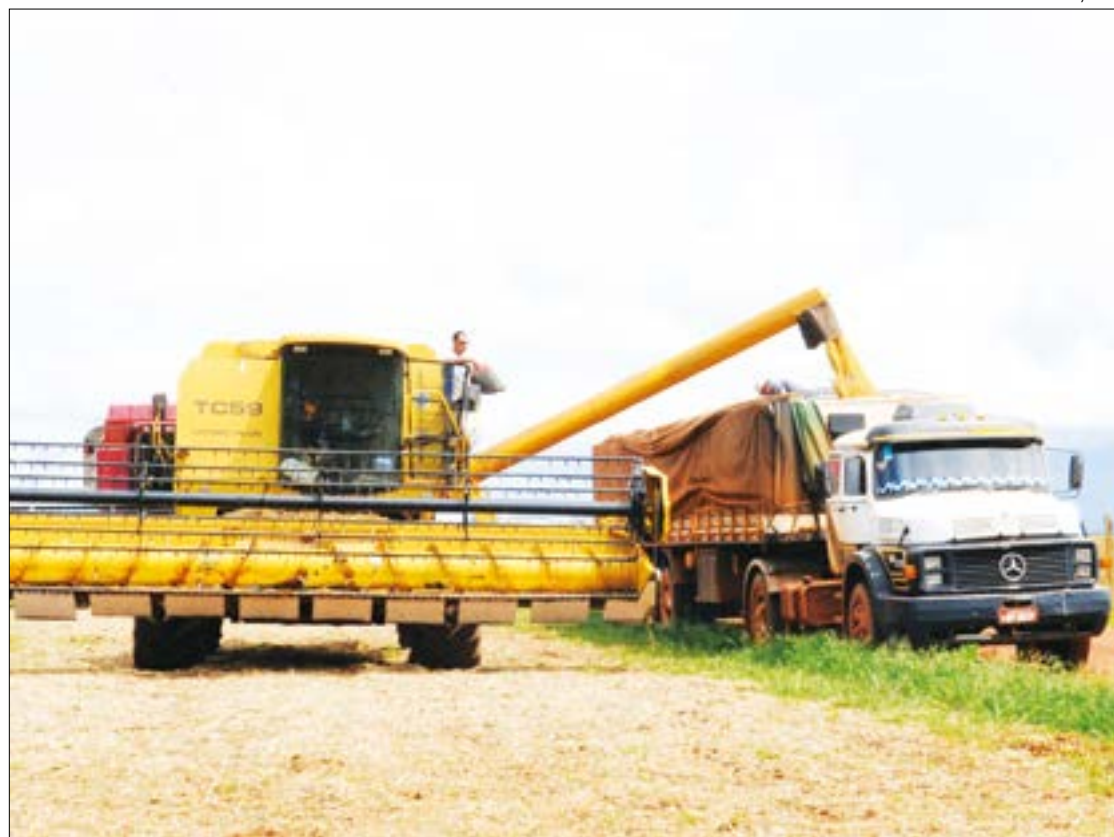
Ipea prevê crescimento maior do PIB do setor agropecuário