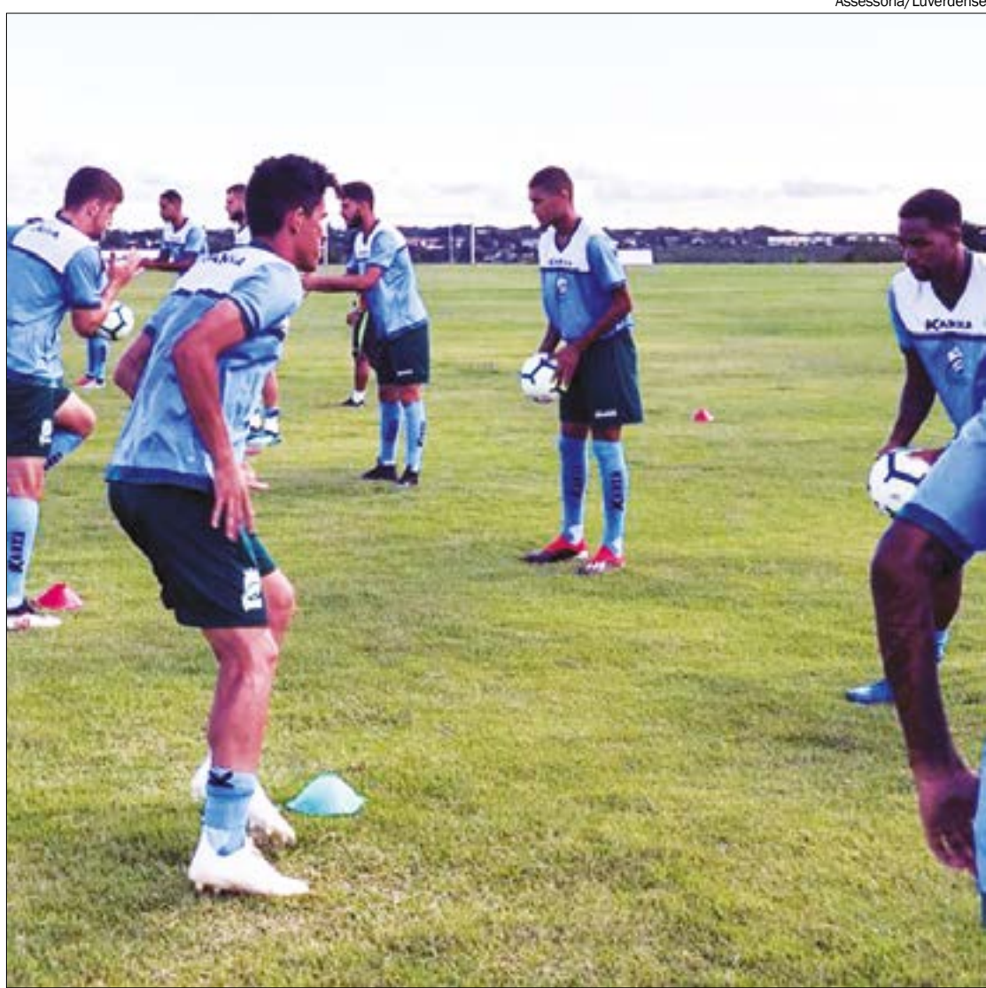
Partida contra o Araguaia vale a permanência do Luverdense na série A do Estadual