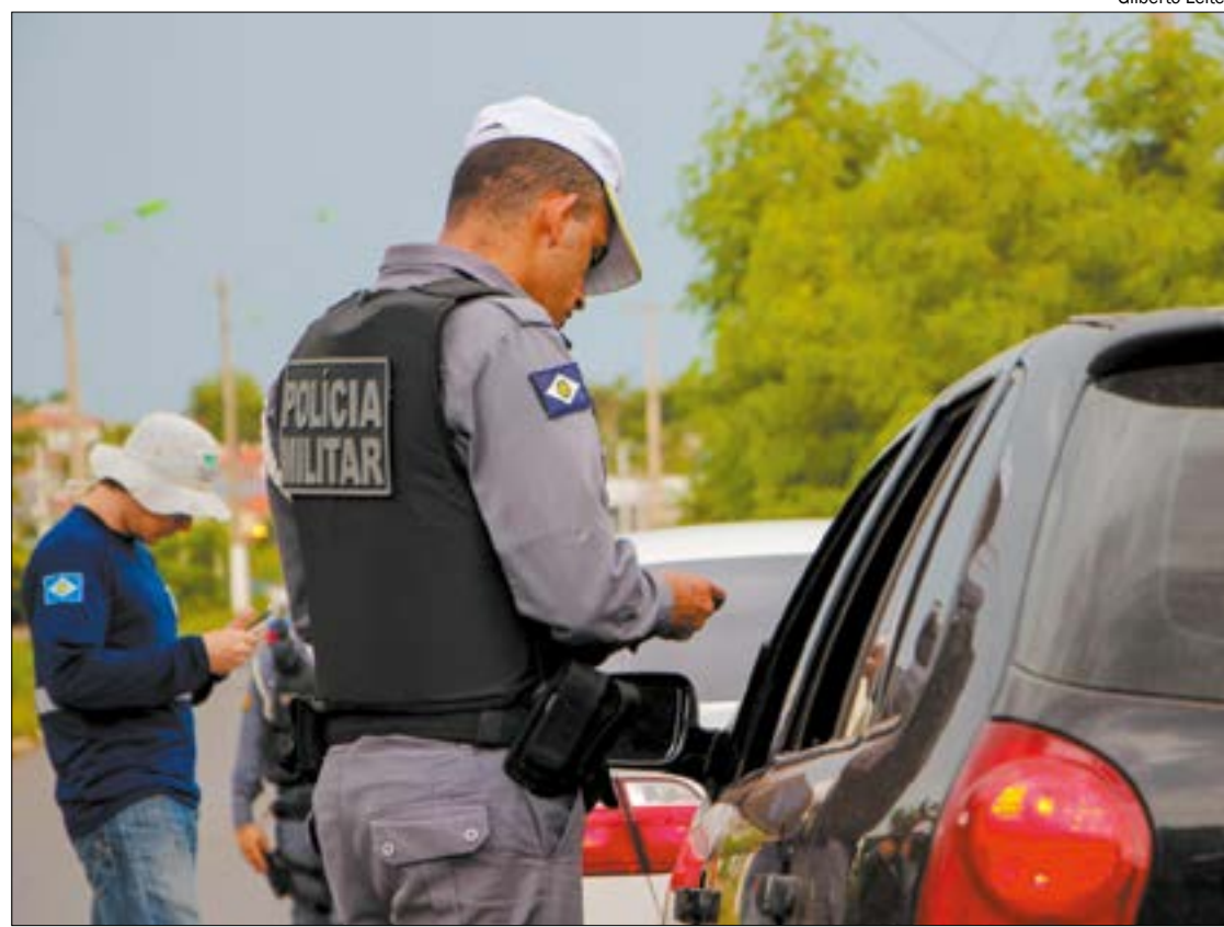
As blitz de Lei Seca irão acontecer dentro das cidades e também nas rodovias estaduais de Mato Grosso