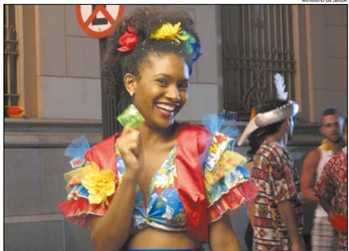
SES distribuiu 2 milhões de preservativos em Mato Grosso para folião curtir o carnaval com responsabilidade

A sífilis é uma Infecção Sexualmente Transmissível (IST) curável e exclusiva do ser humano, causada pela bactéria Treponema pallidum . Pode apresentar várias manifestações clínicas e diferentes estágios (sífilis primária, secundária, latente e terciária).