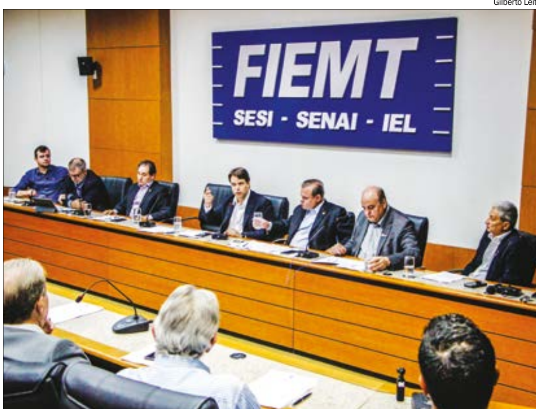
Representantes do setor produtivo se reuniram nesta sexta (21) para debater estratégias de enfrentamento na reforma tributária