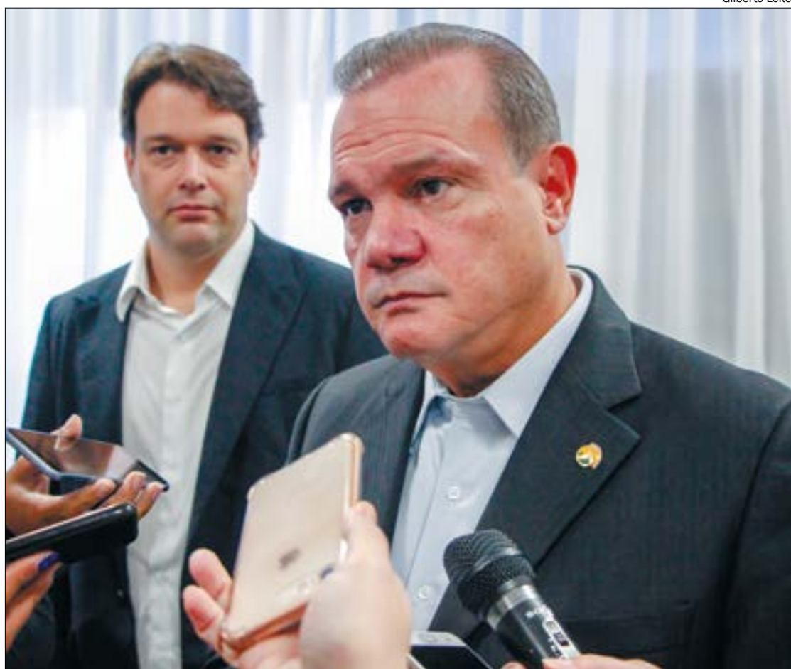
Senador explica que alternativas ao ‘Plano de Cura’ da BR-163 podem custar caro e demorar muito para serem efetivadas

“Agora também isso dependerá da Justiça. Por exemplo: a prorrogação das construções das rodovias, agora o Supremo Tribunal Federal deverá julgar isso, espero que seja logo após o carnaval. Isso seria muito bom, pelo menos aí a gente teria a resposta se aceita ou não, porque no caso da malha paulista é uma prorrogação com a mesma empresa. Aqui não, tem que ser a prorrogação e a substituição”, explica o senador.