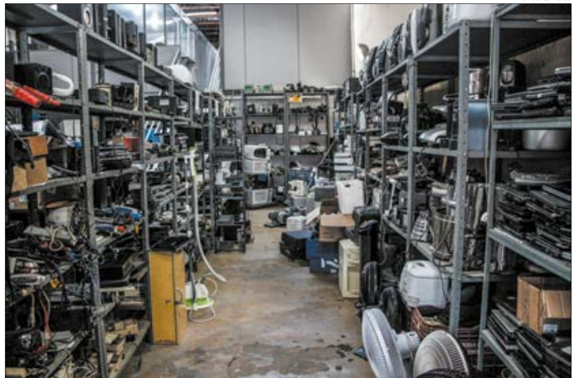
Lâmpadas, equipamentos eletrônicos, toner de impressora são alguns dos materiais que podem ser reaproveitados na economia circular