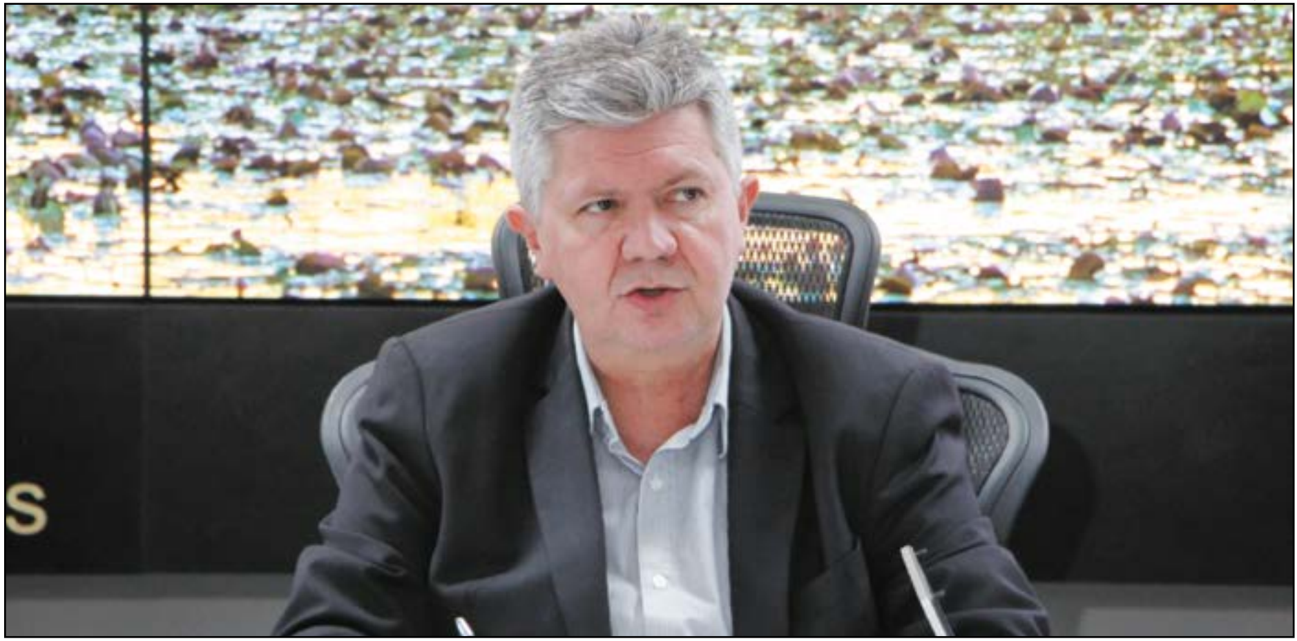
Combate ao tráfico terá atenção redobrada e ações da Lei Seca reforçam a segurança durante os quatro dias de folia, contou Bustamante

O secretário de Segurança Pública do Estado, Alexandre Bustamante, disse que os foliões poderão curtir tranquilamente a folia, pois a segurança estará reforçada. "O Corpo de Bombeiros já atuou de forma preventiva nas áreas verificando a segurança dos locais, a Polícia Civil vai reforçar o efetivo nas delegacias, assim como a Politec estará aumentando o efetivo para receber as perícias necessárias neste momento, além da Polícia Militar que estará nas ruas realizando rondas e trabalho ostensivo", explicou o secretário.