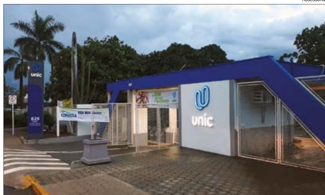
Segundo o MP, Unic estaria cobrando mensalidade integral de alunos que não estavam cursando todas as disciplinas

OUTRO LADO - A Unic - unidade Rondonópolis - (MT) informa que até o momento não obteve acesso ao inteiro teor da ação, eis que não foi citada. A instituição permanece à disposição para sanar quaisquer dúvidas adicionais.