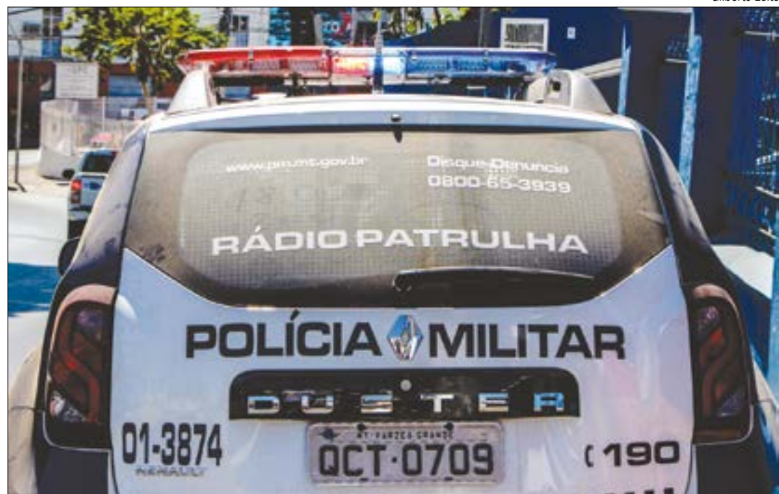
A mulher contou que o companheiro já havia levado outros homens para casa e a obrigado a ter relação sexual com eles