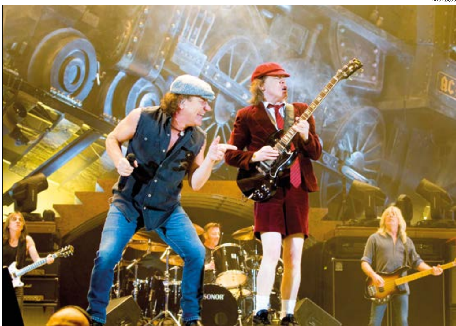
Novo álbum do AC/DC será a primeira produção da banda após seis anos

Informações dão conta de que o novo álbum já está completamente gravado e deveria ter chegado por volta de abril deste ano, mas teve sua estreia atrasada devido à pandemia do novo