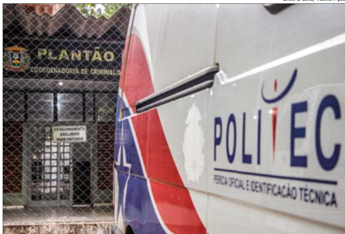
Gilberto Leite/ Ilustração

A polícia não informou se os militares foram afastados ou continuam atuando normalmente.