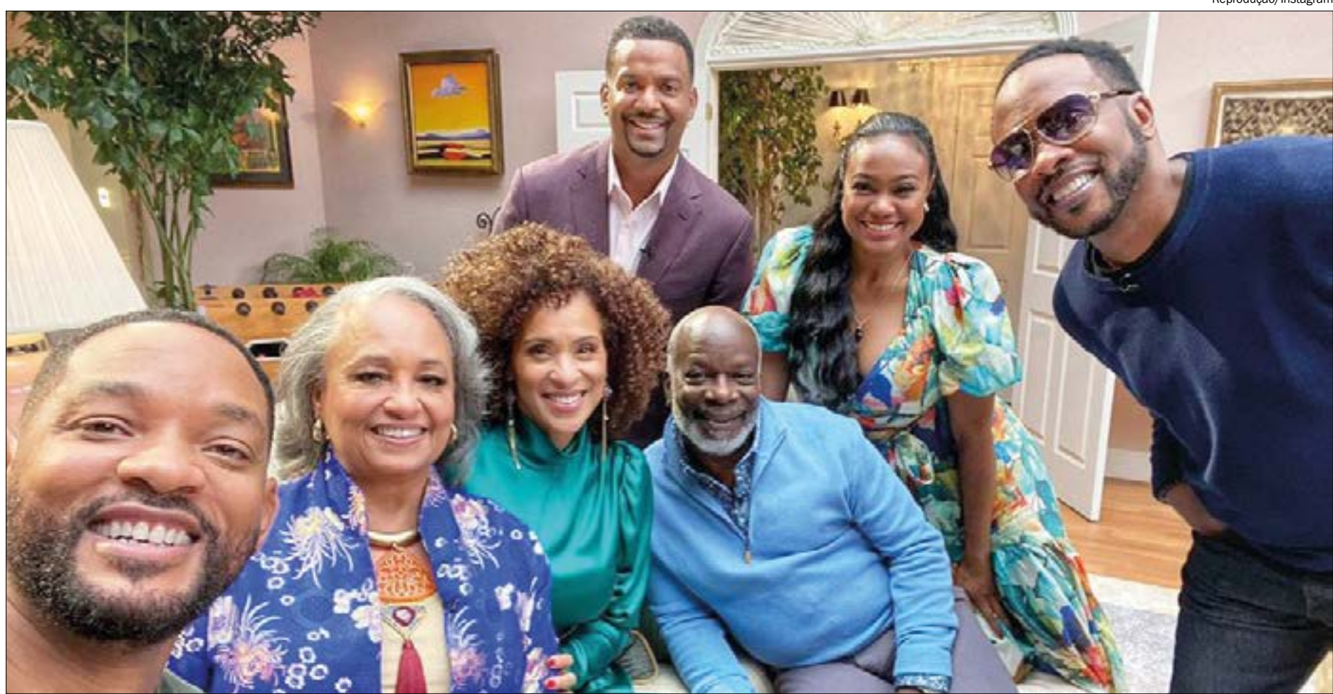
Trinta anos depois do sucesso estrondoso da série, Will reuniu todo o elenco para um especial da HBO

A série será baseada no trailer viral de Morgan Cooper no YouTu-