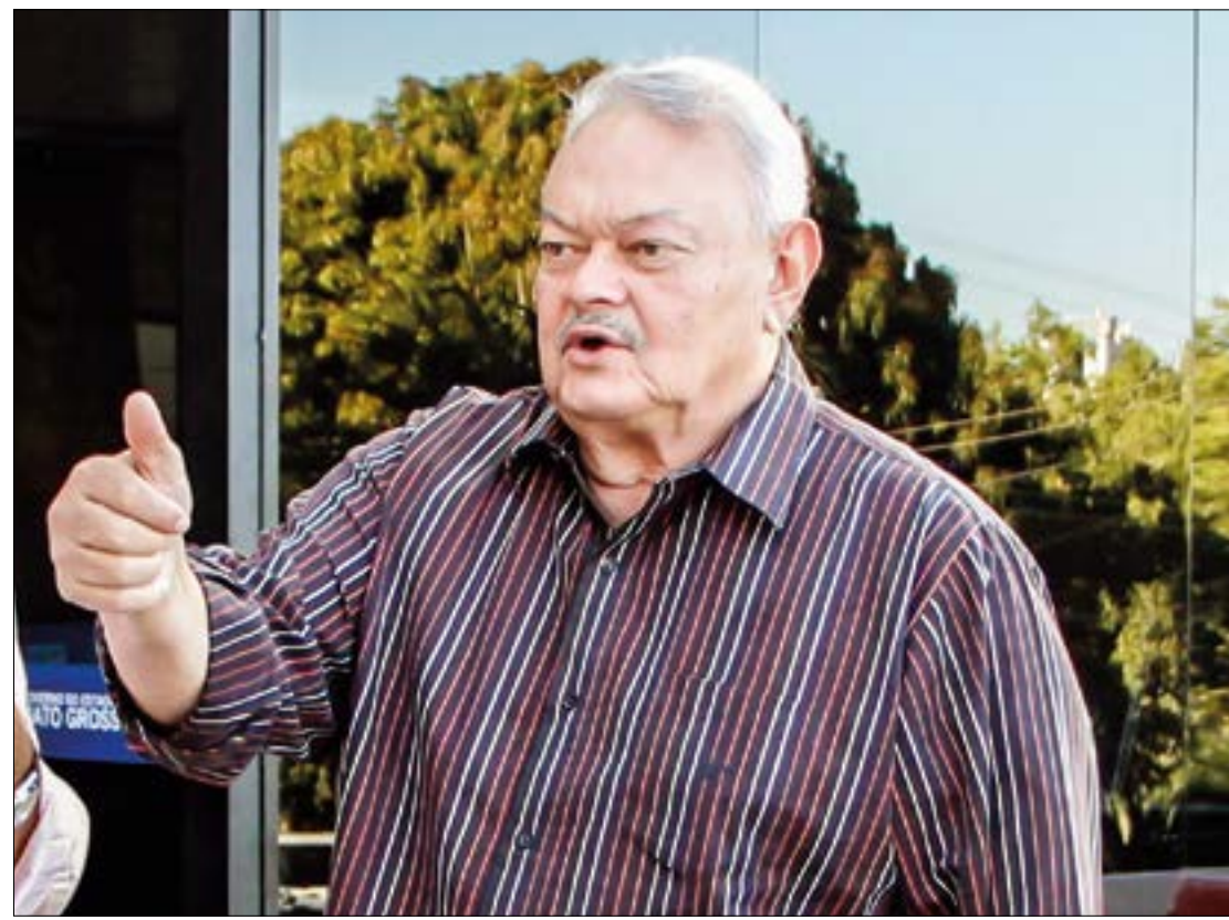
França mostrou certidão do TSE que garante que está apto a concorrer

"Tomaremos providências para que o CNJ atualize seu cadastro e evite equívocos dessa natureza. Essa é a verdade dos fatos", disse.