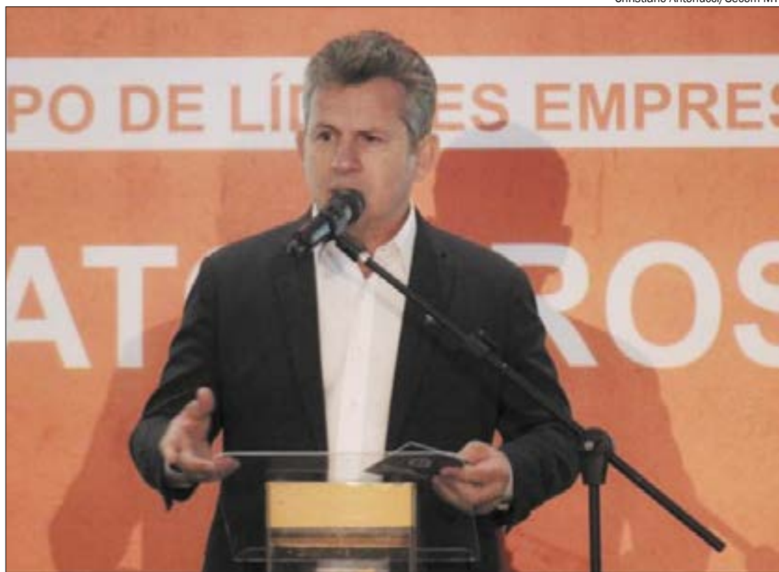
Governador irá criar mapa de ações para simplificar serviços do Estado