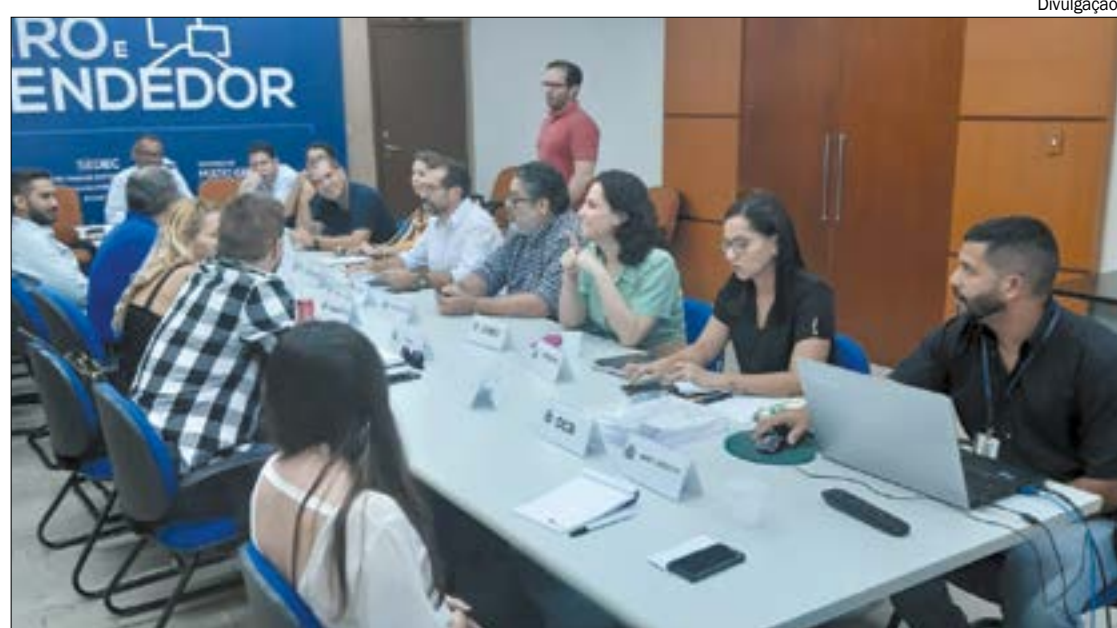
Linhas de crédito do FCO já estão disponíveis, com R$ 2,3 bi para Mato Grosso