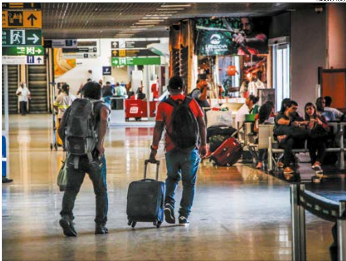
Vai viajar no feriadão? Procon-MT lista direitos do consumidor em caso de viagens de avião ou de ônibus