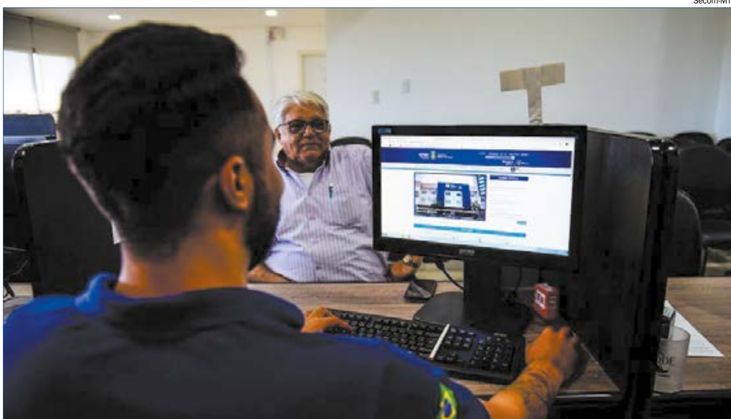
Aumento na alíquota dos servidores estaduais passará a valer no dia 1º de junho