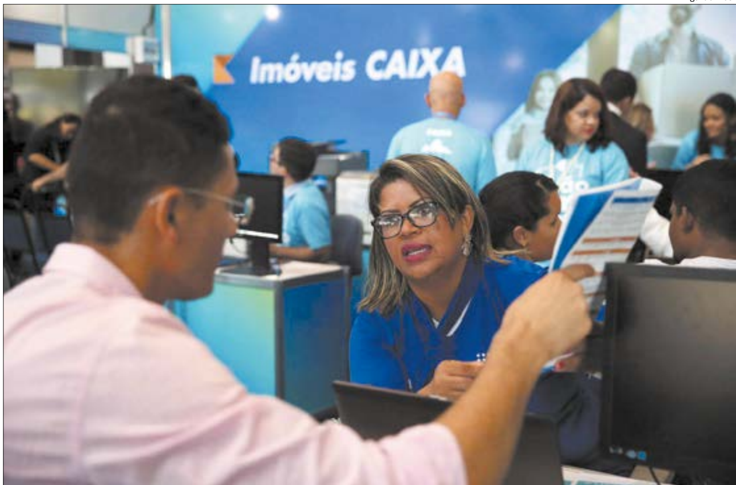
Nova linha de crédito imobiliário permite planejamento de parcelas e já vale a partir de hoje

No caso de um servidor público que adquirir um financiamento na nova modalidade, pode sentir o peso da taxa nas parcelas iniciais. Porém, como o pagamento é parcelado em até 30 anos, o valor é amortizado ao longo do tempo e as parcelas ficam mais ‘leves’.