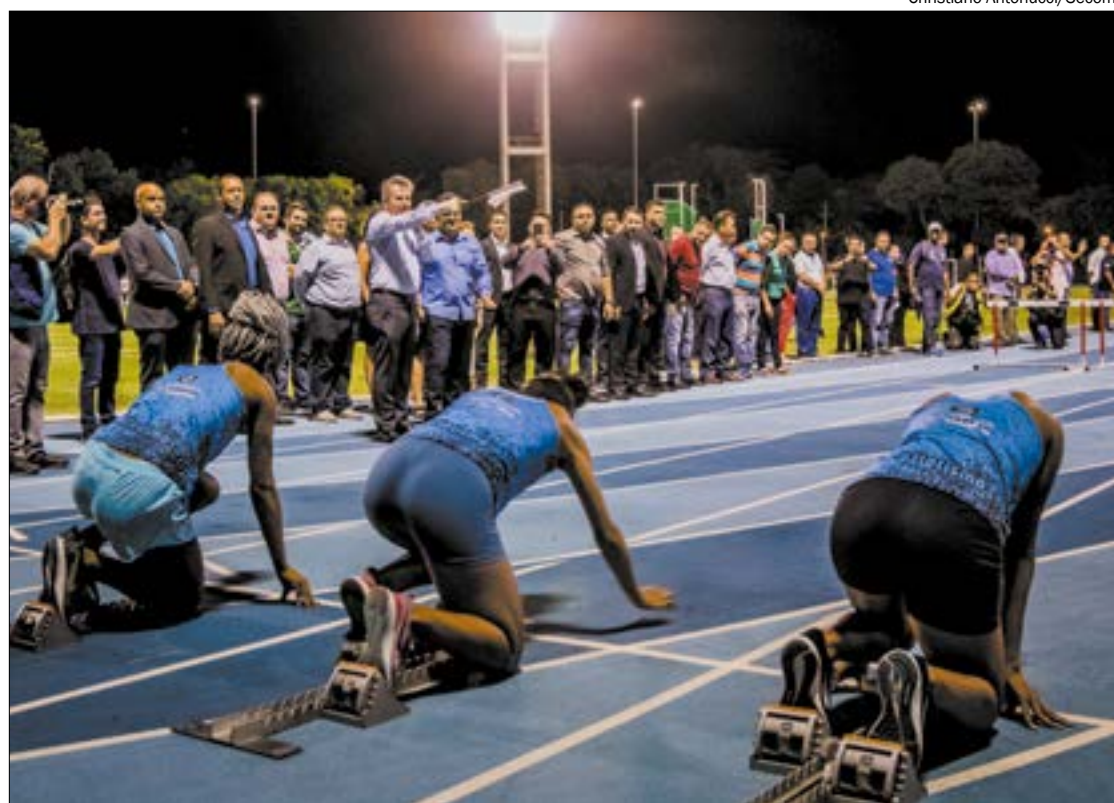
Governo investiu R$ 17,1 milhões no COT, que tem pista de atletismo com padrão internacional

Para garantir que o complexo esportivo faça parte de políticas públicas de melhorias do cenário esportivo em Mato Grosso, a Secretaria de Estado de Cultura, Esporte e Lazer (Secel) busca formas de contribuir com a gestão do espaço que hoje é fei-