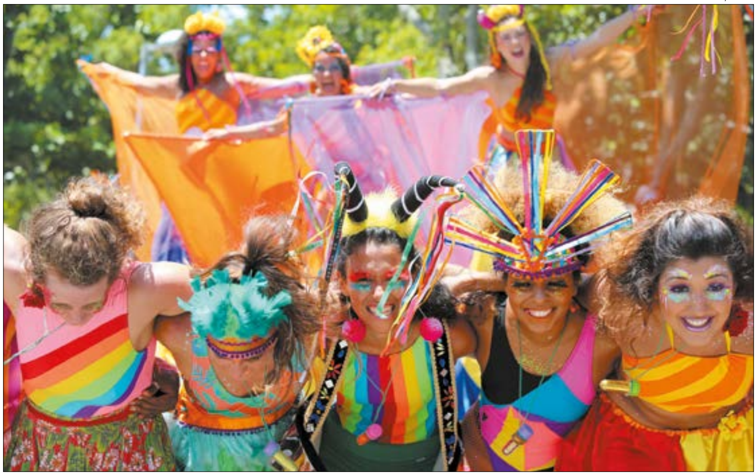
Assédio sexual é crime e não tem desculpa. Qualquer pessoa que presenciar ou for vítima pode e deve denunciar

ASSÉDIO SEXUAL - O governo federal lançou a campanha de prevenção ao assédio sexual no carnaval - "Assédio é Crime. #NãoTemDesculpa".