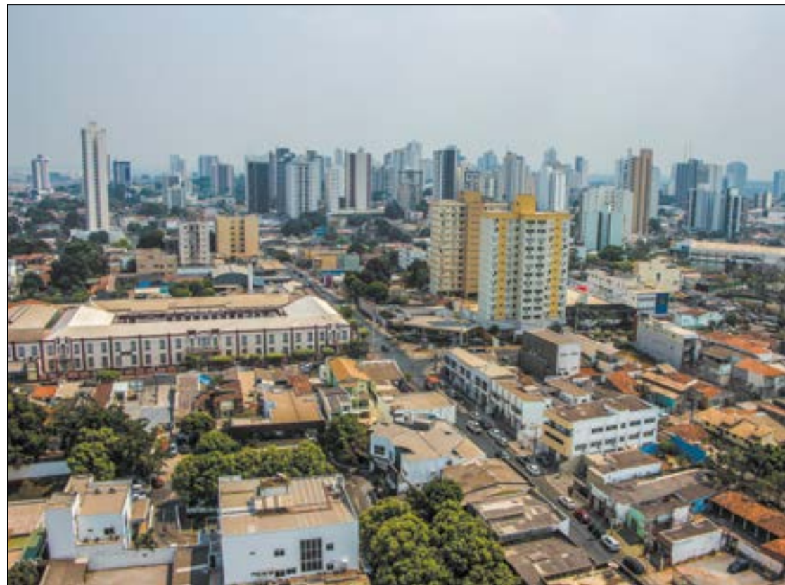
Facilidade de crédito aquece mercado imobiliário em Cuiabá

Em 2019, a Caixa emprestou R$ 90 bilhões no crédito imobiliário. Foram 473,8 mil unidades habitacionais e 760,2 mil novos empregos. Hoje a Caixa detém 70% do mercado imobiliário.