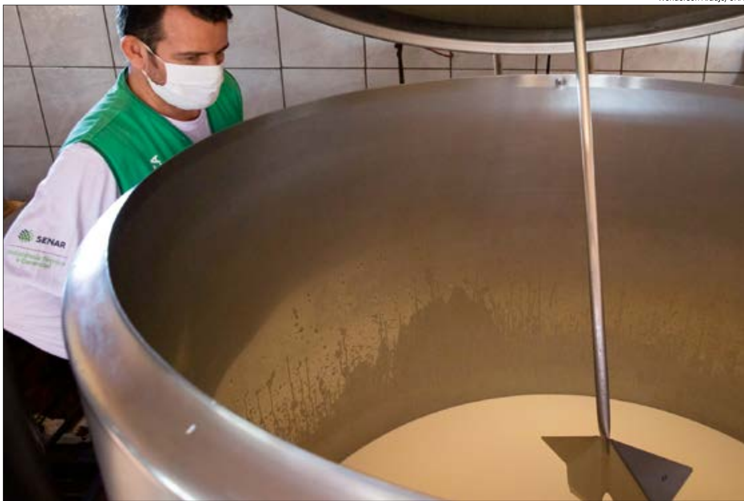
Captação de leite caiu quase 5% no último mês devido à saída de produtores

Em setembro, o custo operacional efetivo da pecuária leiteira aumentou pelo oitavo mês seguido, aponta o Cepea. A alta foi de 1,68% entre julho e agosto na média Brasil, e já chega a 7,57% no acumulado de 2020. "A alta esteve relacionada às valorizações de 13,47% dos alimentos concentrados e de 8,45% para a suplementação mineral no acumulado do ano", ressalta o Cepea.