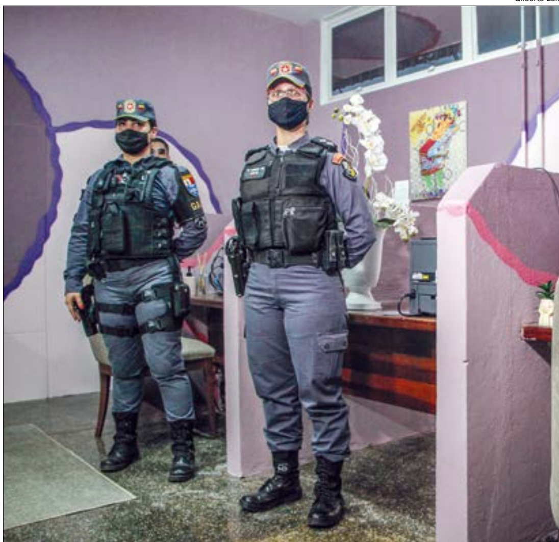
Levantamento aponta que na maioria dos estados o atendimento às mulheres trans é realizado pelas Delegacias da Mulher

“Portanto, quando consideramos gênero, assiste razão a denunciante em se acreditar que mulheres trans (identidade de gênero) poderiam ser atendidas na unidade. Entretanto, realmente não atendemos em cumprimento à Lei de criação da Especializada que bem define A NOSSA ATRIBUIÇÃO A PARTIR DO SEXO, e não da identidade de gênero. Assim é que atendemos todas as transexuais que efetivaram a mudança de sexo, bem como atendemos aos HOMENS TRANSEXUAIS, os quais mesmo não tendo a identidade de gênero como mulher, são do sexo FEMININO”, diz trecho.