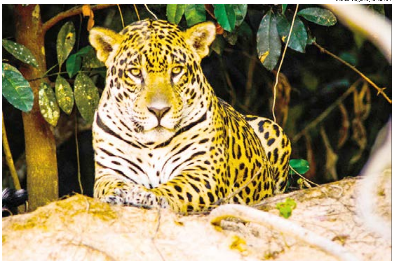
Artistas e cientistas se unem em 'super live' para salvar o Pantanal

Outra super dica é o espetáculo 'Liz', dirigido por Rodolfo García Vázquez. Sobre o que é a história? Escolha. Artistas que resistem ao poder. O poder que isola uma rainha. Uma rainha lidando com adutores. Adutores que vendem o pescoço de artistas... Escolha. Ou invente você mesmo uma significação. É um espetáculo que permita este tipo de inferência já tem algum mérito de cara.