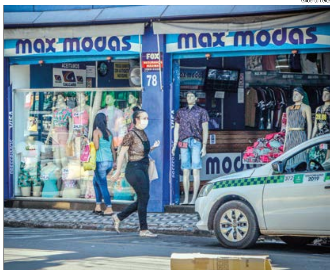
Com otimismo em alta, 75% dos empresários já pensam em fazer novas contratações

A coleta dos dados para a formatação do Índice de Confiança do Empresário do Comércio (Icec) é realizada sempre nos últimos dez dias do mês imediatamente anterior ao da divulgação da pesquisa.