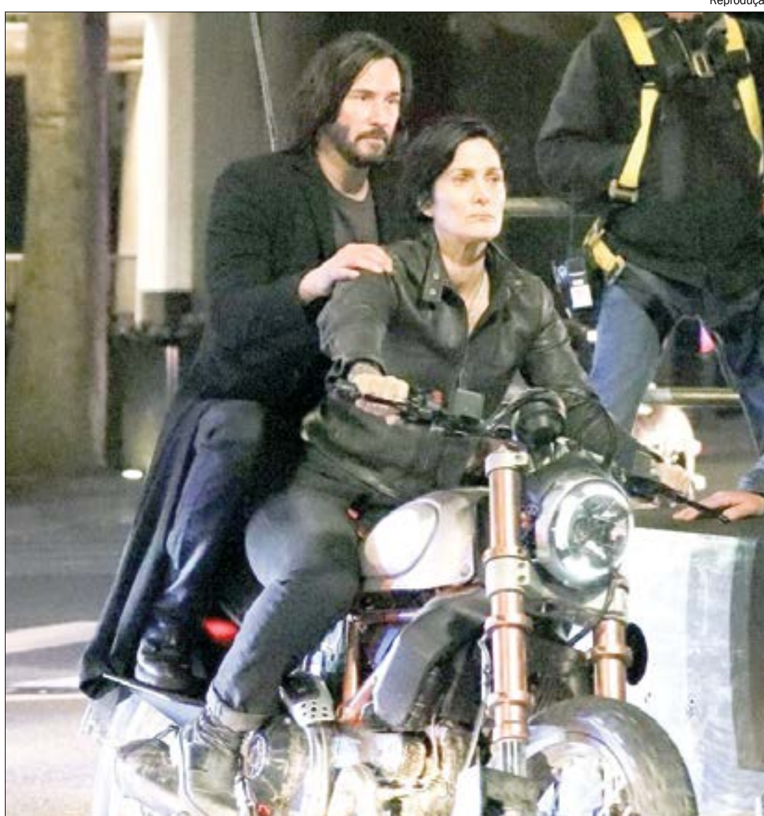
Neo e Trinity estarão de volta no novo filme da franquia e Keanu Reeves garante: não é um prólogo

Os detalhes do enredo não foram revelados, mas há algumas