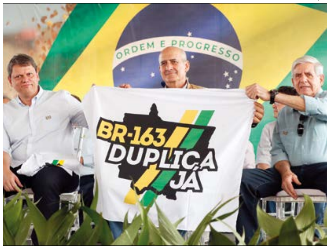
Tarcísio Freitas garantiu que terá uma solução para a duplicação da BR-163 em breve