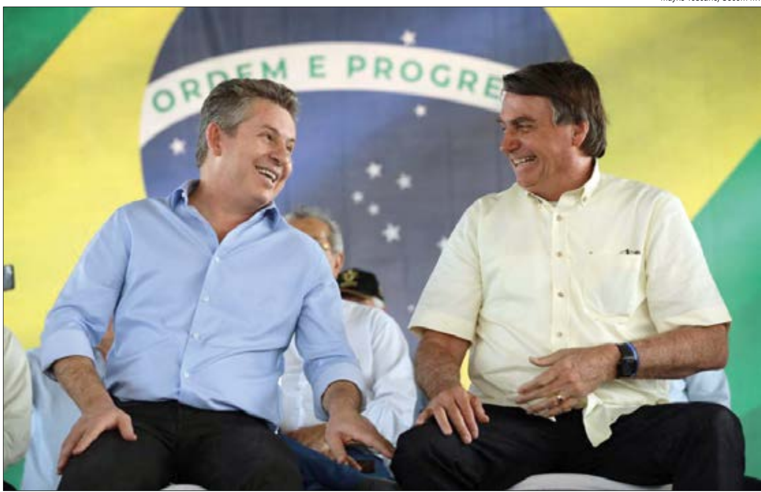
Mendes não poupou elogios a Bolsonaro durante visita oficial a Mato Grosso

“Fiquei feliz agora, quando foi falado que na