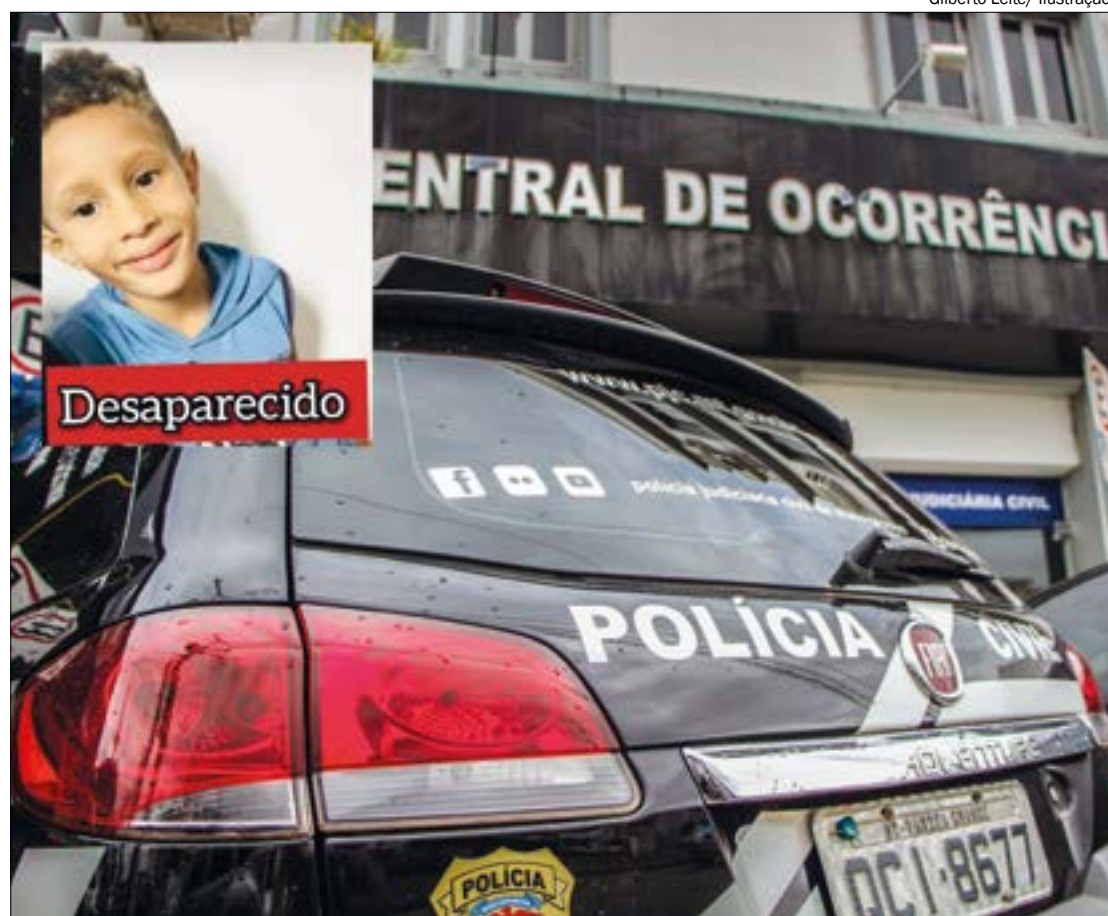
Gilberto Leite/ Ilustração