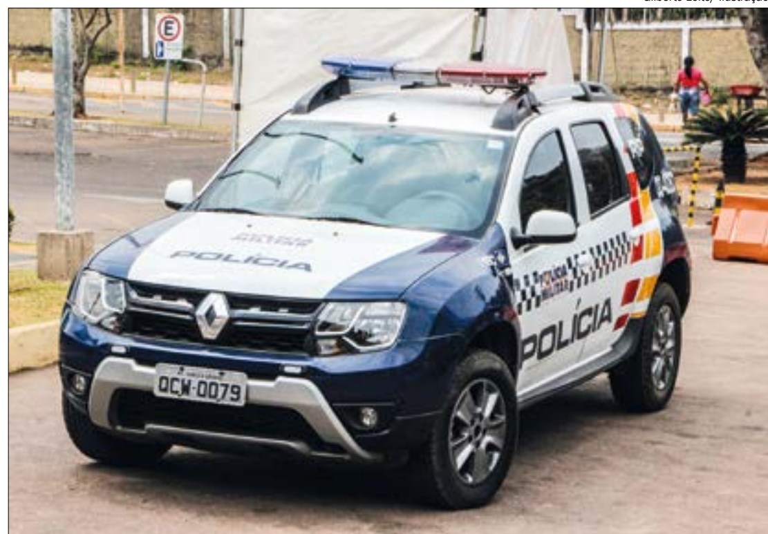
A mulher só conseguiu escapar de ser raptada pelo ex depois de ser socorrida por moradores da região

A PM chegou a realizar rondas na região, mas o suspeito não foi localizado.