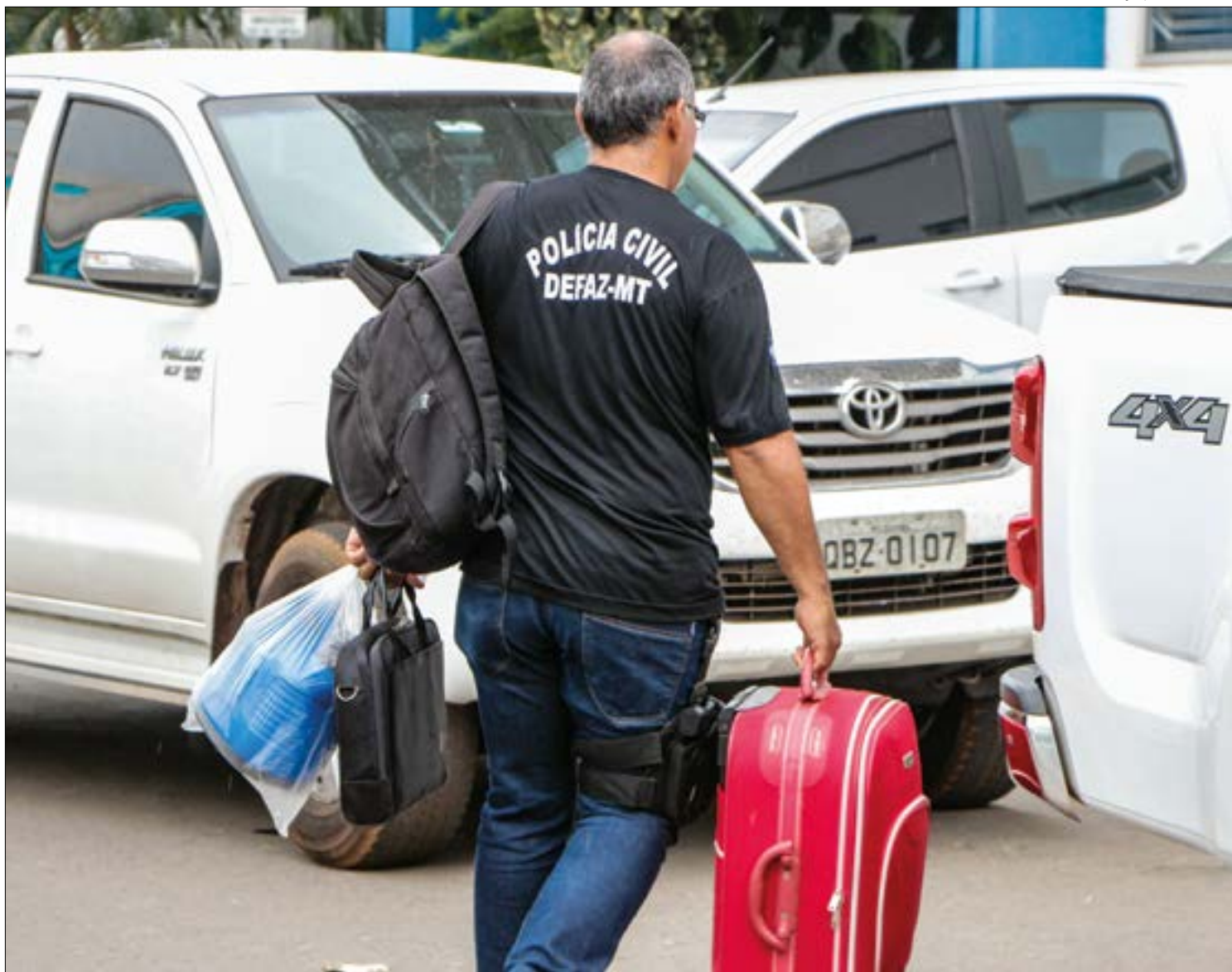
Investigação concluiu que servidores usaram empresas de fachada para desviar R$ 421 mil

“Contudo, constatou-se que nunca houve a referida prestação de serviços por parte destas empresas. Os relatórios de