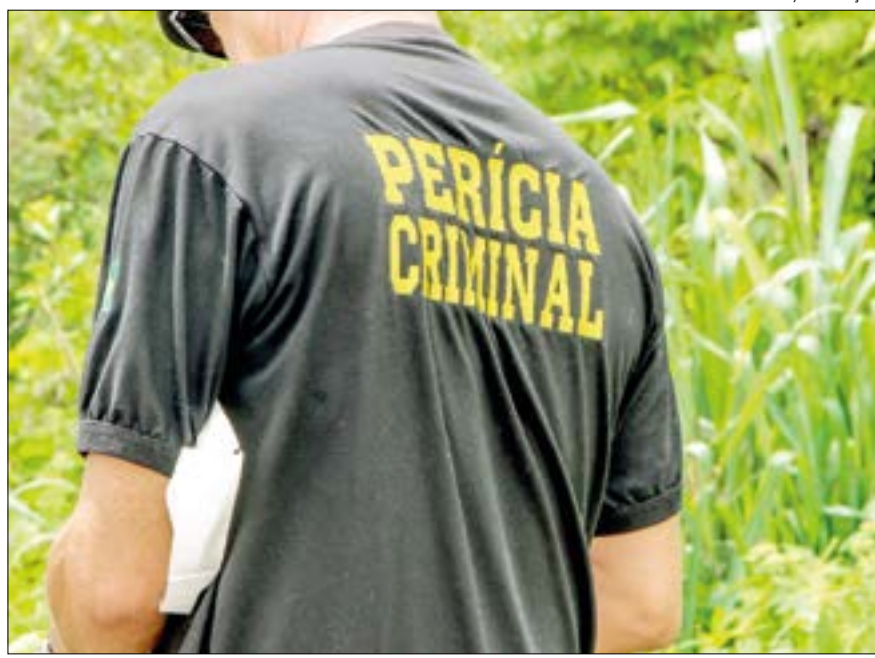
A polícia não conseguiu até o momento levantar informações se a dupla foi assassinada no local, ou apenas desovada na zona rural

A PM solicitou a presença da Delegacia de Homicídios e Proteção à Pessoa (DHPP), e também da Perícia Oficial de Identificação Técnica (Politec). A polícia não conseguiu até o momento levantar informações se a dupla