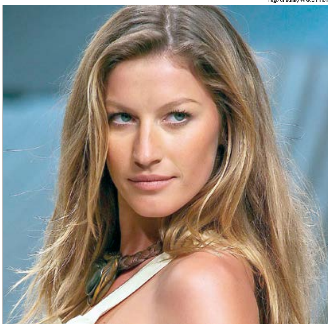
Evento que revelou Gisele Bündchen está com seleção aberta em todo o país

*Estagiário sob supervisão do jornalista Tarley Carvalho