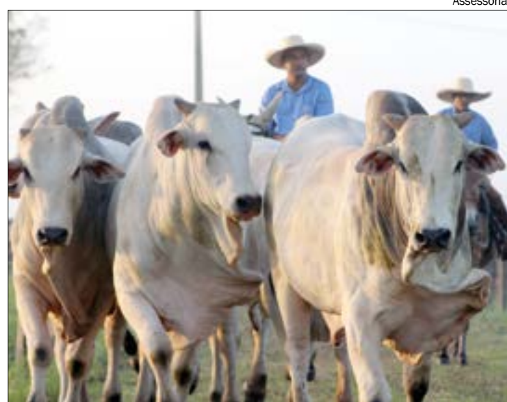
Empresa é responsável pela genética de mais de 40% dos reprodutores nelore do país

A pecuária brasileira vive um de seus melhores momentos em 2020 com recordes de exportação. De acordo com o Cepea (Centro de Estudos Avançados em Economia Aplicada da USP), as intensas exportações de carne e a oferta restrita de animais para abate mantêm as médias mensais da arroba em patamares recordes no mercado nacional. Otimistas com o atual cenário e visando ampliar a participação do mercado nacional e internacional, empresas nacionais têm investido no crescimento do plantel e na diversifica-