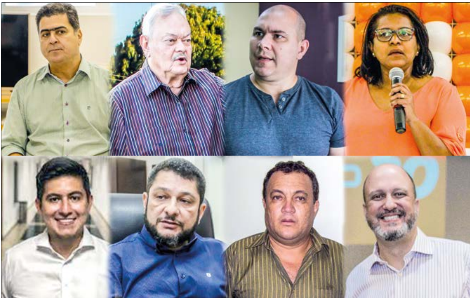
Estadão Mato Grosso