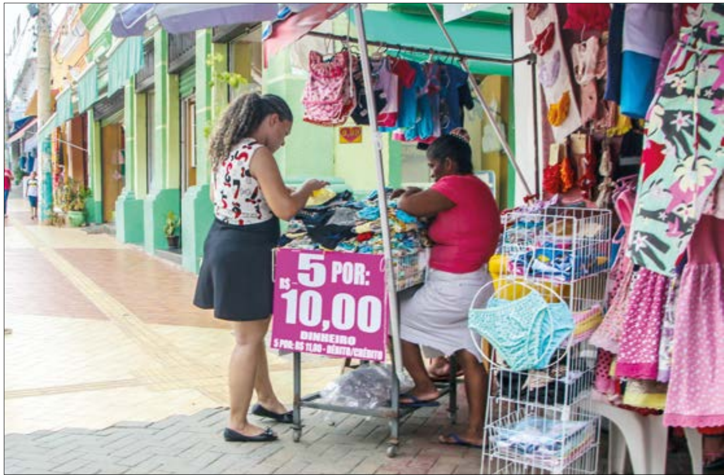
Segundo dados da Cielo, Mato Grosso foi um dos poucos estados a registrar alta nas vendas durante a Semana Brasil

Mato Grosso foi um dos poucos estados do país e o único da região Centro-Oeste a registrar alta nas vendas. Dados do Índice Cielo de Varejo Ampliado (ICVA), que monitora 1,5 milhão de varejistas credenciados à empresa de meios de pa-