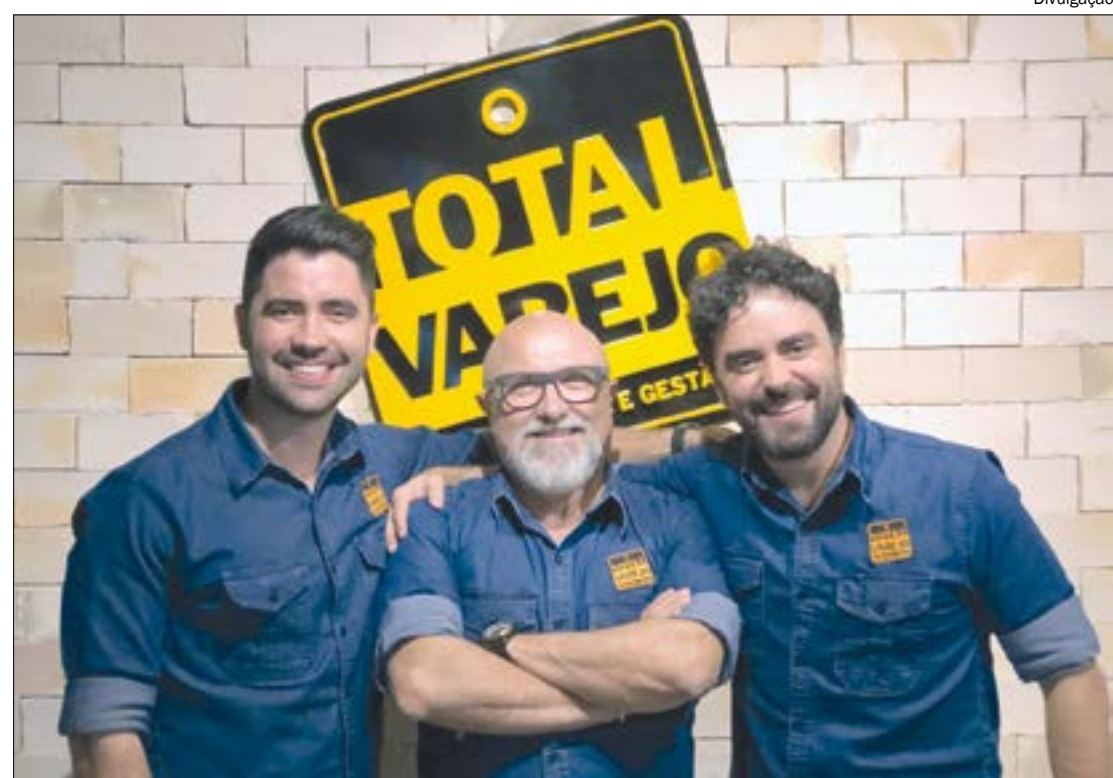
Por vencer a premiação nacional, designers vão apresentar o projeto em evento mundial

Renewable Energy Agency (IRENA) e está entre os 20 países líderes em capacidade instalada. Apesar desse crescimento, a fonte solar ainda representa menos de 2% da matriz elétrica brasileira, segundo a Agência Nacional de Energia Elétrica (Aneel).