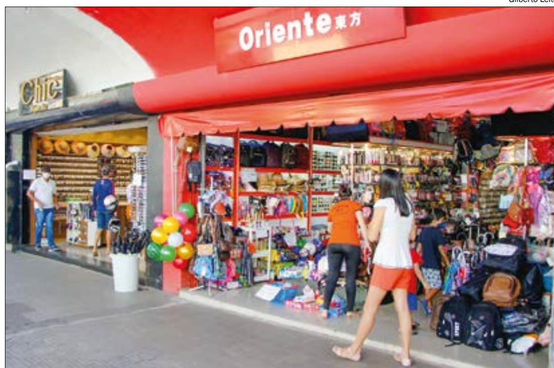
Segundo o IBGE, empresas pequenas são as que mais sentem o impacto negativo da crise

EMPREGOS - Quase 9 em cada dez empresas (86,4% ou cerca de 2,7 milhões de companhias) mantiveram o quadro de funcionários ao final da primeira quinzena de agosto em relação à quinzena anterior. Apenas 8,7% (277 mil empresas) indicaram redução no quadro, sendo que 146 mil (52,6%) diminuíram em até 25% seu pessoal, com destaque para as empresas de menor porte, onde 140 mil (51,6%) reduziram nessa faixa de corte.