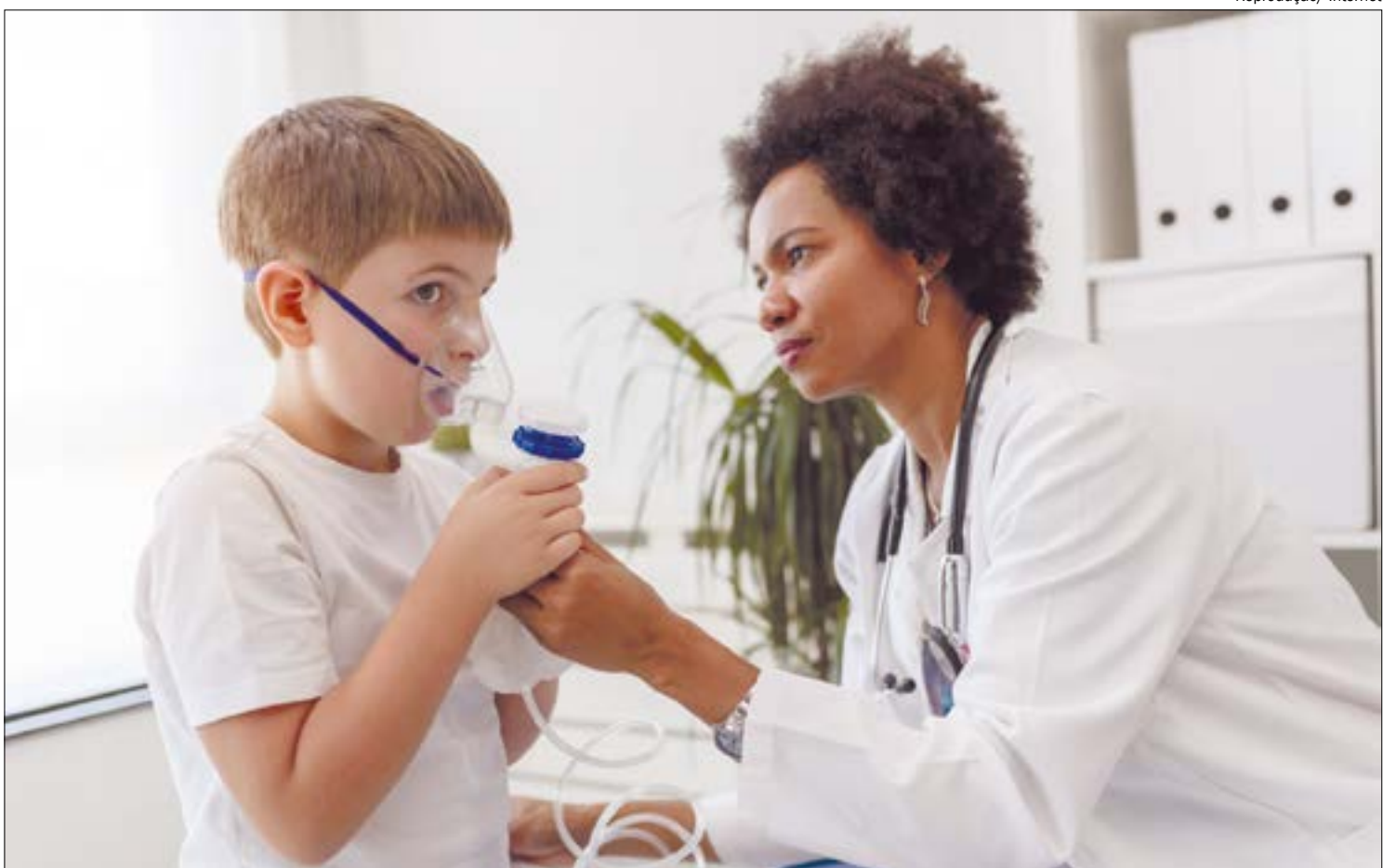
A lavagem nasal recomendada pela pneumologista pode ser feita com métodos caseiros ou produtos encontrados em farmácias

“Estamos vivendo em um ambiente com baixa umidade do ar. É como se estivéssemos sendo sugados por ele o tempo todo. Observe como está sua pele, as cotículas das unhas e as vias respiratórias, estão todas secas.