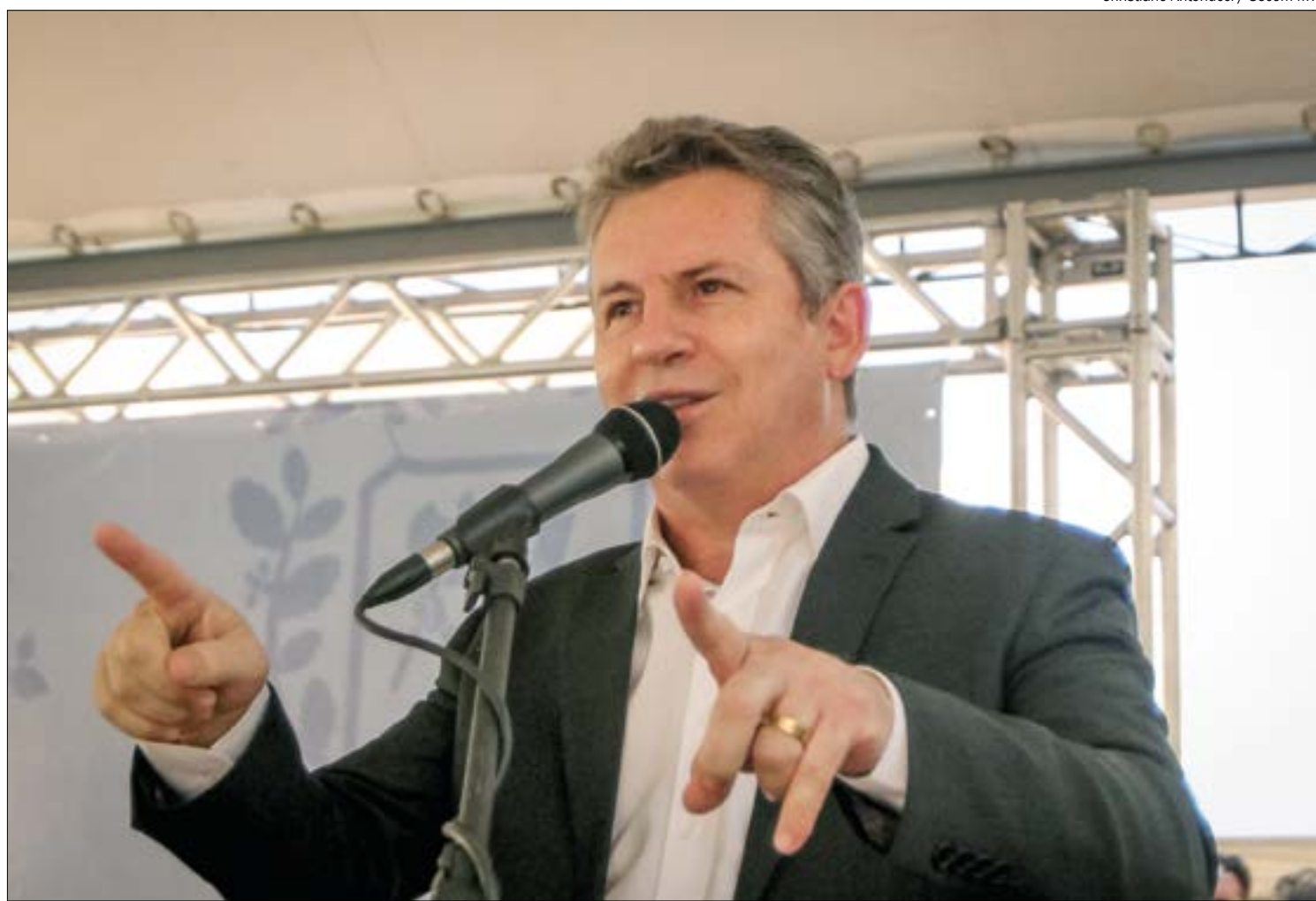
Mendes destaca que Exército tem sido grande parceiro do Estado no combate às queimadas

Mendes lembrou que incêndios estão ocorrendo em todo o mundo, como agora na Califórnia, na Austrália e na Europa em 2019. "Essa guerra de imagem internacional