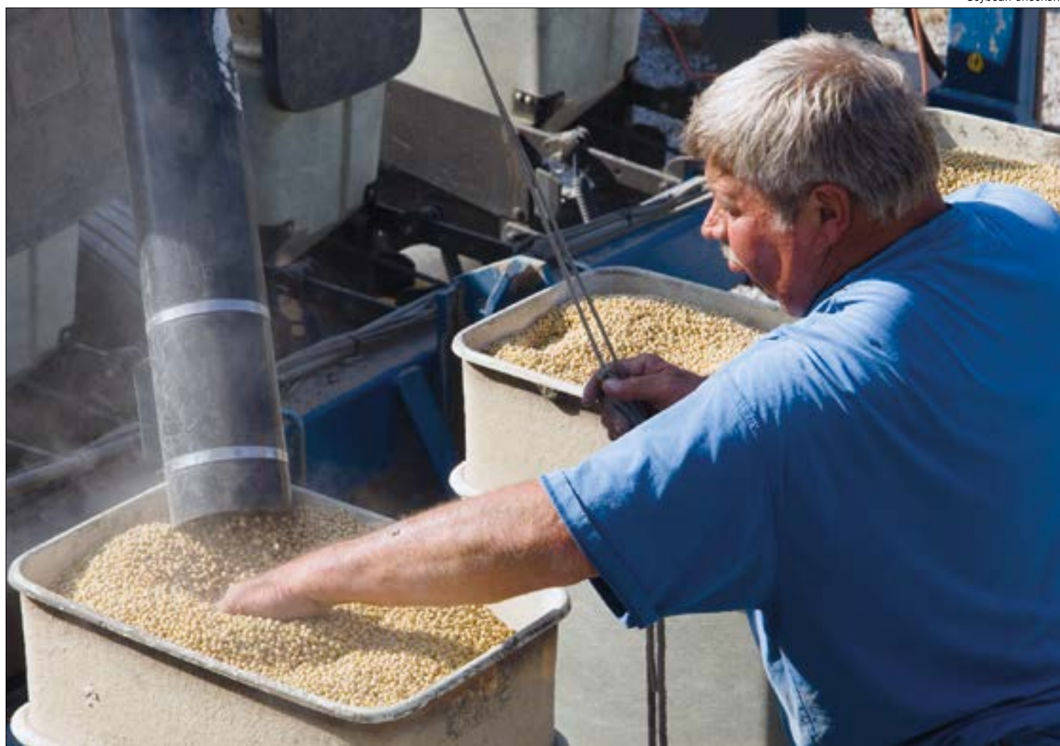
Atraso nas chuvas aumenta incertezas para produtores que costumam adiantar o plantio da soja

“Acredita-se que com o início do cultivo da soja em setembro/outubro possa ocorrer melhor previsibilidade do rendimento da cultura, visto que as expectativas quanto ao clima para o desen-