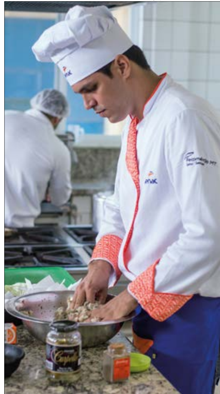
Indicador da FGV aponta tendência de retomada das contratações na indústria e no comércio