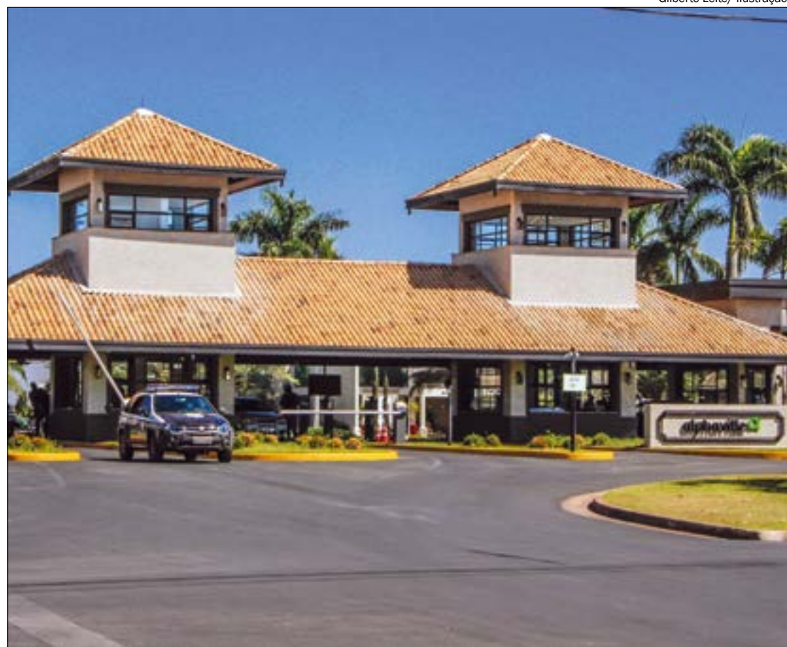
Gilberto Leite/ Ilustração

O legista contratado pela família Cestari também foi alvo da CPI do narcotráfico. O legista passou a ser investigado após emitir laudos que, segundo a comissão, teriam tido erros propositalmente, para favorecer o crime organizado.