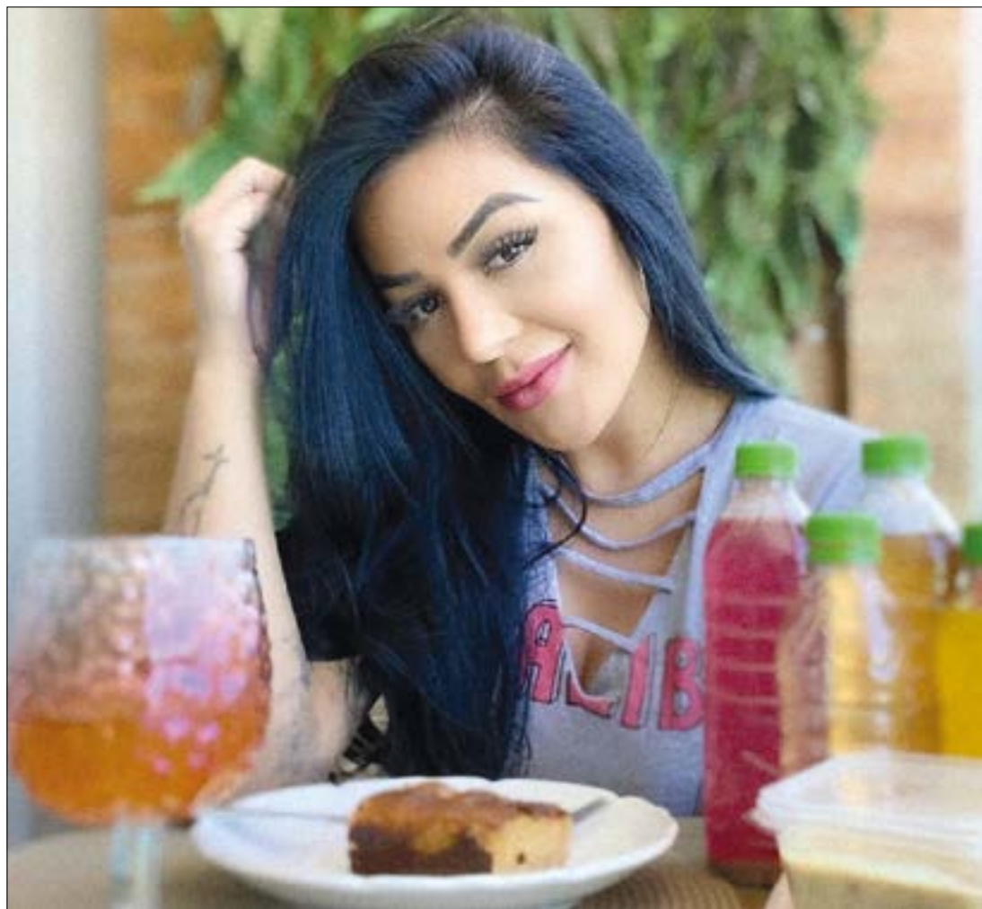
A digital influencer Carla Bora sempre no agito