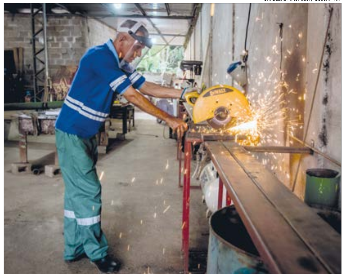
510 novos postos de trabalho foram gerados desde janeiro de 2019 em obras na Segurança Pública