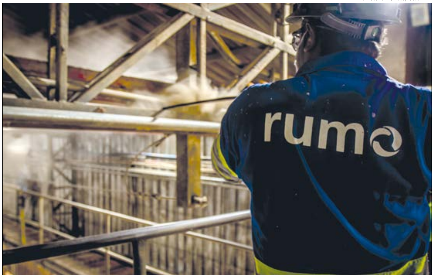
A empresa Rumo Logística deverá executar as obras, que ainda não têm seu traçado definido

Caso o problema da logística seja resolvido, Mato Grosso terá mais um fator favorável para atrair novas indústrias ao estado. “Além disso, já temos aqui o gasoduto. É inimaginável que tenhamos um gasoduto na Baixada Cuiabana, energia barata para as indústrias. Eu não entendo como Mato