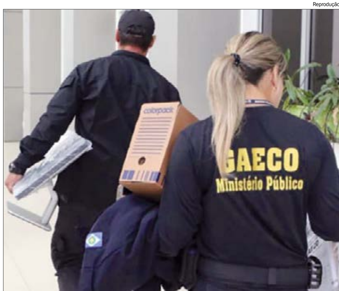
De acordo com o Gaeco, as fraudes na concessão dos incentivos ocorreram no ano de 2014