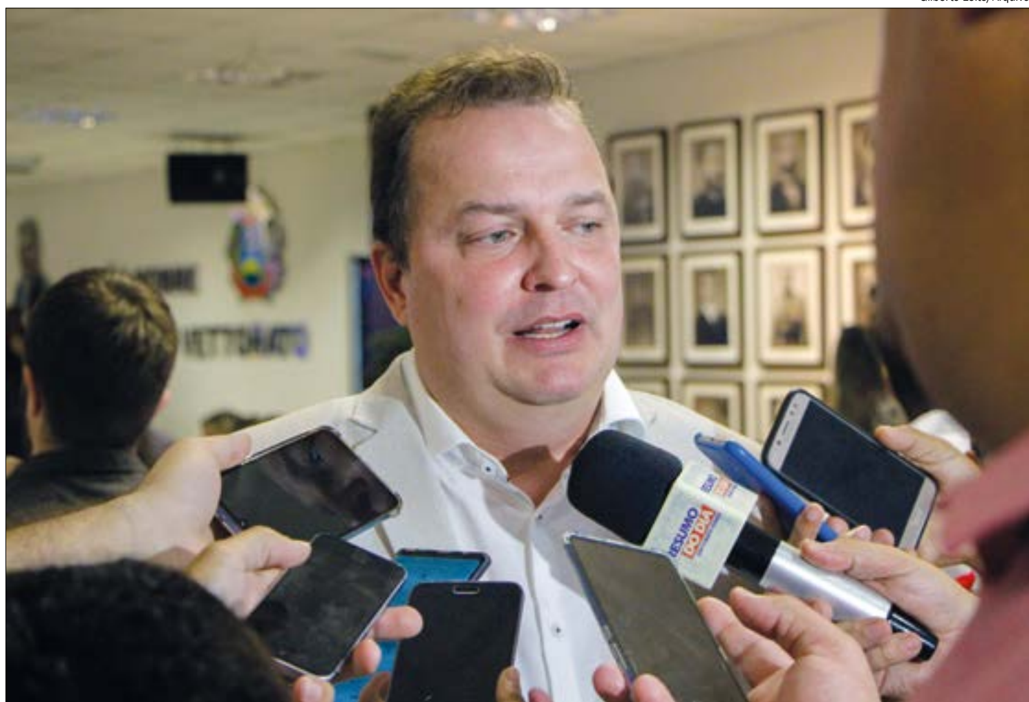
Com a divisão dos aliados, Max decidiu não assumir o projeto de última hora e vai se dedicar a eleger prefeitos do PSB

Agora, como presidente estadual do PSB, precisa se dedicar ao fortalecimento do partido nas eleições municipais, e terá bastante trabalho: ele prevê lançar 59 candidatos a