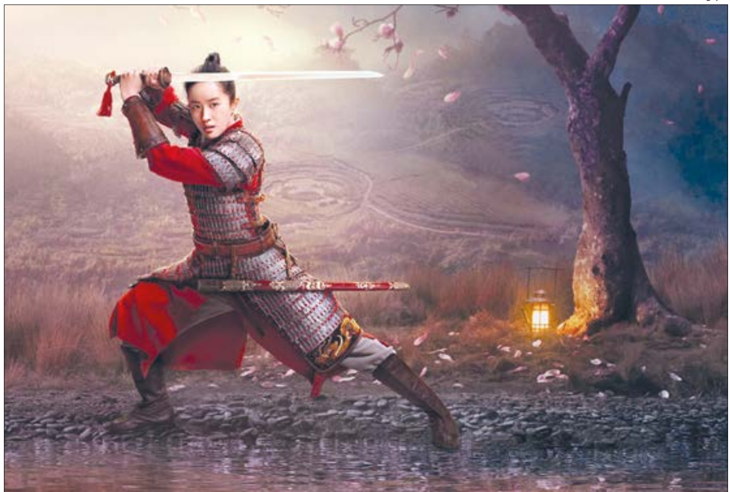
Uma das produções mais caras da 'Casa do Mickey', Mulan divide os críticos e o retorno do investimento ainda é incerto

Mulan é o primeiro filme live-action da Disney dirigido por uma mulher, e também é a produção de maior orçamento da casa do Mickey Mouse.