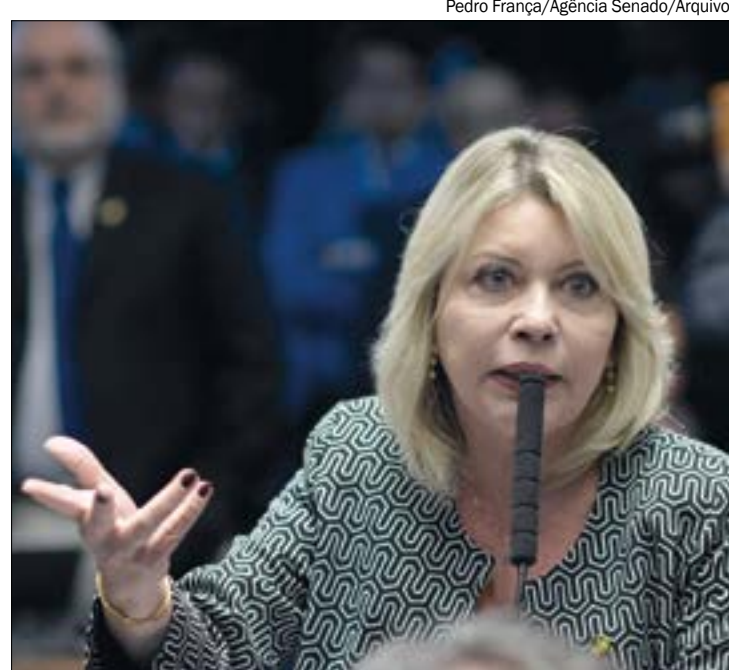
Apesar de ter um nome do próprio partido na disputa, Selma diz que ainda não decidiu quem irá apoiar

"Eu quero dizer a você, você que está me procurando, mandando mensagens e me procura nas redes sociais para perguntar quem eu vou apoiar para o Senado,