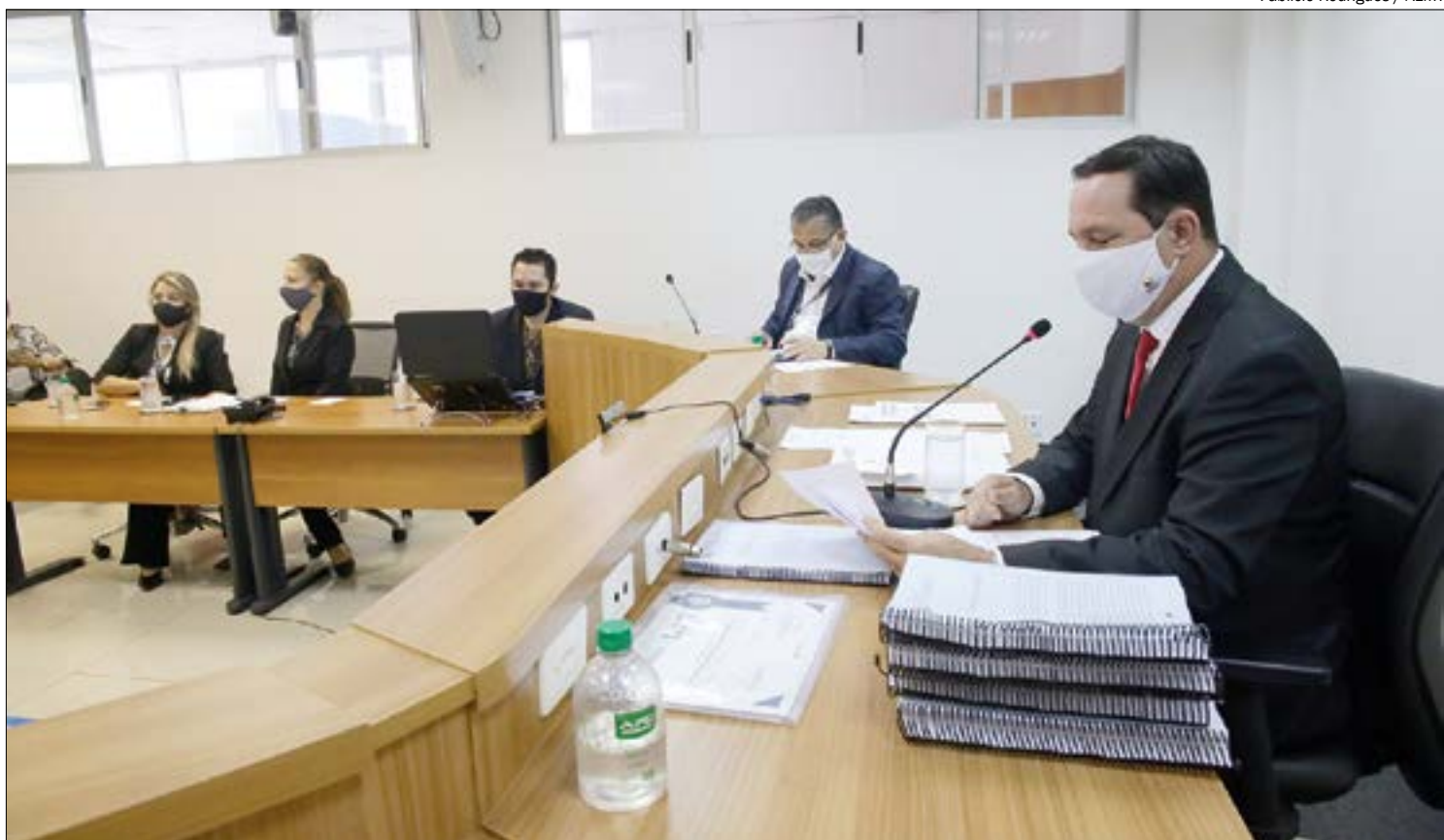
Comissão da AL ouviu especialistas de todo o país para elaborar recomendações para retomada das aulas presenciais

O Parlamento estadual também deverá votar diversos projetos de lei estabelecendo marcos legais para a retomada das aulas com segurança para alunos e professores, além da criação de uma platafor-