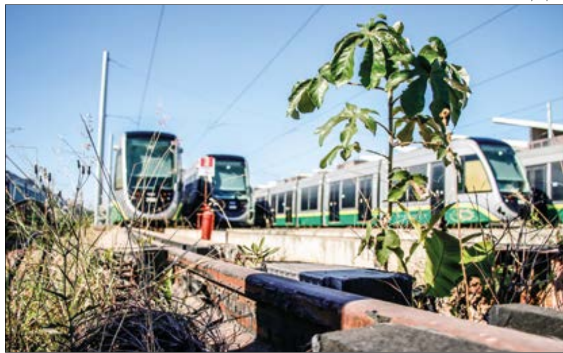
MP quer que Estado corrija os prejuízos ambientais do VLT e pague indenização de R$ 3,6 milhões

tro de Controle foi doado pela Empresa Brasileira de Infraestrutura Aeroportuária (Infraero) e fica localizado próximo ao Aeroporto de Várzea Grande. Com 132.676 m 2 , a área abriga recursos naturais considerados relevantes, pois se trata de uma área úmida, com diversas nascentes de água e vegetação típica de Cerrado.