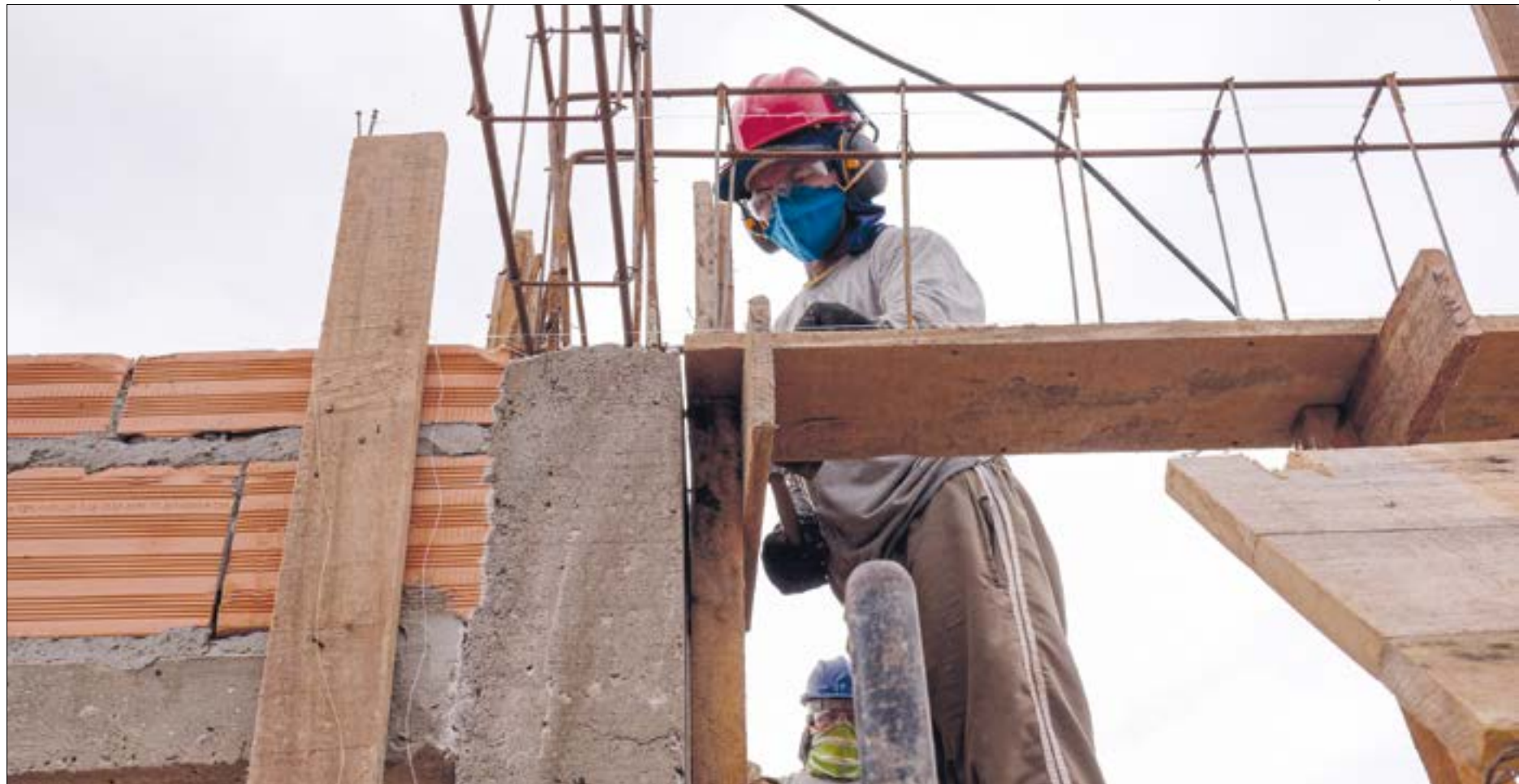
Reajustes nos preços dos insumos têm superado as projeções da indústria da construção civil que afirma não encontrar razões para aumentos

De acordo com o representante, a variação de aumento no preço do aço no acumulado deste ano está