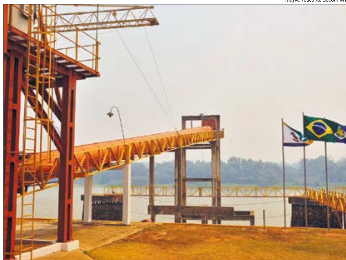
Estrutura do Porto de Cáceres estava desativada há mais de 10 anos e foi reformada para voltar à operação

A estrutura estava desativada há pouco mais de 10 anos, e será reativada após as melhorias implantadas por meio de uma cooperação entre a Companhia Mato-grossense de Mineração (Metamat), a Associação Pró-Hidrovia do Rio Paraguai (APH), para a retomada das atividades.