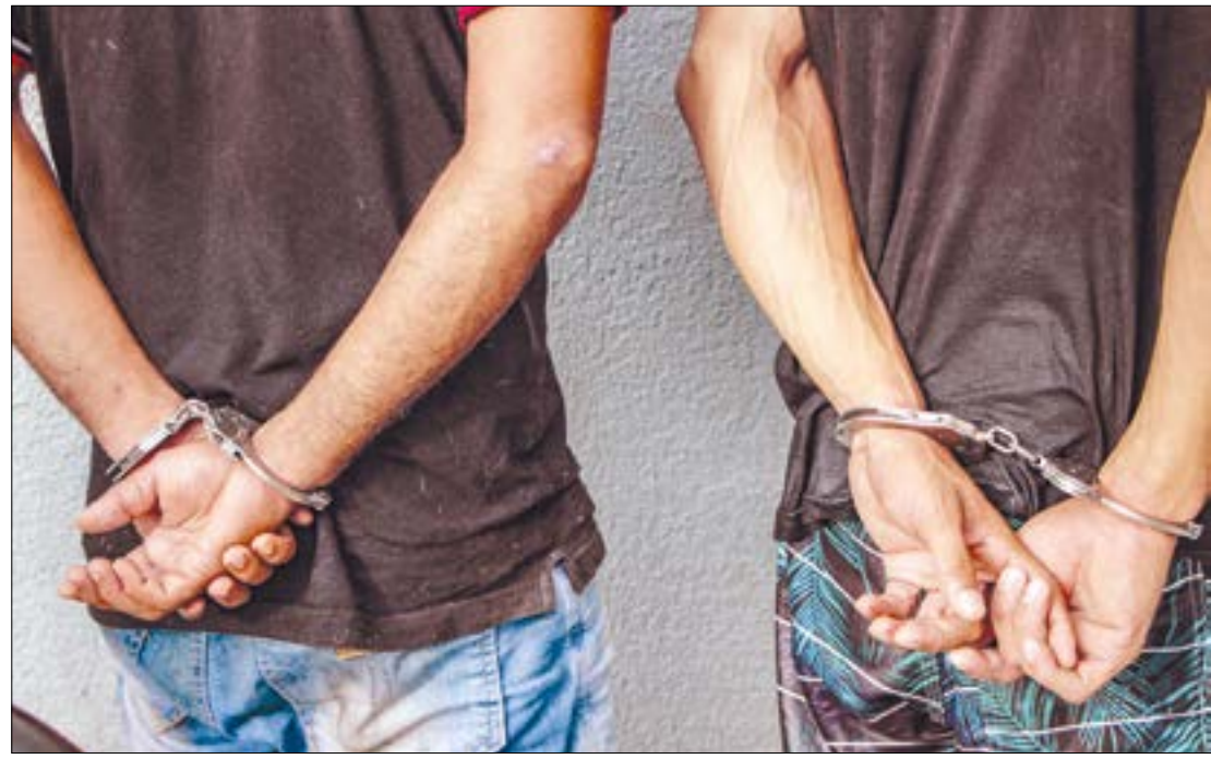
Os investigadores conseguiram imagens de segurança e localizaram o veículo utilizado e o paradeiro de dois suspeitos