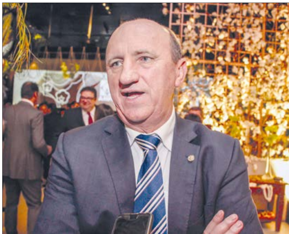
Geller era acusado de abuso de poder econômico por exceder o limite de gastos na campanha de 2018