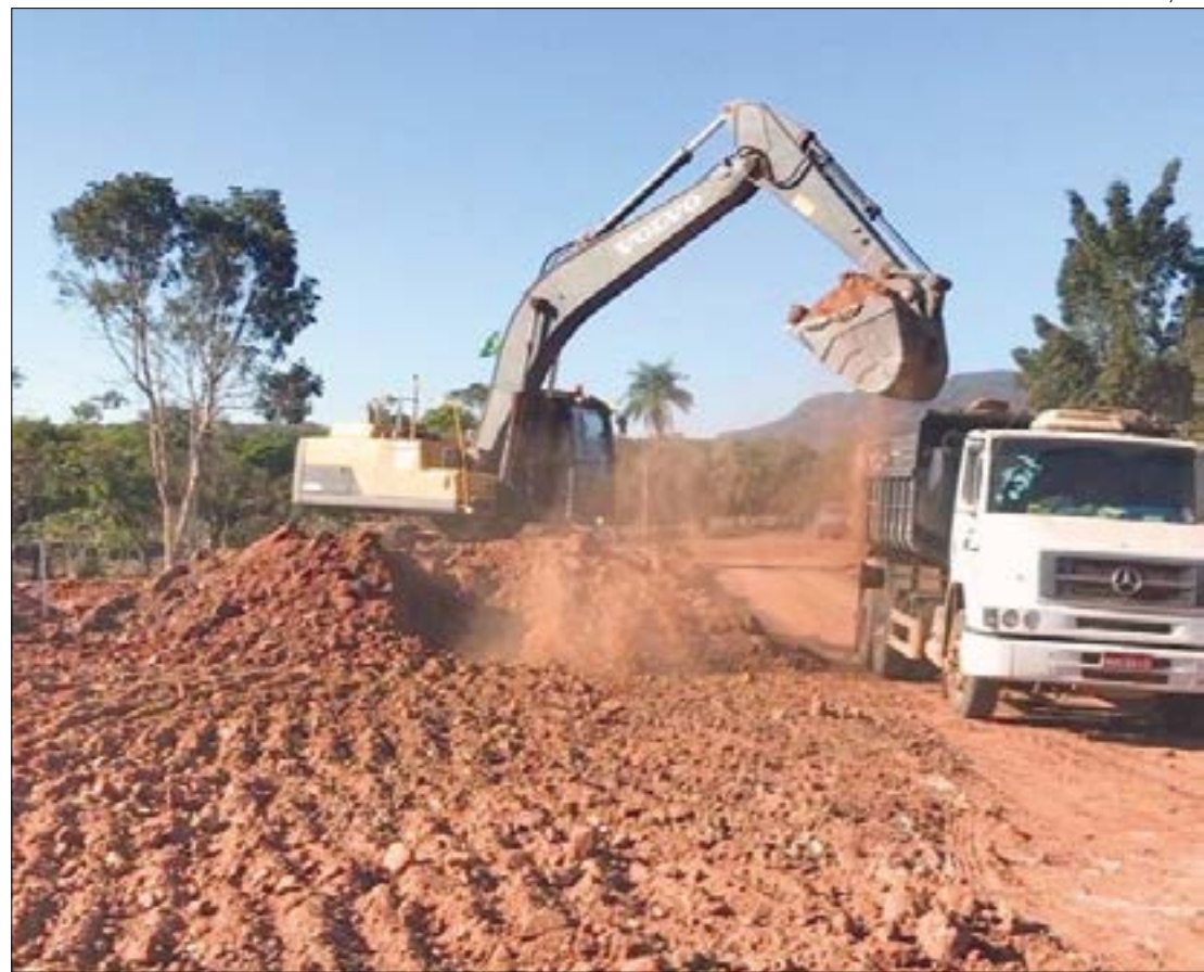
A MT-343 é considerada uma importante rota de escoamento de produtos do agronegócio