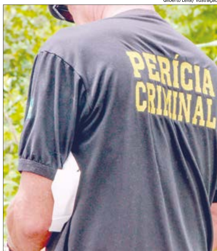
Gilberto Leite/ Ilustração

O suspeito foi encaminhado à delegacia juntamente com a vítima e sua mãe, para que fosse confeccionado o boletim de ocorrência. A Polícia Civil investiga a denúncia.