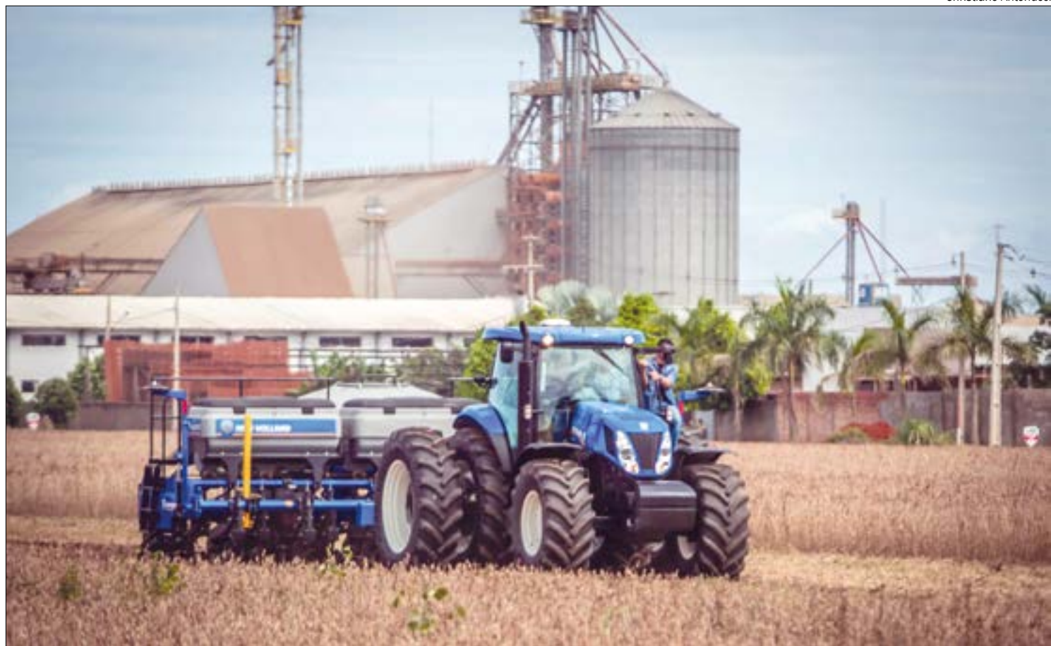
A falta de soja para o mercado interno fez com que representantes das esmagadoras locais pedissem ajuda do Legislativo

O projeto de lei do deputado foi apresentado no 1º semestre deste ano, mas teve suas discussões suspensas a pedido do autor. A retomada da pauta gera desconforto na cadeia produtiva, uma vez que as exportações de commodities – isenta de impostos – são mais lucrativas do que a comercialização interna.