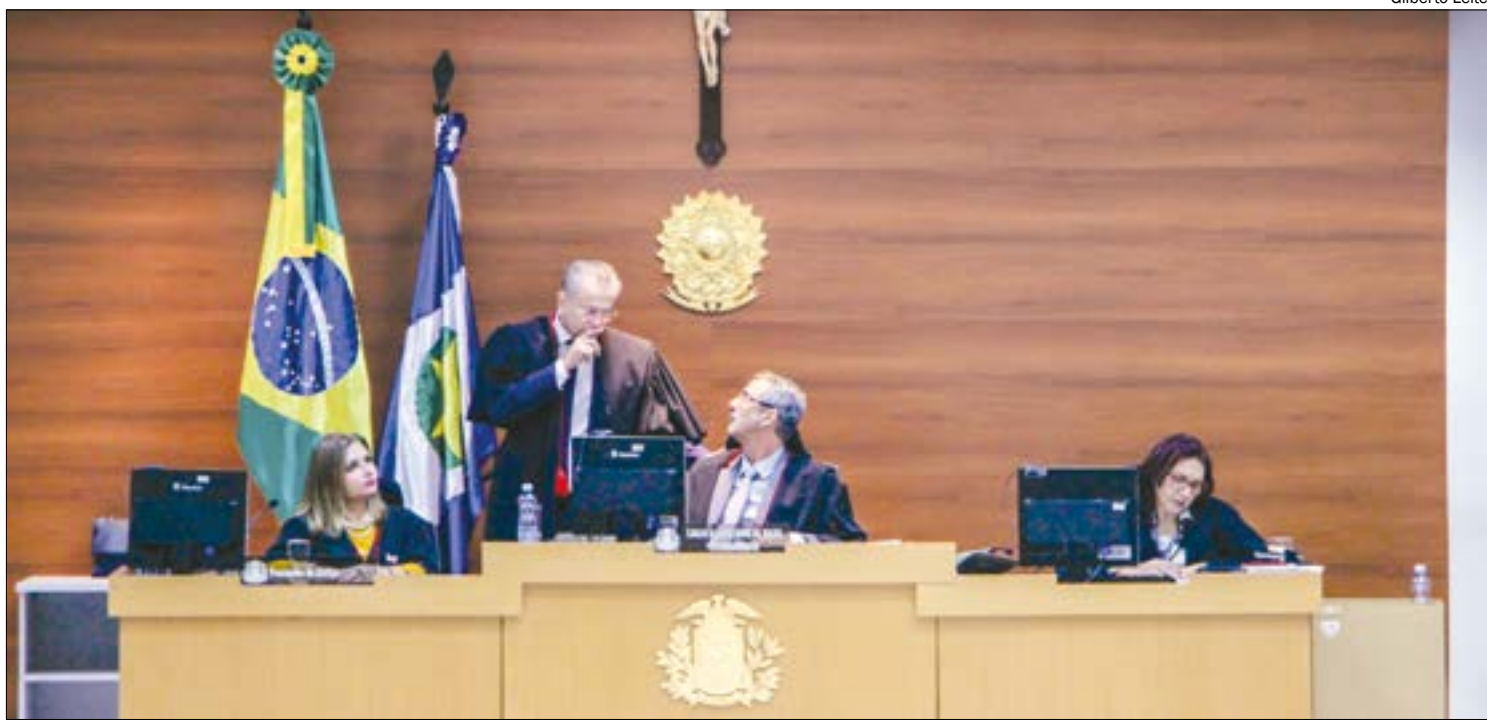
As duas vagas de desembargador destinadas ao Quinto Constitucional já atraem interesse de 27 juristas

O processo para a criação das novas vagas começou em fevereiro deste ano, quando o TJMT aprovou o anteprojeto, que foi aprovado pela Assembleia Legislativa de Mato Grosso (ALMT) com 18 votos favoráveis, três contrários e duas ausências. Após a nomeação dos novos ma-