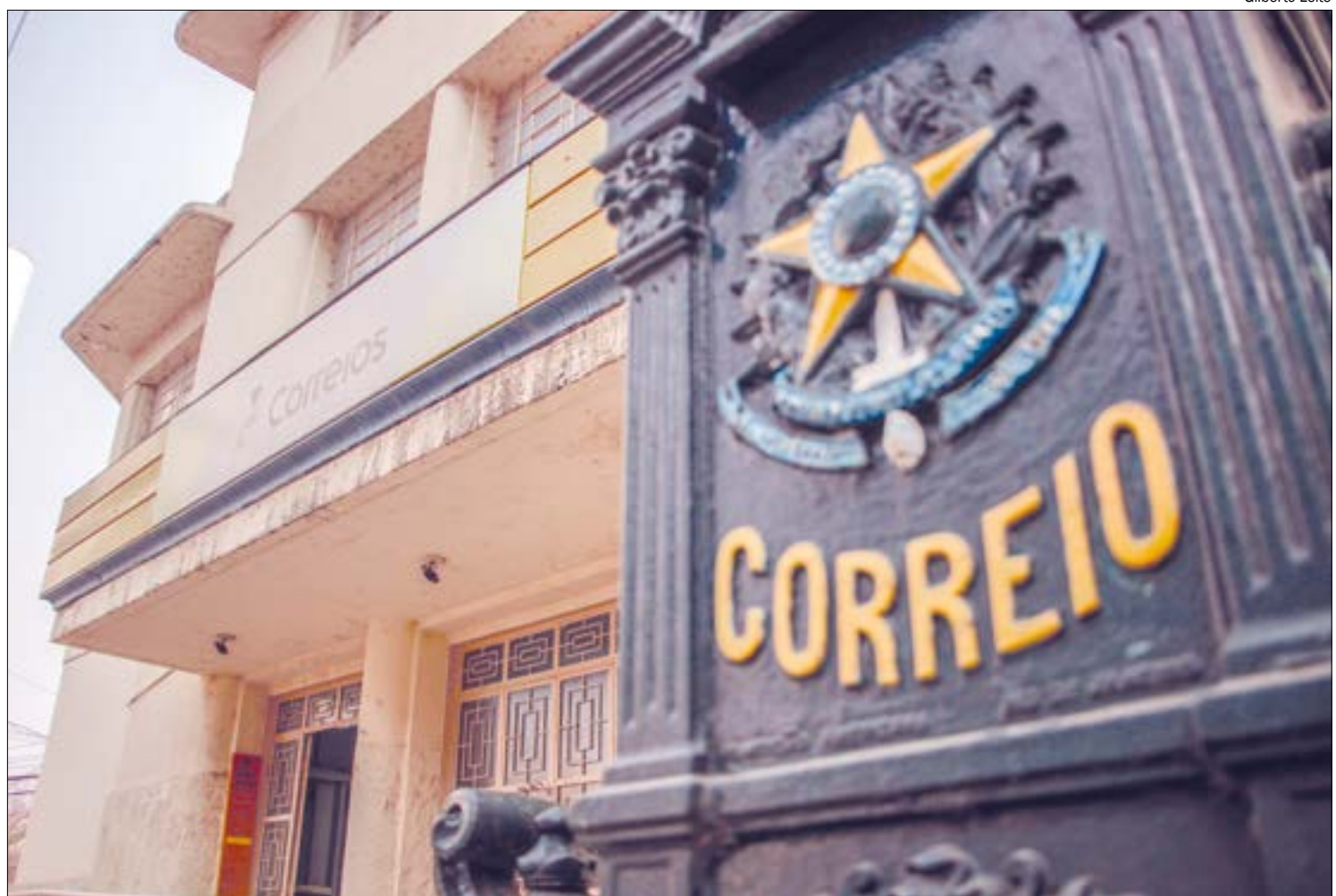
Os trabalhadores cobram apenas a manutenção dos direitos já conquistados em um acordo coletivo que teria vigência até 2021

"O governo Bolsonaro defende a privatização do Correios, mas a população precisa saber que isso não vai melhorar o serviço postal no país. Se conseguirmos a aprovação das cláusulas do acordo coletivo, como o