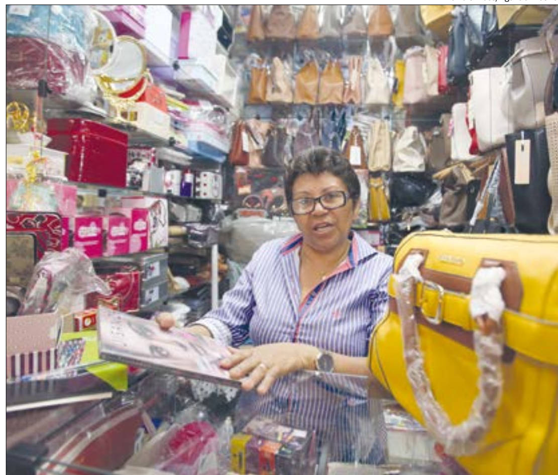
Segunda etapa do programa receberá aporte adicional de R$ 12 bilhões

mil no ano) e empresas de pequeno porte (faturamento até R$ 4,8 milhões no ano), além dos profissionais liberais. O programa empresta até 30% da receita bruta do ano anterior, com taxa de juros máxima igual à Selic (atualmente em 2% ao ano) mais 1,25% ao ano. O prazo de pagamento é de 36 meses e carência de oito meses. É possível acompanhar o recurso sendo liberado pelo Emprestômetro do Portal do Empreendedor [www.portaldoeempreendedor.gov.br], onde também poderão ser consultadas as instituições habilitadas.