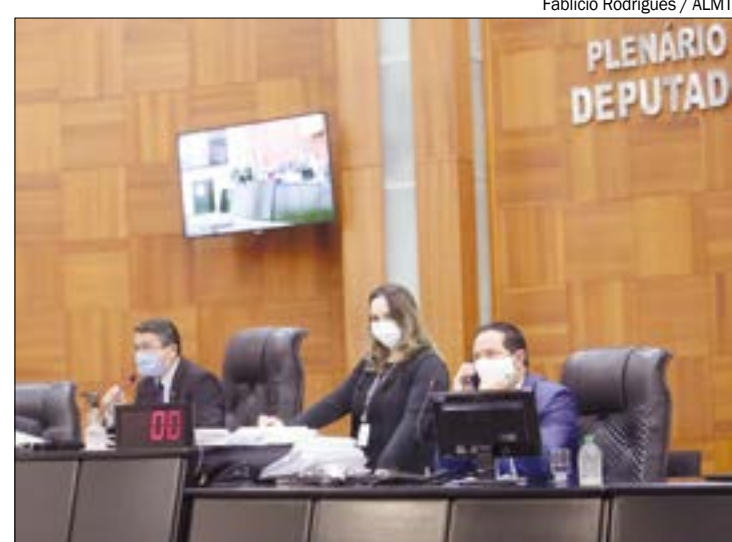
Deputados aprovaram criação do Regime de Previdência Complementar para servidores civis e militares

"Tem R$ 52 milhões do governo federal para ajudar as pessoas que estão aí sem poder fazer eventos, sem poder trabalhar. É um dinheiro que vai para as prefeituras", disse.