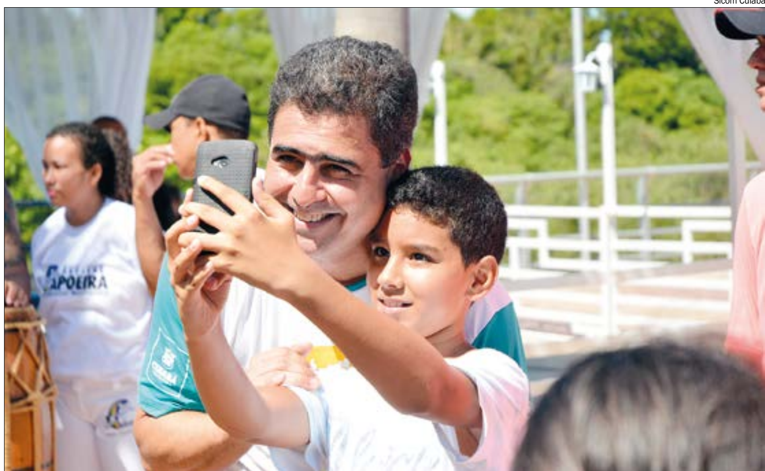
Pesquisa aponta vantagem de 24% de Emanuel Pinheiro sobre o segundo colocado, o ex-prefeito Roberto França

Apesar de liderar as intenções, o prefeito também é o mais rejeitado pela população, com 19,1%, França tem 15,3% de rejeição, enquanto Abilio tem 13,3%. Os indecisos somaram 53,1% e os que não souberam ou preferiram não responder 7,6%. A margem de erro é de 3% para mais ou para menos.