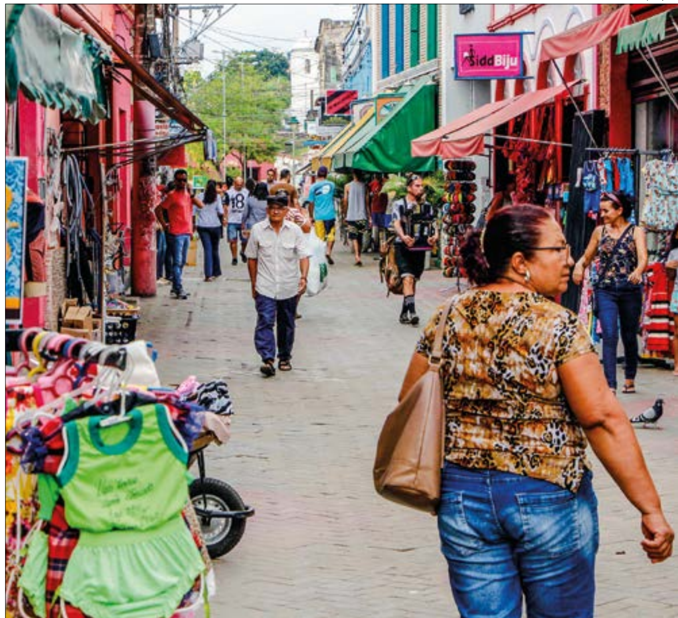
Confiança do empresário do comércio tem forte crescimento em agosto e se aproxima da zona de satisfação