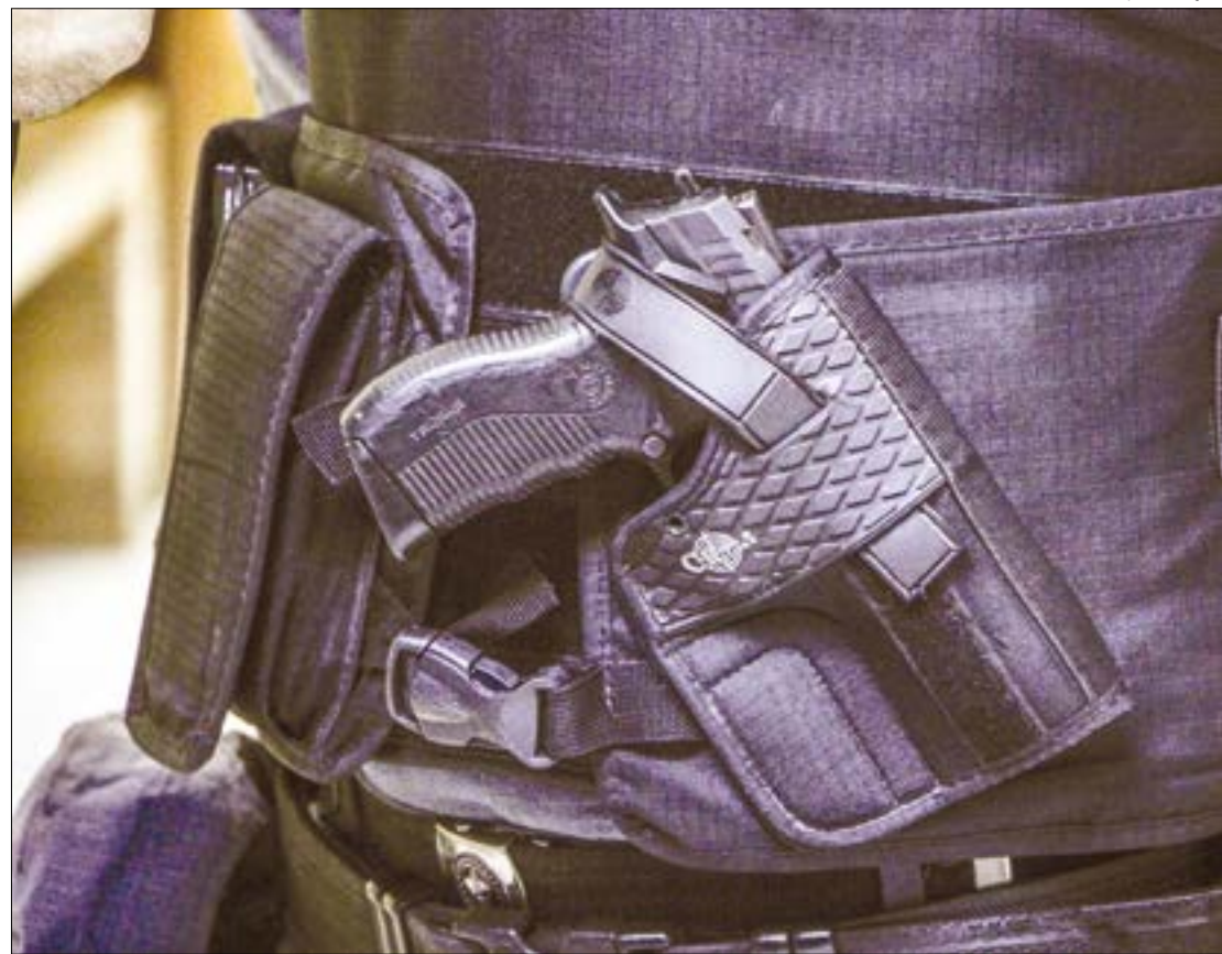
A dupla se apresentou como policiais federais e alegou que iria revistar o automóvel do casal em busca de irregularidades