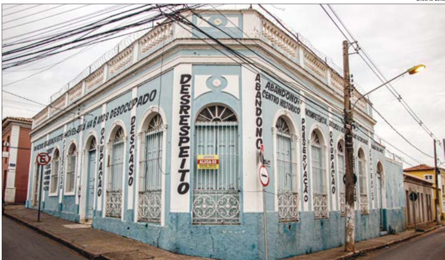
Dos quase 100 prédios históricos abandonados, 43 correm risco de desabar; a região é malvista pela população

"Nós lutamos por um projeto que possa viabilizar a reestruturação dos imóveis. Muitos empresários não possuem condição própria de fazer a reforma do seu prédio, e assim, os casarões acabam sendo