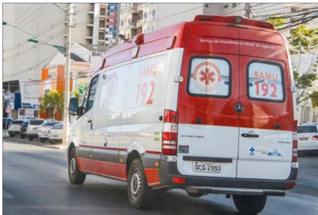
Após prestar os primeiros socorros, a vítima foi encaminhada ao hospital, mas horas depois do acidente acabou morrendo

Perícia Oficial de Identificação Técnica (Politec) e também da Polícia Civil, que investiga o caso. Após os trabalhos de local de crime, os peritos encaminharam o cadáver ao Instituto Médico Legal (IML), onde será possível fazer a identificação.