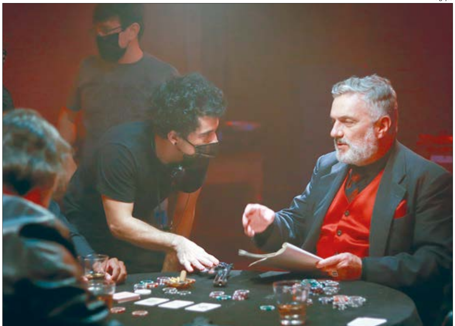
Gravação na pandemia aconteceu em tempo recorde e sob rígidos protocolos de segurança

As gravações foram feitas em São Paulo, sob um estrito protocolo de segurança para garantir a saúde de todo o elenco e da equipe durante as filmagens. Além disso,