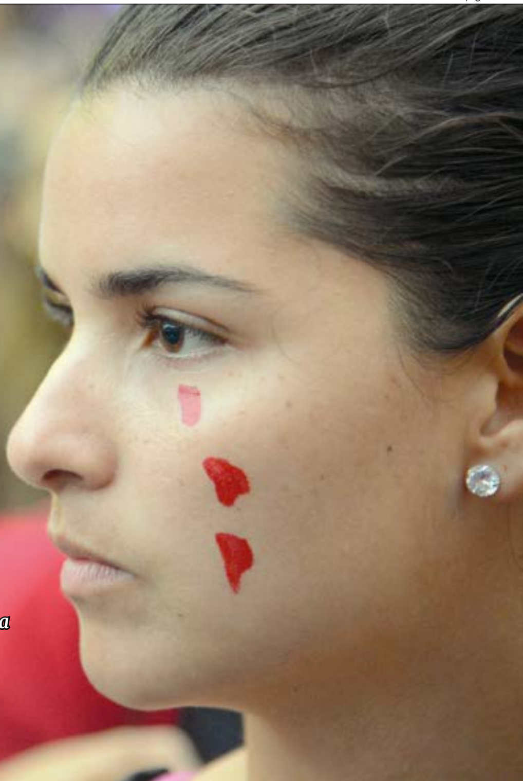
Tchélo Figueiredo/ Ilustração