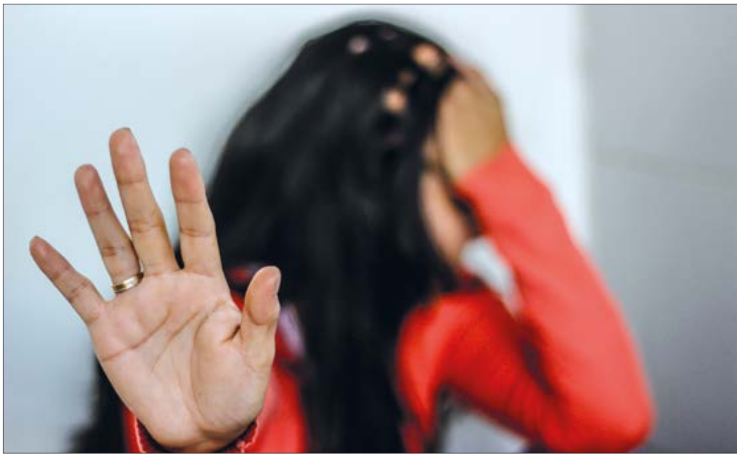
Em 2019, 3.022 procedimentos relacionados a vítimas femininas de violência doméstica e sexual foram realizados

Os que declararam ter uma profissão lideram o ranking de denúncias: pedreiros e empresários, ambos com 110 denúncias cada.