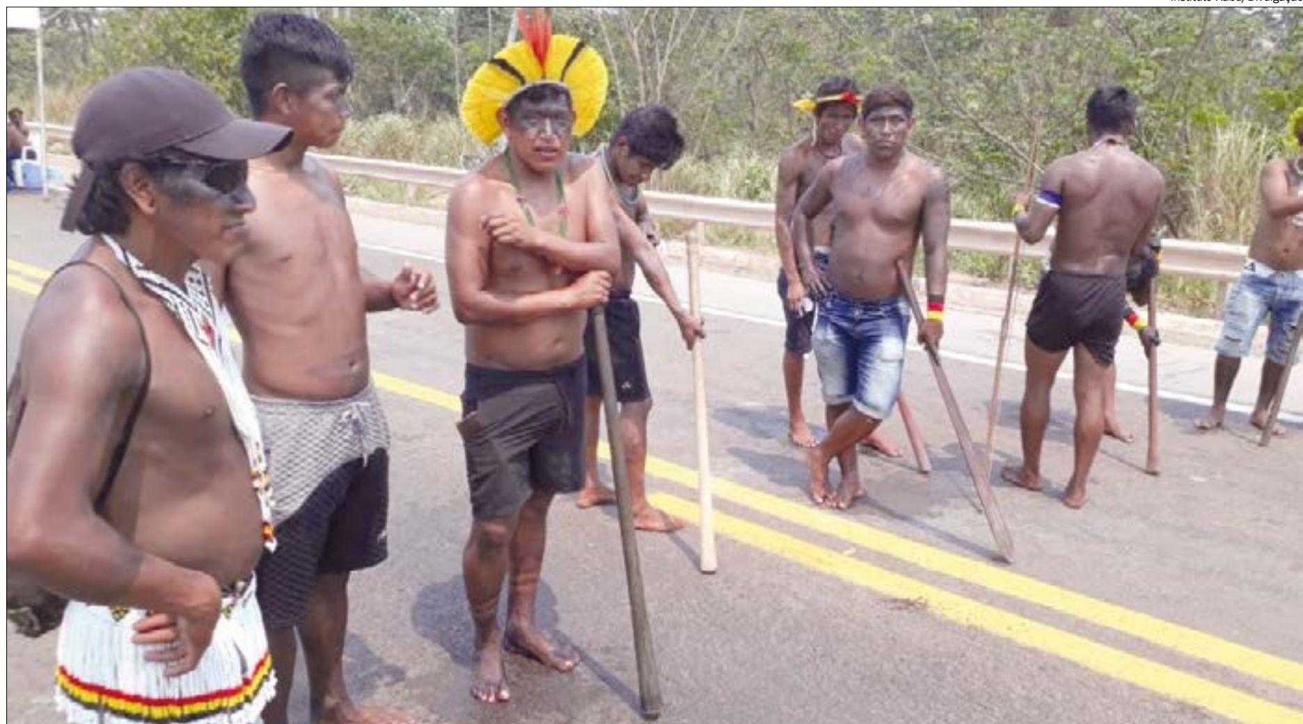
Principal rota de escoamento da produção de Mato Grosso segue fechada pelo povo Kayapó-Menkrãnoti no Pará

Caminhoneiros com carga que chegam ao local da paralisação não