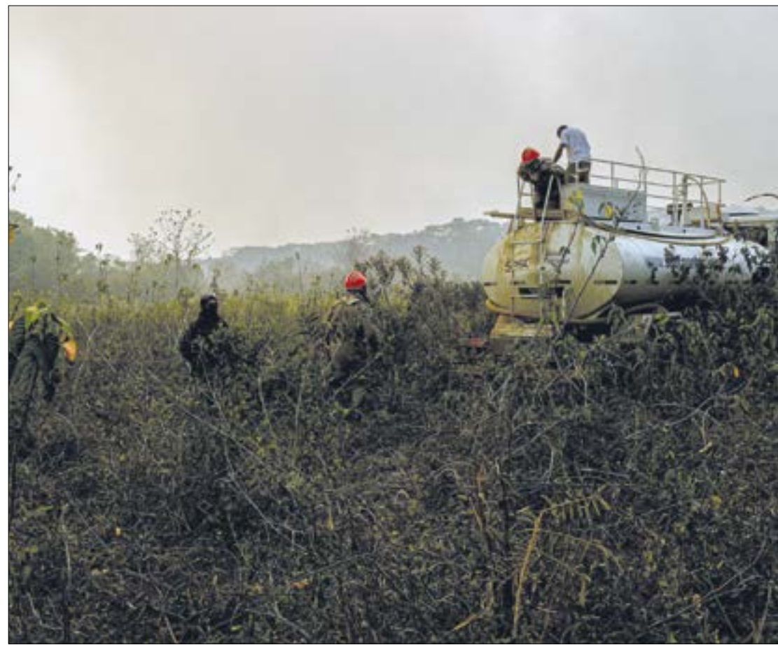
Em carta, pantaneiros pedem instrumentos eficazes de combate, controle e prevenção de incêndios florestais

O documento aponta o uso dos recursos do Fundo Constitucional de Desenvolvimento do Centro-Oeste (FCO) como linha de crédito emergencial nos casos de incêndios florestais nas propriedades rurais com áreas no bioma Pantanal. É citada também a criação de programas que vão garantir a sustentabilidade da região, das atividades econômicas e dos produtores rurais. (Com Assessoria de Imprensa)