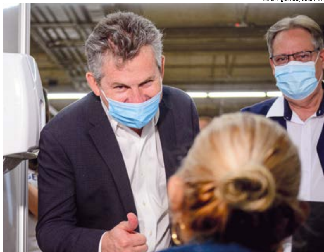
Governador destaca que ocupação de UTIs está em queda e permite reabertura do setor de eventos e cinemas

O setor de eventos é um dos mais atingidos pelo coronavírus em todo o mundo, devido ao fato de toda a atividade ser baseada na aglomeração de pessoas, um fator de risco para a transmissão do vírus. Em Mato Grosso, a realização de eventos está proibida há mais de cinco