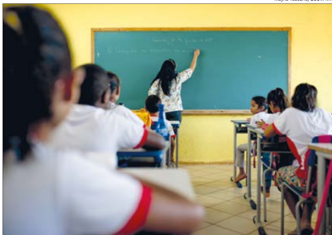
Em Mato Grosso, as aulas nas escolas estaduais ocorrem apenas pela internet e por meio de apostilas

Já no cenário nacional, o governo federal registrou três milhões, 456 mil e 652 casos confirmados da covid-19 e 111.100 óbitos oriundos da doença.