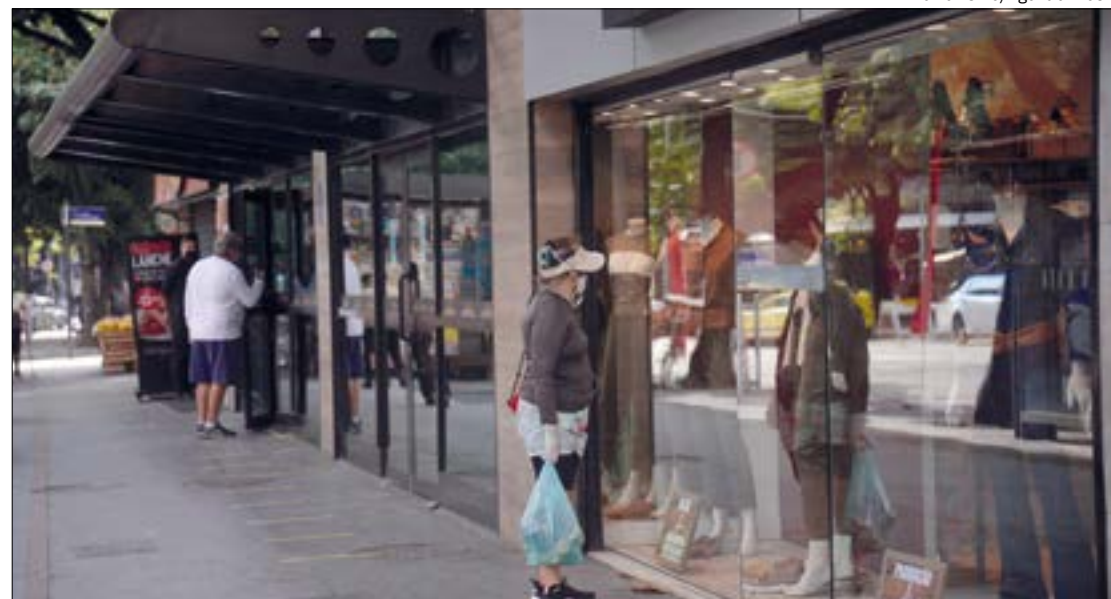
Pesquisa aponta que mais de 1 milhão de empregos foram perdidos no setor de alimentação durante a pandemia

IMPACTO DA PANDEMIA - Segundo números da Associação Brasileira de Bares e Restaurantes (Abrasel), o setor de alimentação gera 6 milhões de empregos em 1 milhão de estabelecimentos. O covid-19 já gerou 1,5 milhão de desempregados e 250 mil empresas fechadas nesta área da economia.