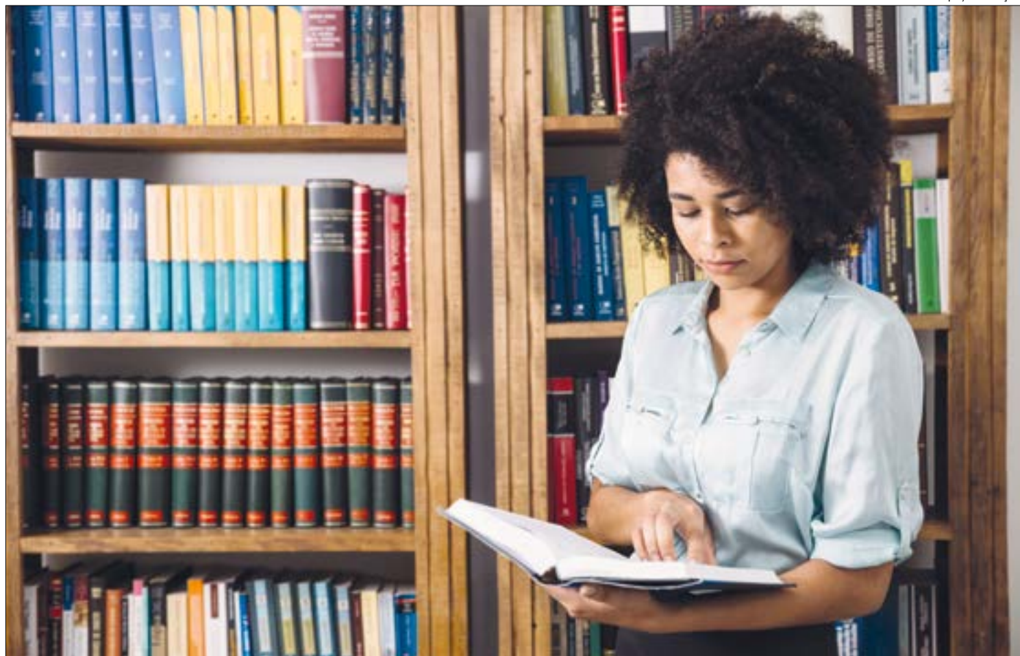
Romance, ficção e Histórias em Quadrinhos (HQs) passaram a ocupar o top 10 da lista de livros mais vendidos

mática e comunicação (22,7%); combustíveis e lubrificantes (5,6%); e hipermercados, supermercados, produtos alimentícios, bebidas e fumo (0,7%). Somente o segmento de artigos farmacêuticos, médicos, ortopédicos, de perfumaria e cosméticos (-2,7%), apresentou recuo nas vendas frente a maio de 2020.