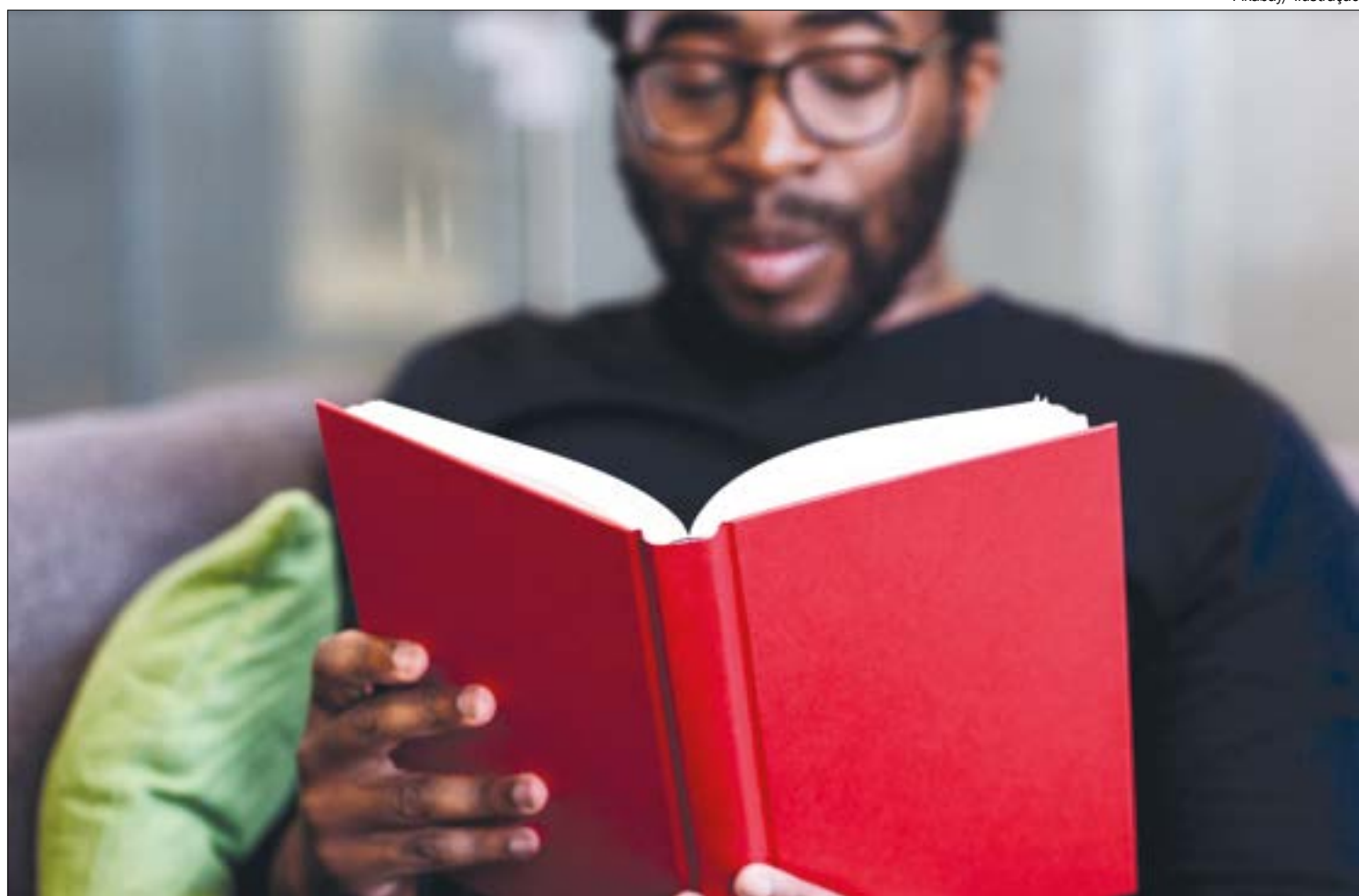
Livros preenchem vazio da quarentena e vendas registram crescimento de 69,1% em maio e junho deste ano

Com o fechamento do espaço físico, o comércio eletrônico passou a ser o único canal de venda do sebo Rua Antiga, em Cuiabá. Embora a empre-