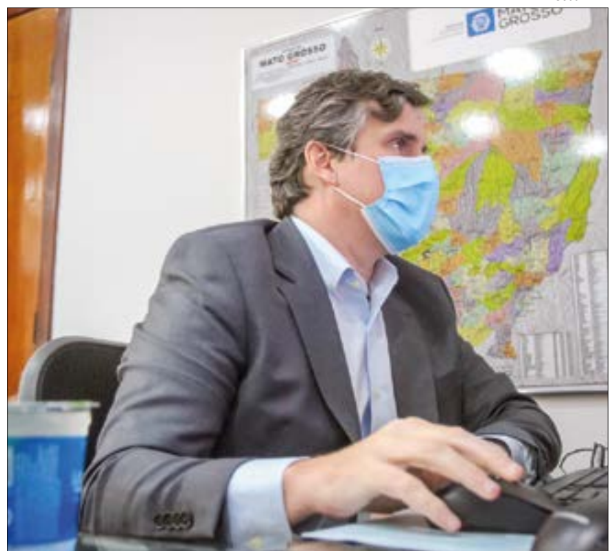
Gallo avalia que houve “excesso de otimismo” com o governo federal no início do ano