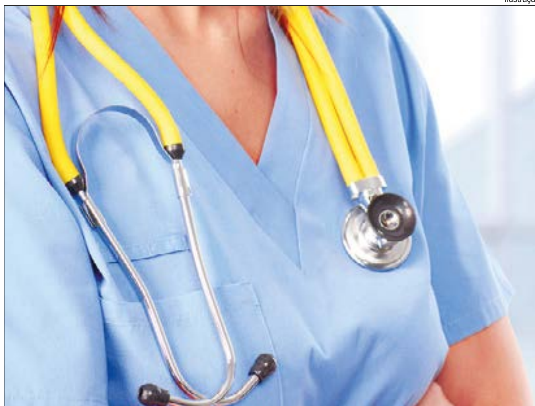
Após repercussão do caso, a instituição aceitou se reunir com o corpo estudantil e agendou uma reunião para esta quinta-feira (13)

"Ela disse que nós, estudantes, só poderíamos aprovar algo com articu-