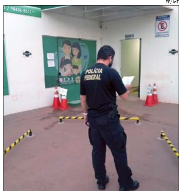
A quarta fase da Operação Tapiraguaia foi deflagrada para apurar fraudes licitatórias nos recursos do PNAE

* O nome da operação é uma referência à "Vila de Tapiraguaia", núcleo de povoação que originou o município de Confresa, MT. A palavra "tapiraguaia" é uma fusão dos termos Tapirapé e Araguaia.