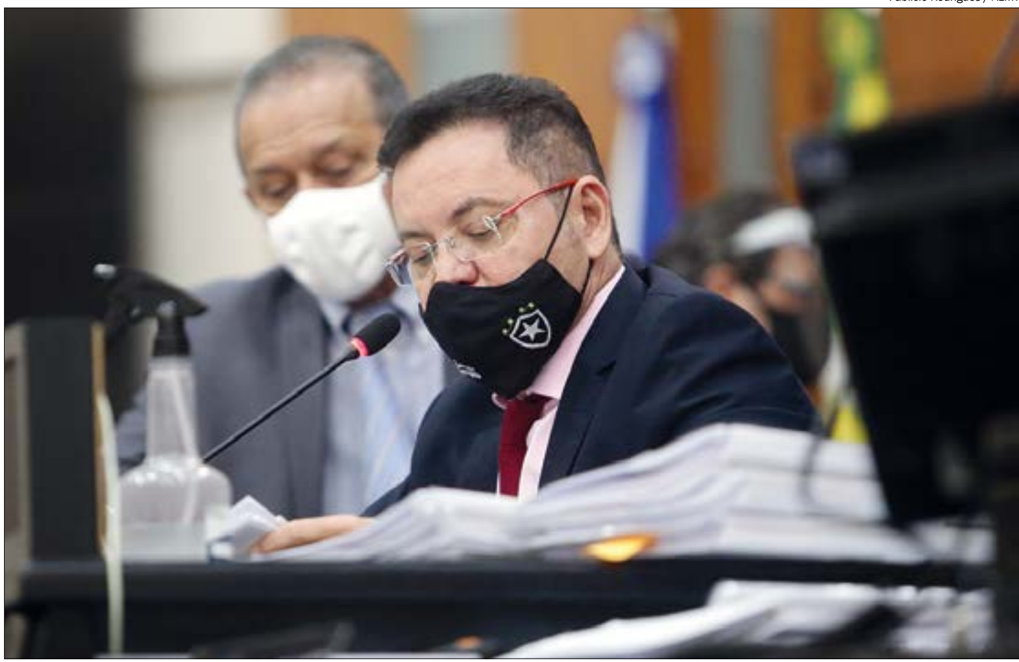
Deputados pediram uma série de destaques no projeto, sobre o que mudar no texto final da reforma

Ele também criticou o governo por ‘penalizar’ os servidores públicos ao mesmo tempo em que abre mão de quase R$ 7 bilhões em renúncias fiscais. “O tal déficit da Previdência é 20% disso. Todo sacrifício dos aposentados e pensionistas e servidores da ativa irá representar R$ 400 milhões a mais nas contas do Estado a cada ano. Em tese, para o déficit que o