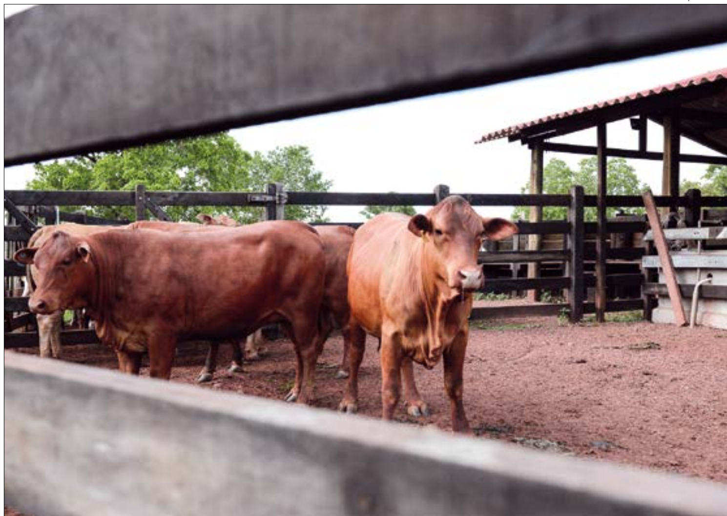
O mercado norte-americano aumentou sua demanda por proteína vermelha a partir de maio deste ano

“Fazer um boi precoce já estava sendo investido pela maioria dos pecuaristas de modo que não