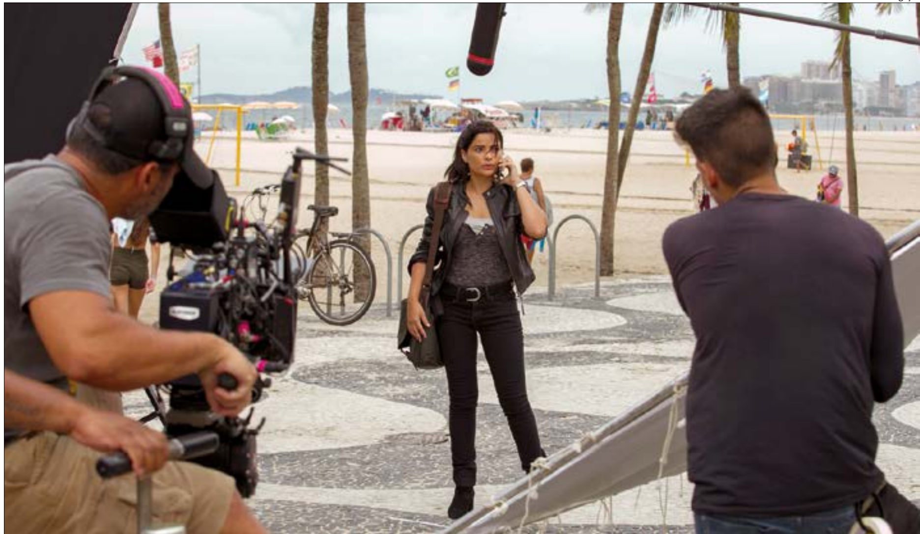
Gravações em praias estão completamente vetadas durante a pandemia, e há mais restrições para as externas

Segundo o portal Uol, um dia de gravação poderia render até 25 cenas antigamente. Agora, com a adoção dos novos protocolos de segurança para evitar os contágios por coronavírus, esse número caiu pela metade, mais ou menos. Por isso, a expectativa é que 'Amor de Mãe' e 'Amor Sem Igual' só voltem ao ar em 2021. Para desespero ainda maior dos fãs, a Globo decidiu reduzir o número de episódios