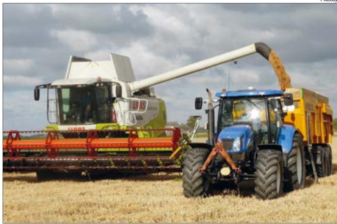
Mato Grosso, Goiás, Paraná e Mato Grosso do Sul produzem 90% da soja convencional brasileira

Em três regiões do país o saldo de criação de empregos foi positivo: Centro-Oeste (10.010), Norte (6.547) e Sul (1.699). A região Sudeste fechou o mês com perda de 28.521 vagas de trabalho e o Nordeste, com saldo negativo em 1.341.