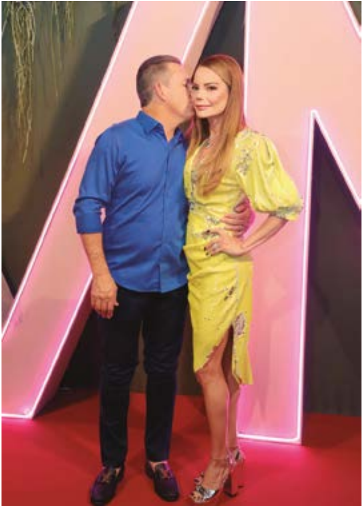
Não poderia ser diferente. O amor que envolve o governador Mauro Mendes e Virginia Mendes foi visível e emocionante aos olhos dos convidados