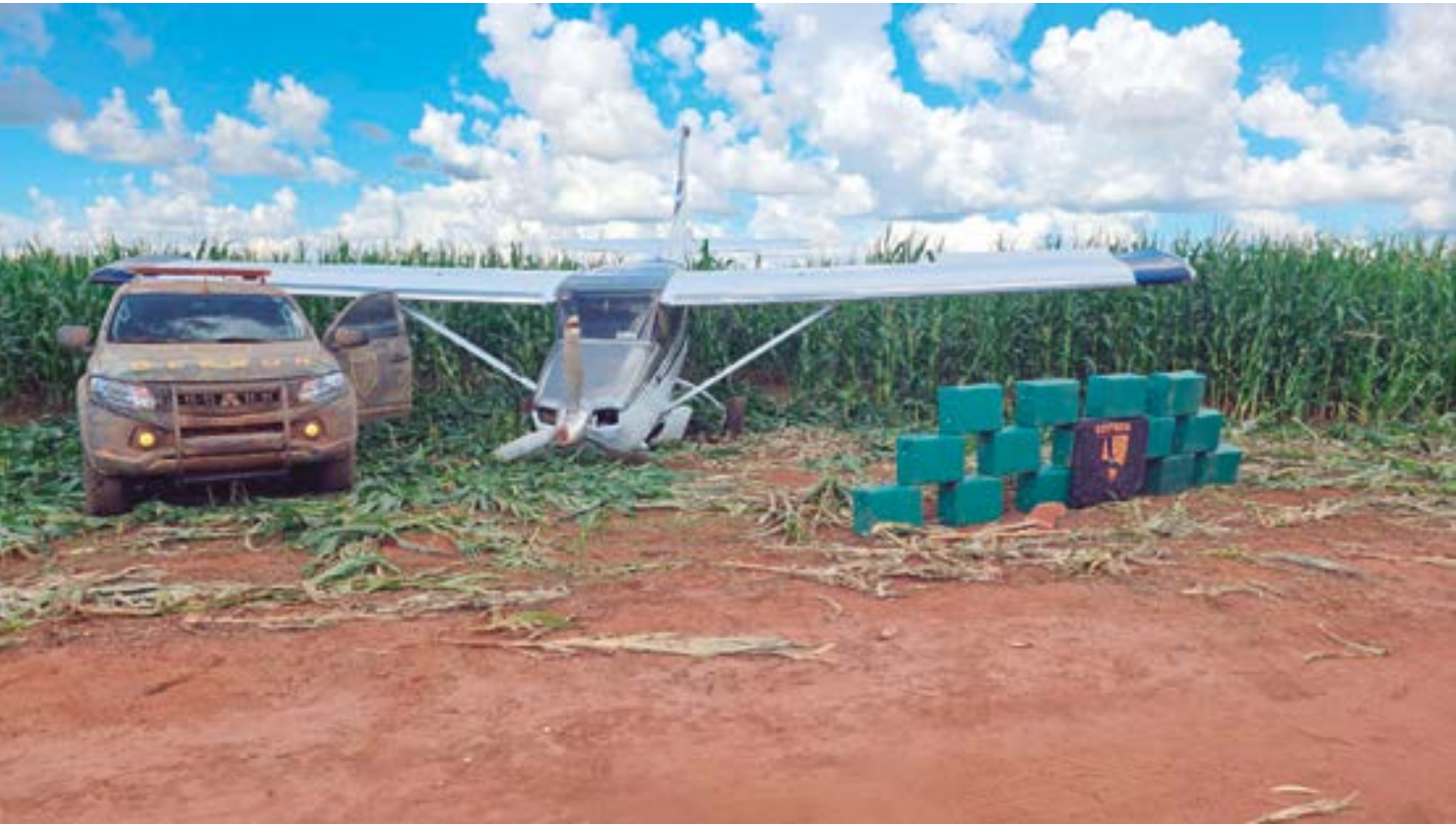
Só de cocaína, foram 23,6 toneladas apreendidas em 2024, o segundo maior volume do país

Mato Grosso avançou para a segunda colocação no ranking nacional de apreensões de cocaína em 2024, conforme aponta o Mapa da Segurança Pública de 2025, divulgado na quarta-feira (11) pelo Ministério da Justiça. As forças de segurança estaduais apreenderam, no total, 23,6 toneladas de cloridrato e pasta base da droga, superando em 3,8 toneladas o volume de 2023 (19,8 t). Com isso, o estado ultrapassou Mato Grosso do Sul e ficou atrás apenas de São Paulo, que retirou 47,9 toneladas de circulação. O levantamento também destacou Mato Grosso na 8ª posição entre os estados com maior volume de apreensões de maconha no último ano, com