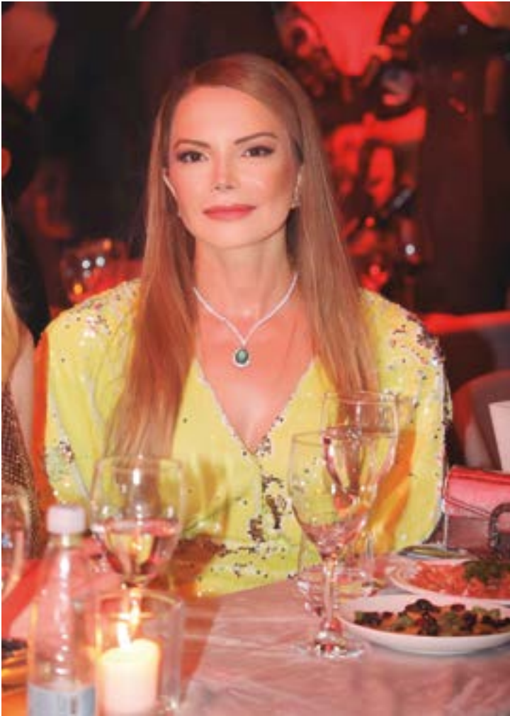
Bela e solidária, a primeira-dama do Estado, Virginia Mendes, aniversariou no último dia 04 com festa beneficente. Parabéns mais uma vez!!!