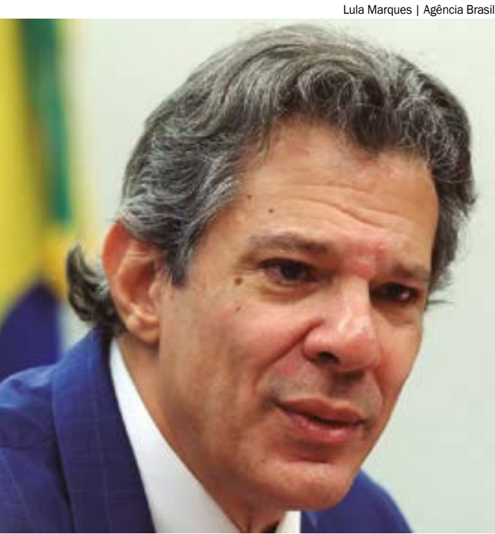
Lula Marques | Agência Brasil

Sobre os gastos com a compensação da União às previdências de servidores públicos estaduais e municipais, a pasta informou que o teto da dotação orçamentária inicial tem o objetivo de aumentar a eficiência na análise dos processos em que o governo federal é credor dos entes (estados e municípios). A Fazenda quer estimular o encontro de contas entre o que a União deve aos regimes de previdência estaduais e municipais e o que ela tem a receber deles.