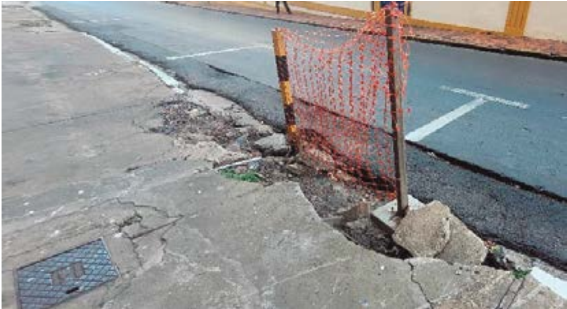
Trecho se transformou em um verdadeiro obstáculo urbano, oferecendo risco de quedas

“Isso aqui já virou parte da paisagem. A gente vê pedestre tropeçando, desviando pela rua, correndo risco de ser atropelado. É um descaso total com quem trabalha e circula aqui todos os dias”, reclama um comerciante, que preferiu não se identificar.