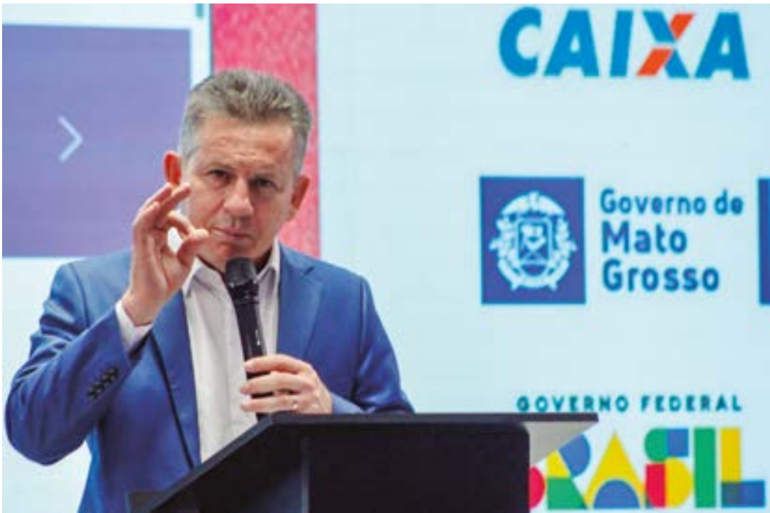
Segundo Mauro, todos os serviços da Santa Casa serão transferidos para outras unidades estaduais

“O governo vai transferir todos os serviços da Santa Casa, ampliando todos os serviços praticamente para o Hospital Albert Einstein que vai ser operado no Hospital Central. O governo já assumiu o Hospital de Câncer, ele vai assumir essa semana o Hospital Geral. Então, nós estamos remodelando, nós não temos porque ficar com uma unidade que custa caro, o aluguel ali custa mais de R$ 400 mil por mês sendo que a gente