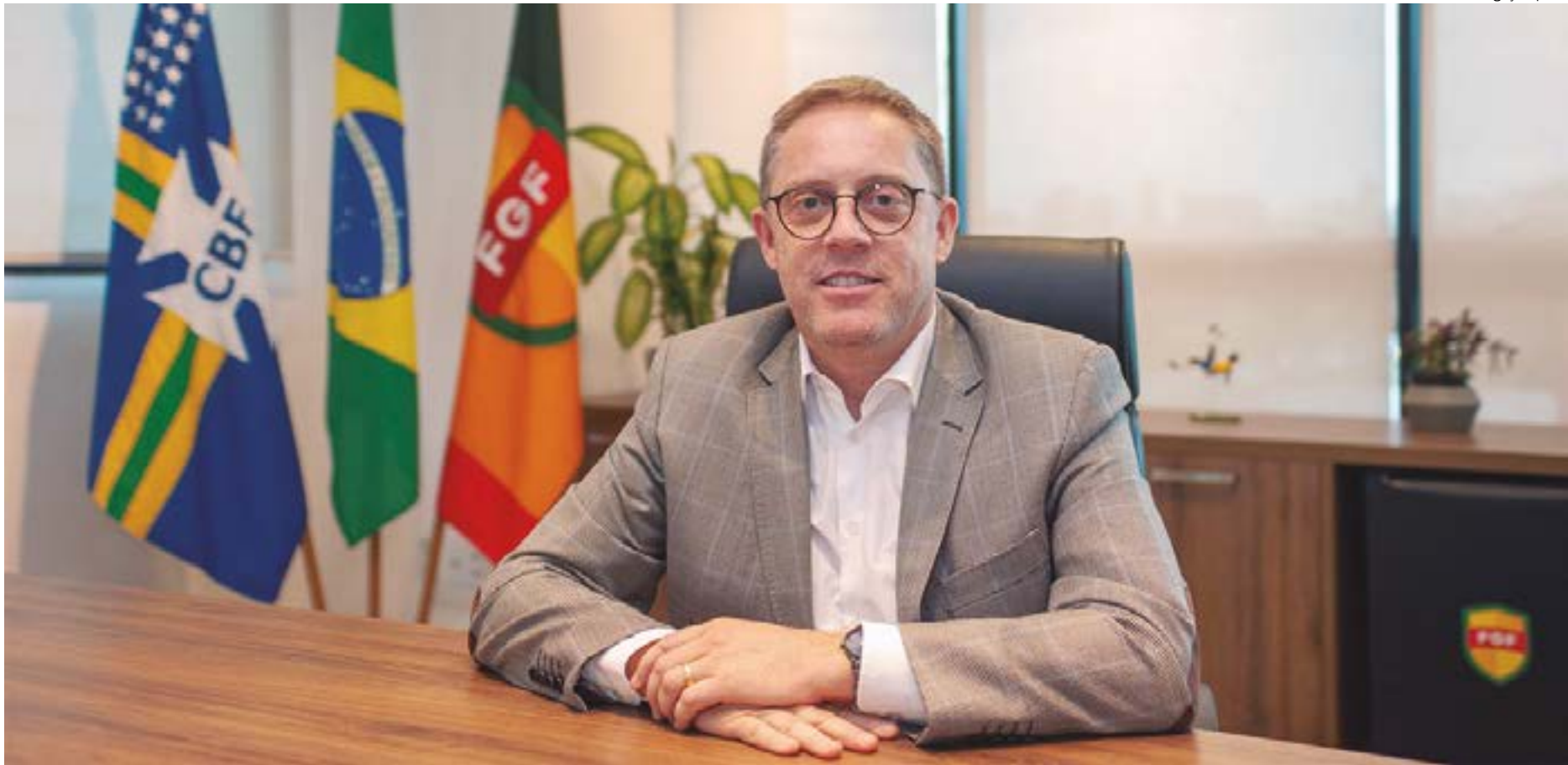
Hocsmán alertou para risco de sanções internacionais caso o eleição da FMF tenha interferência da Justiça

Hocsmán também alertou sobre o risco de sanções internacionais caso o processo eleitoral seja conduzido com interferência da Justiça comum, desrespeitando