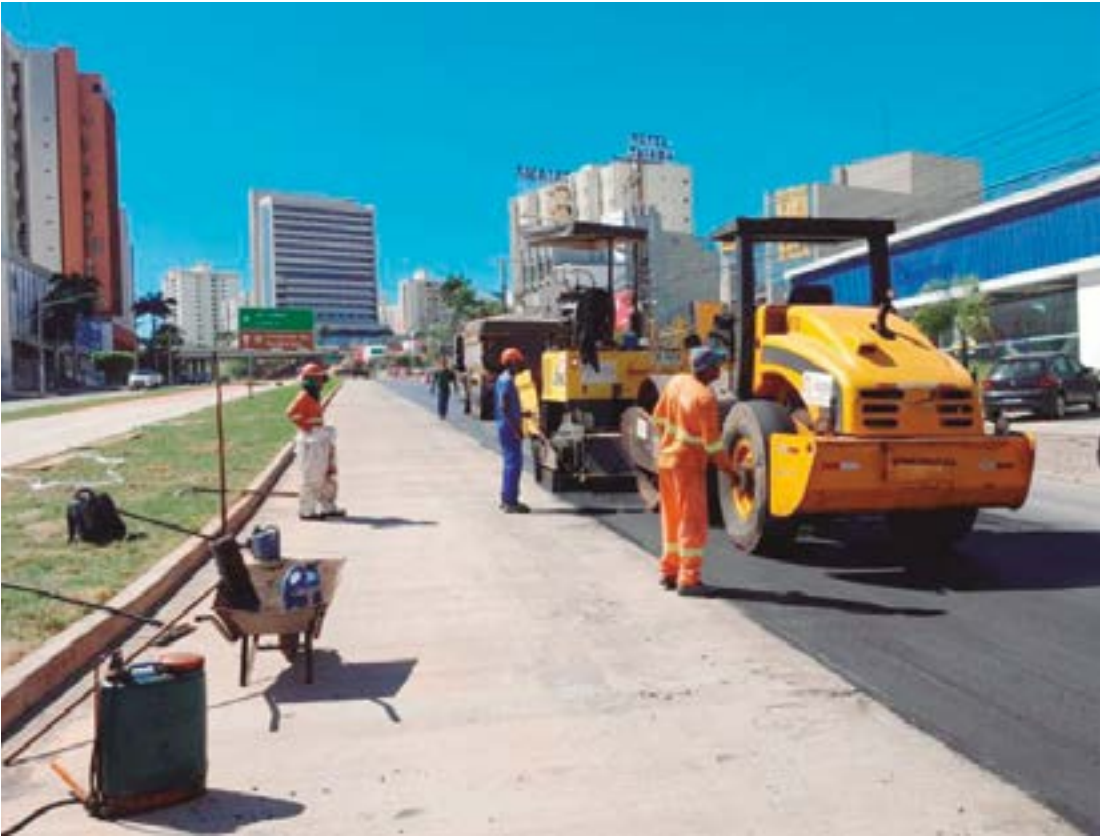
Consórcio tem poucos meses para concluir as obras de implantação do BRT na Avenida do CPA

NOVO CONTRATO - A Secretaria de Estado de Infraestrutura e Logística (Sinfra-MT) assinou, nas últimas semanas de maio, o contrato com o Consórcio Integra BRT, o primeiro para a conclusão das obras