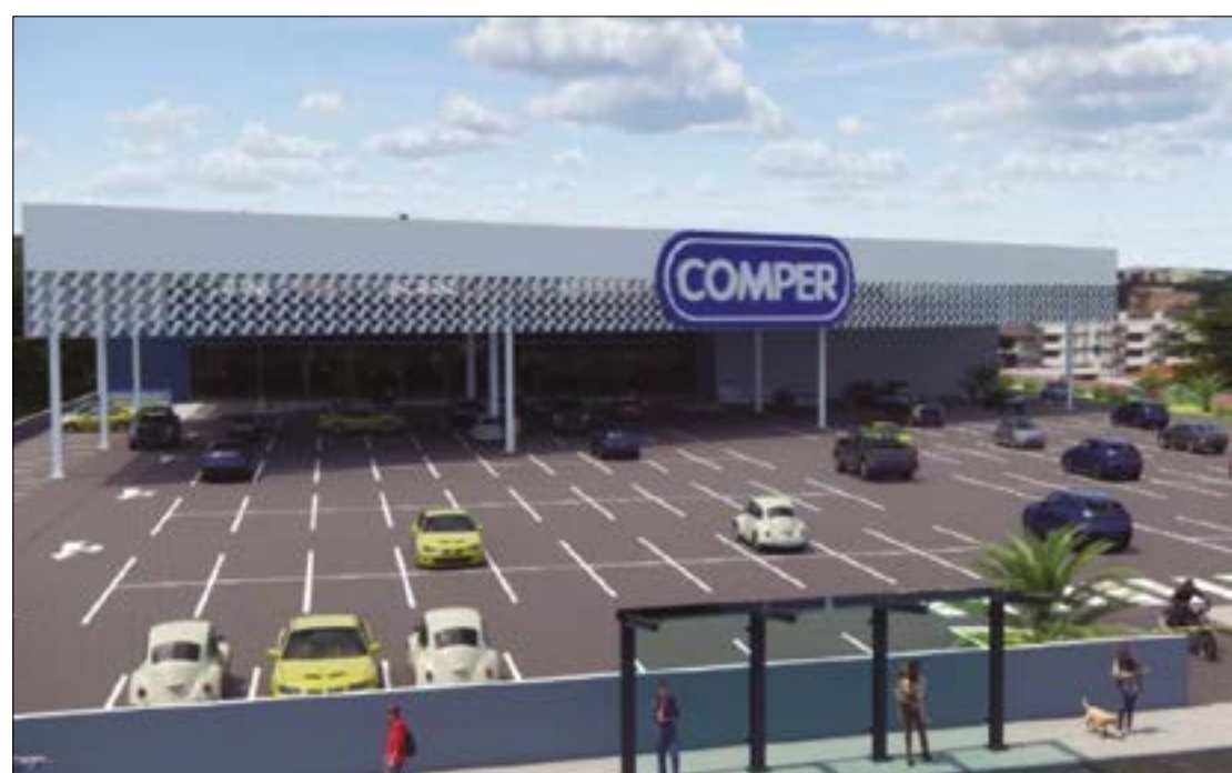
Inaugura hoje o Comper Belvedere