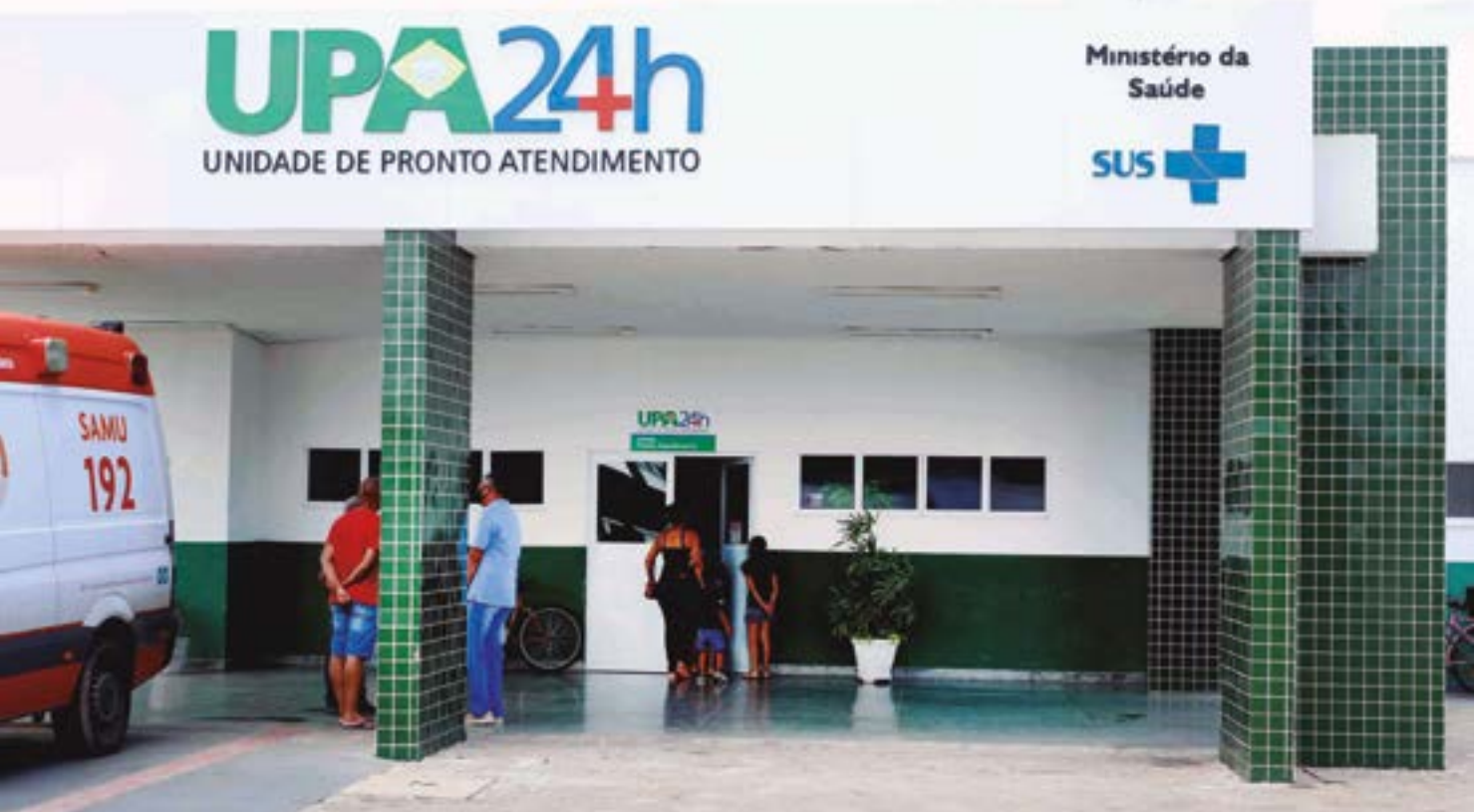
Novo médico será incluído nas equipes para atender pacientes às segundas e terças, dias com maior procura