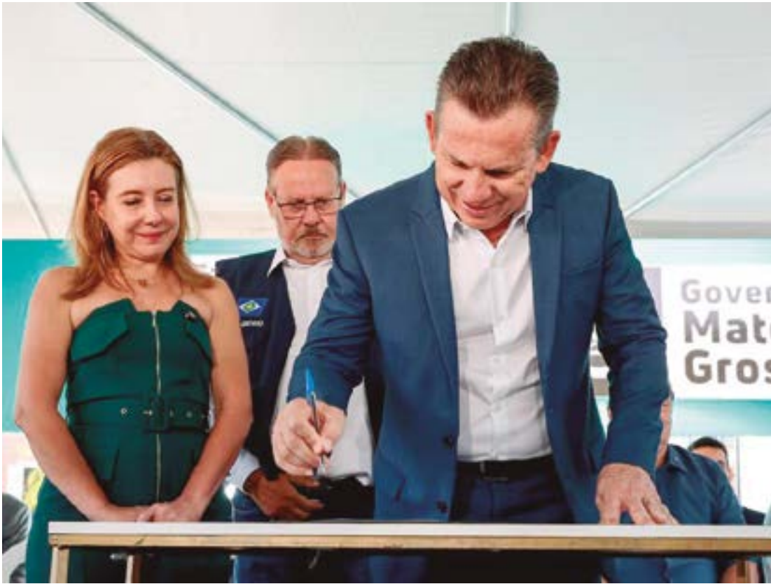
Do valor, R$ 11,7 mi são para a reforma do telhado e R$ 3,8 mi para compra de equipamentos

O governador Mauro Mendes afirmou que o repasse de R$ 15,5 milhões para o Pronto-Socorro Municipal de Várzea Grande foi feito para dar um fim na situação caótica da estrutura da unidade, em especial do telhado. O repasse foi oficializado na manhã de ontem, terça-feira (3.6). Do valor, R$ 11,7 milhões são para a reforma do telhado e R$ 3,8 milhões para a compra de novos equipamentos. Além disso, também foram entregues 50 camas hospitalares. Mauro havia vistoriado a situação da unidade nas últimas semanas, e constatou in loco a precariedade. “Não poderíamos que o caos continuasse no Pronto Socorro de Várzea Grande, da chuva invadindo lá dentro, e as pessoas internadas sem ter a mínima condição de se manter ali. O telhado está realmente caótico. Essa vai ser a melhor alternativa para ajudar o hospital a oferecer dignidade e melhores condições de atendimento à população”, destacou. A prefeita de Várzea Grande, Flávia Moretti,